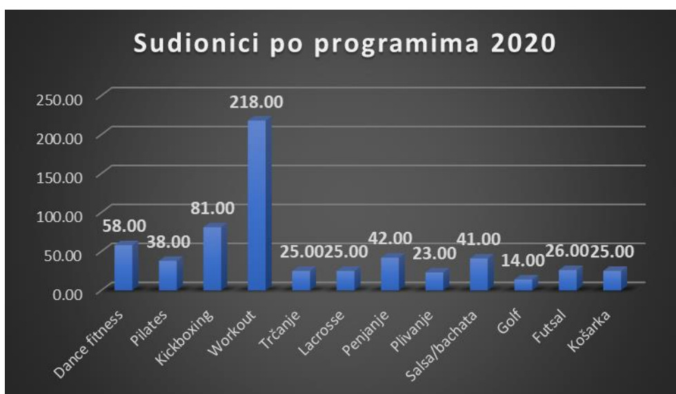
Graf 4. Sudionici po programima rekreacije u 2020./2021

Graf 4. prikazuje ukupan broj sudionika po pojedinim programima rekreacije u 2020./21. Analizom podataka primjetna je popularnost i kapaciteti pojedinih programa. Workout predstavlja najpopularniji program u kojem participira najveći broj studenata i studentica. Slijedi Dance fitness koji prema svojim kapacitetima može primiti veliki broj sudionika. Ostali programi, unutar svojih kapaciteta imaju manji broj sudionika.