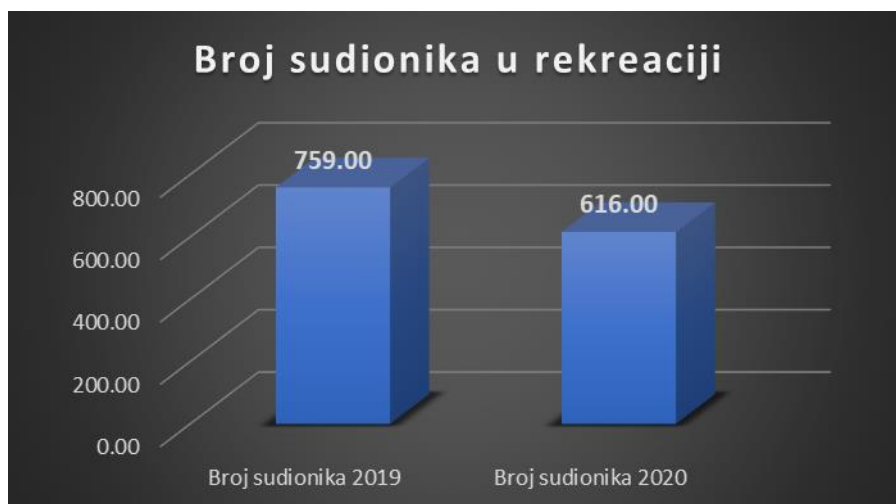
Graf 1. Broj sudionika rekreacije u 2019./2020. i 2020./2021.

Na Grafu 1. prikazan je ukupan broj sudionika rekreacije u akademskim godinama 2019./20. i 2020./21. koji ukazuje na zamjetan pad.