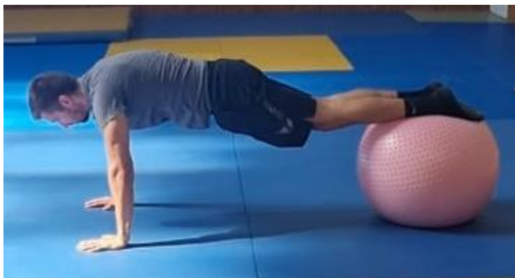
Slika 55. Upor prednji na fitness lopti

Nakon vježbi s stabilnim osloncem na red dolazi teža varijanta, tj. vježba s osloncem koji nema fiksnu poziciju. Ovu vježbu možemo izvoditi pomoću lopte ili trx-a. Oslonac je rukama o pod i nogama na lopti. Aktivacijom nogu i trupa kukove postaviti na optimalnu visinu te održavati poziciju narednih 45 sekundi. Ova vježba se može izvoditi tako da noge budu oslonjene o pod, a podlaktice postaviti na loptu. Cilj ove vježbe kontrolirati tijelo pri ne stabilnom osloncu te samim tim dodatno povećati aktivaciju trupa.