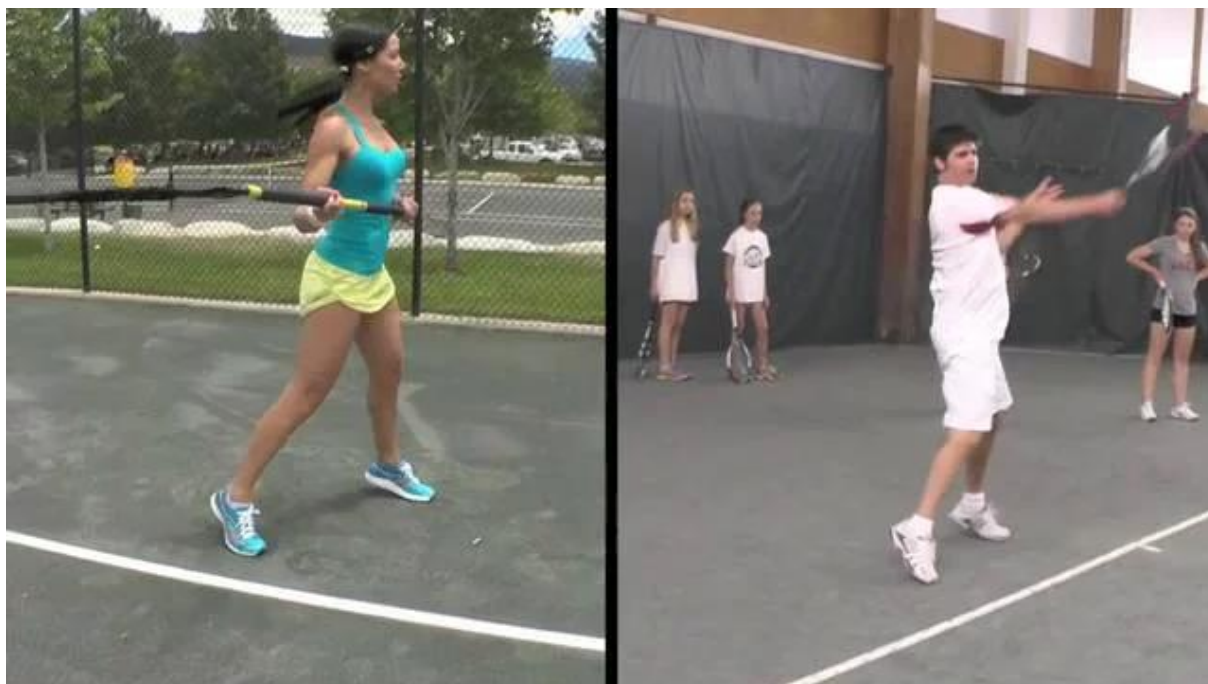
Slika 2. RIP trenažer u tenisu

Kako bi adekvatno mogao odgovoriti na određene nepredvidive okolnosti i poteškoće trener sa sobom uvijek mora imati kvalitetan „arsenal“ trenažnih sredstava kojima uz svoju educiranost i kreativnost može zamijeniti rad u opremljenom fitness centru ili dvorani (suzpenzijske trake, RIP trenažeri-slika 2., setovi elastičnih guma, ljestvice i markeri za agilnost, sklopive prepone, manje medicinke, bugarske vreće ili girje, jastuke za proprioceptivni trening kao i još cijeli niz drugih sredstava za trening koji se mogu smjestiti u jednu ili dvije veće sportske torbe, a koje trener može nositi dok eventualno one teže rekvizite može držati na dohvat ruke ili u automobilu).