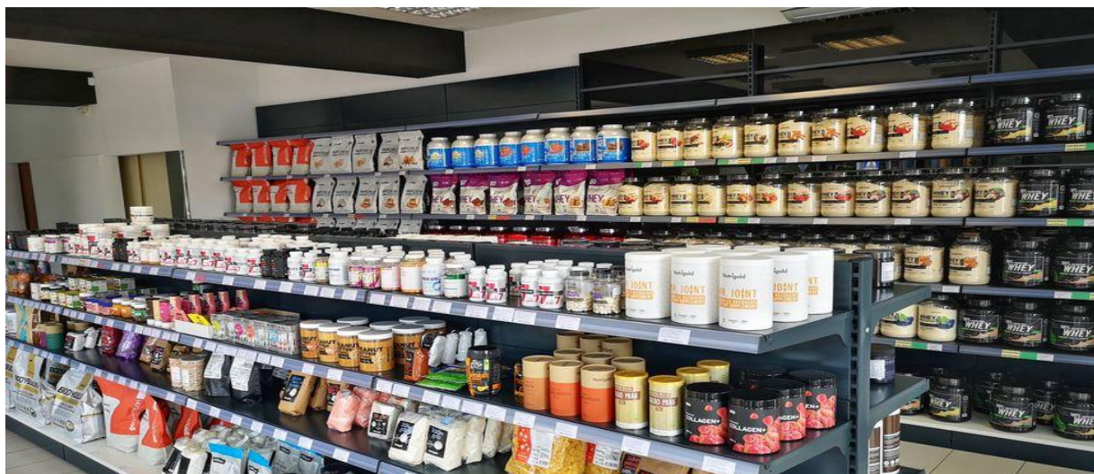
Slika 3. Veliki izbor dodataka prehrani

- spriječiti propadanje i osigurati napredak i rast mišića(razni proteinski pripravci i derivati sa naglaskom na smanjen sadržaj ugljikohidrata-izbjegavati takozvane gainere);