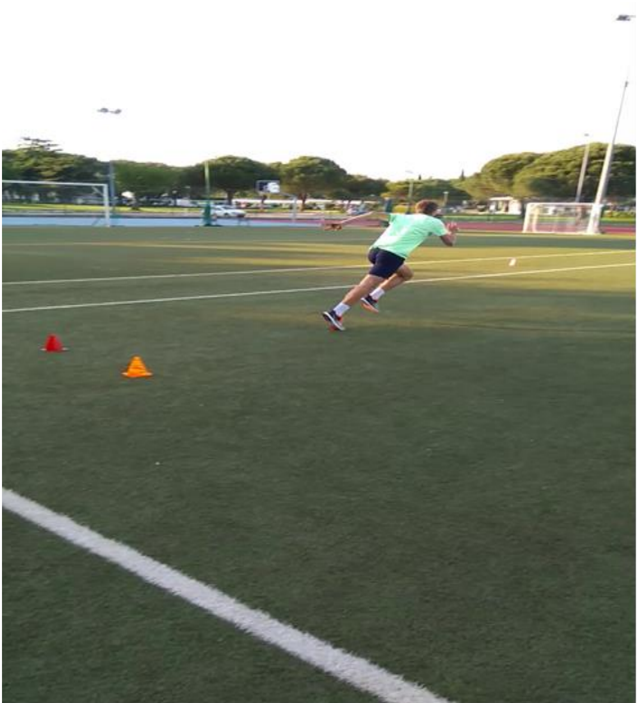
Slika 5. Trening brzine, istrčavanje kratkih dionica

Već negdje od četrnaeste godine tenisača mogu se početi raditi složeniji programi sa postupnim povećanjem kao i uvođenjem dodatnih opterećenja (brzina reakcije ,razne brze promjene smjera - uz prethodno provedene programe prevencije ozljeda i slično)