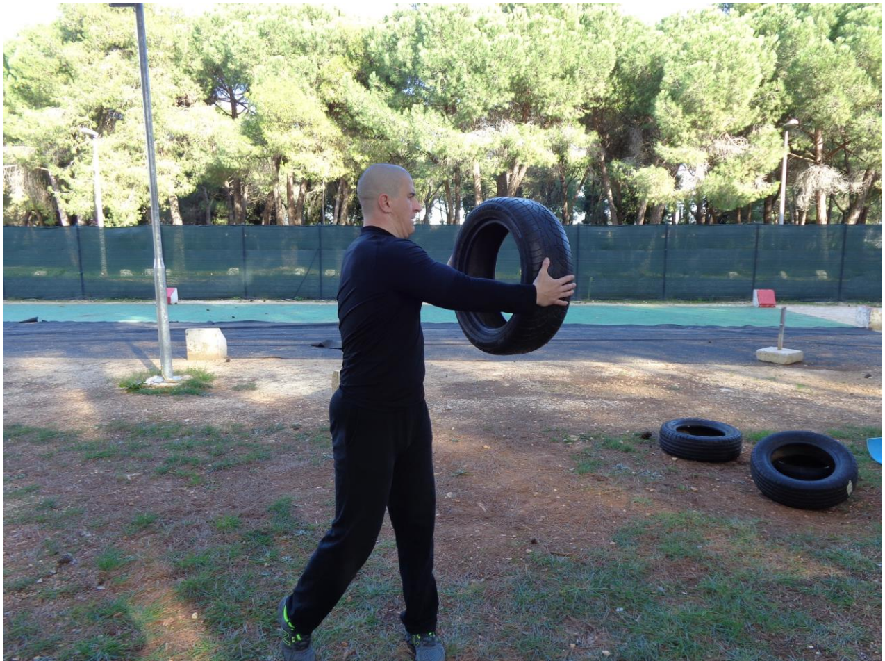
Slika 8. Primjena automobilske gume u pliometrijskom treningu, zasuci trupa sa automobilskom gumom, (izvor: vlastiti album)

Ovisno o kreativnosti trenera moguće je izraditi i prilagoditi razne nove rekvizite za izvođenje pliometrijskih vježbi, sa priručnim sredstvima (uz poštivanje mjera sigurnosti) pa se tako često viđaju ručno rađeni pliometrijski sanduci i klupice ,kose i nagibne podloge, razne vrste prepona ,košarkaške i nogometne lopte punjene pijeskom umjesto medicinki i lopti za nabijanje u pod (wall ball).