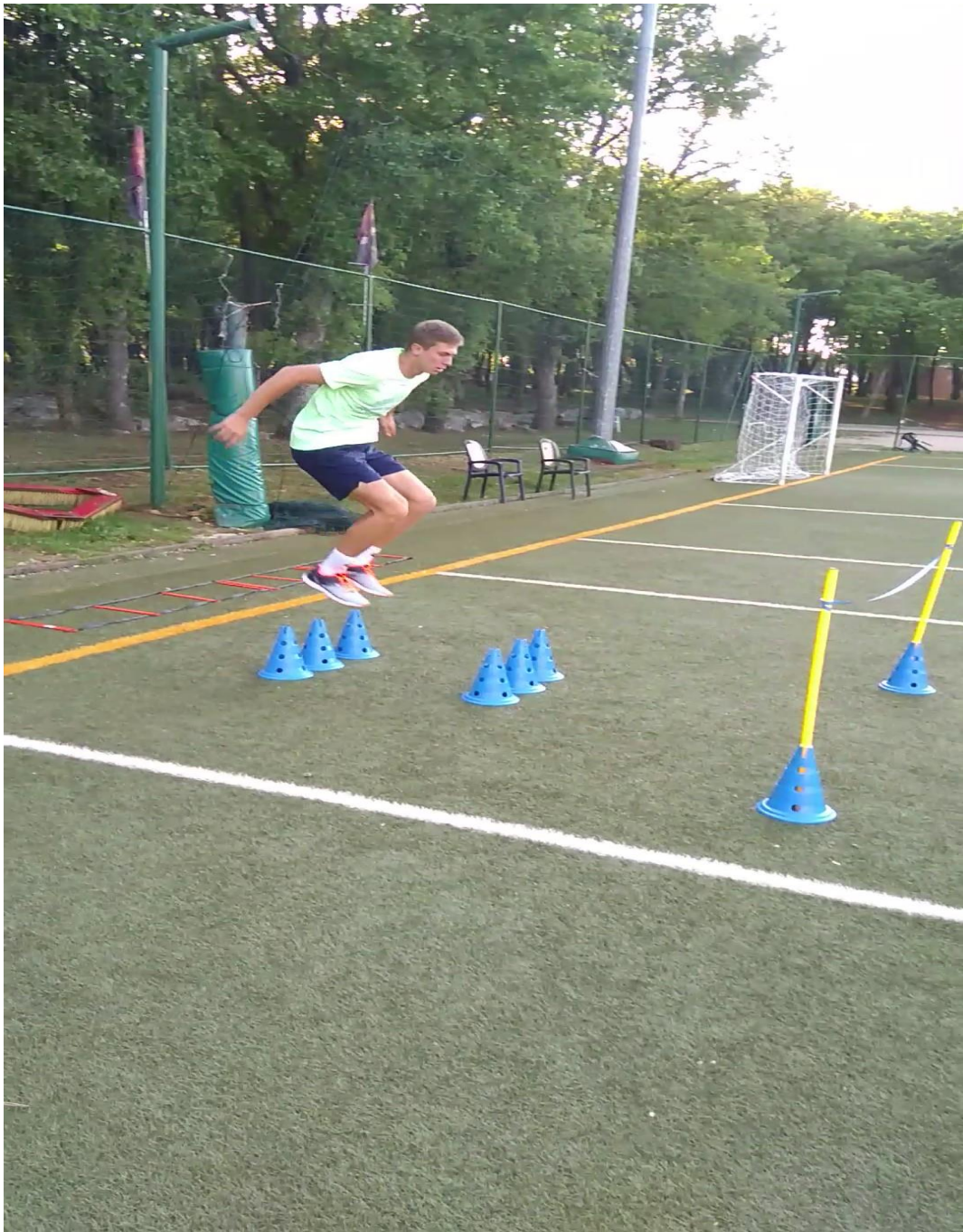
Slika 6. Preskakanje čunjeva manje visine