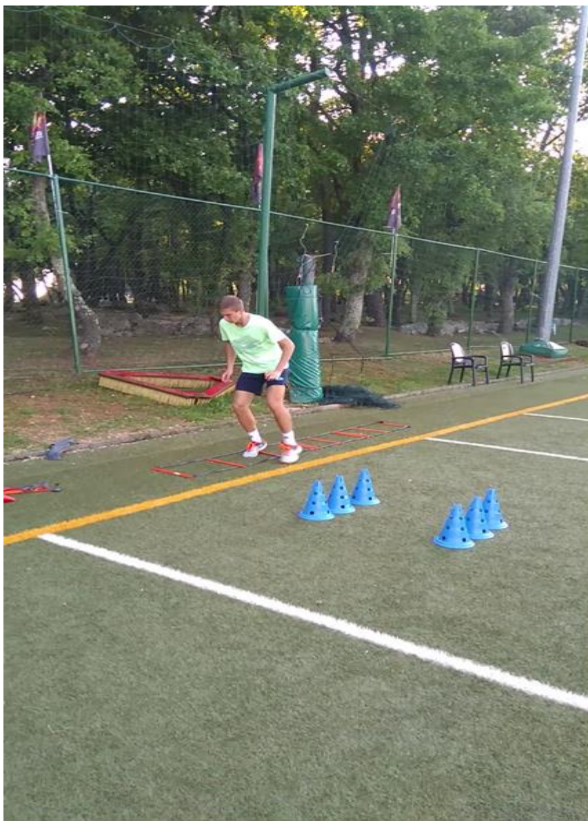
Slika 4. Ljestvice za razvoj agilnosti

Posebnu pozornost razvoju agilnosti treba usmjeriti nakon četrnaeste godine tenisača, i tu treneri mogu uz pomoć nekoliko jednostavnih trenažnih rekvizita (ljestvice-Slika 4., markeri, štapovi i dr.) kreirati bezbroj treninga, što ima za cilj izbjegavanje monotonije i zasićenosti.