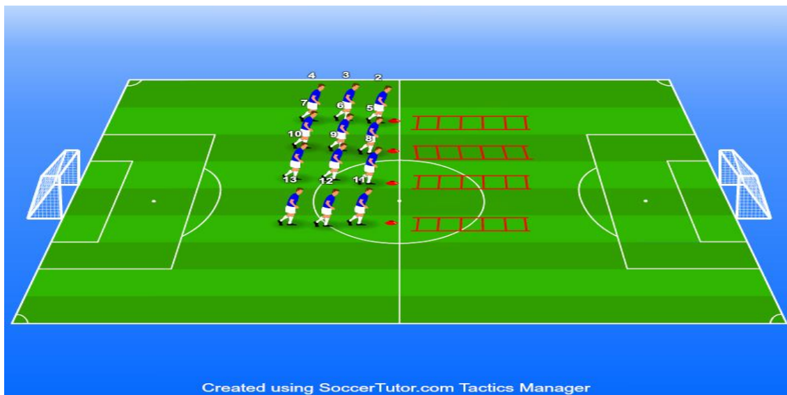
Slika 5. Prikaz različitih vježbi na koordinacijskim ljestvama

- Eksplozivnost - tehnika i osnovne vježbe s jednoručnim utezima ili pločama