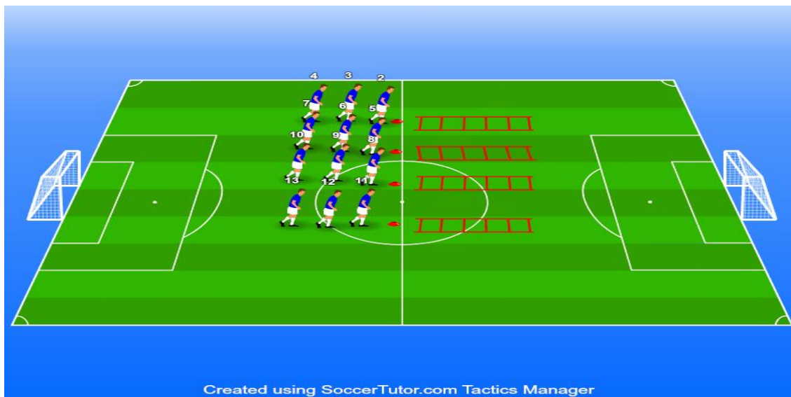
Slika 5. Prikaz različitih vježbi na koordinacijskim ljestvama

- Eksplozivnost - tehnika i osnovne vježbe s jednoručnim utezima ili pločama