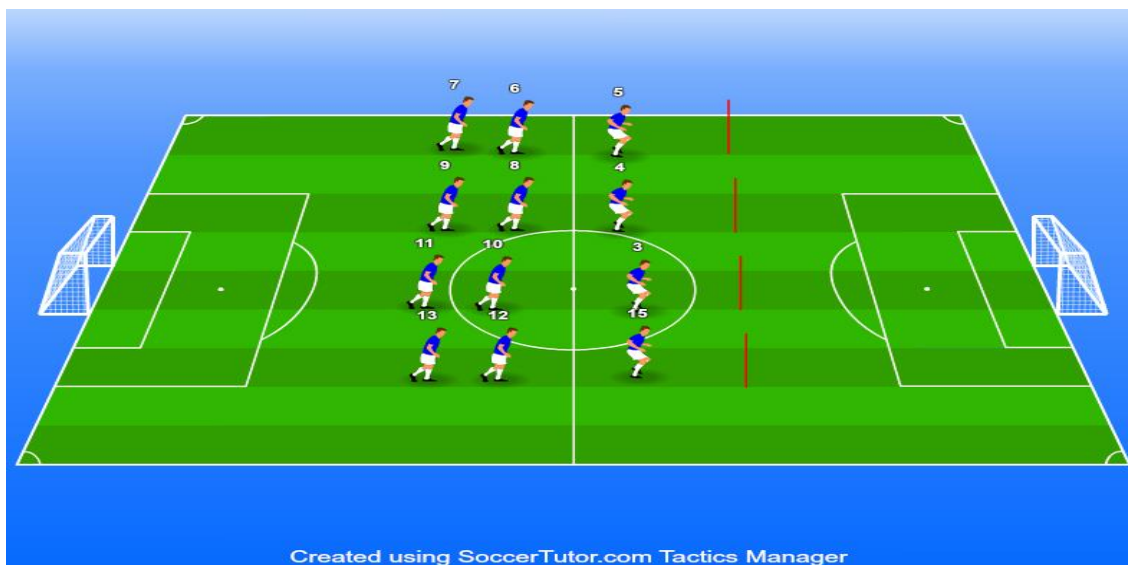
Slika 3. Prikaz vježbe različitih vrsta skipova i vježbi tehnike trčanja

Primjeri vježbi za razvoj brzine u fazi inicijacije: