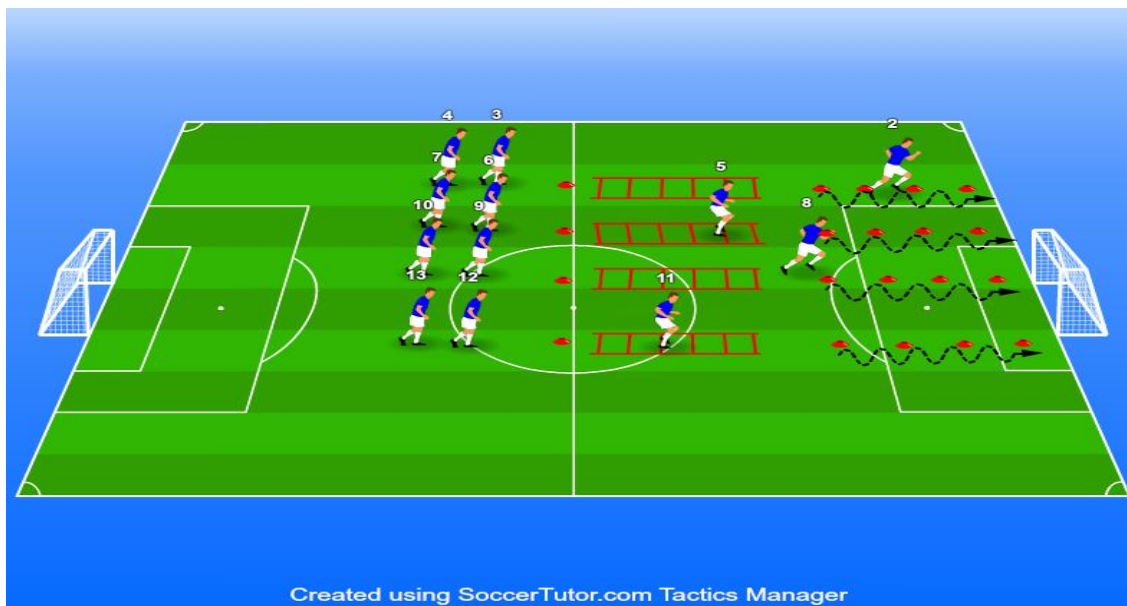
Slika 6. Prikaz različitih vježbi na koordinacijskim ljestvama u kombinaciji sa zig-zag kretnjama