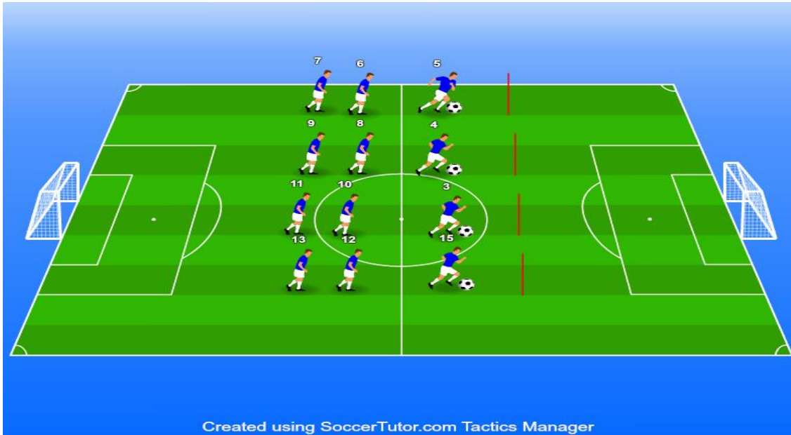
Slika 4. Različiti oblici štafeta