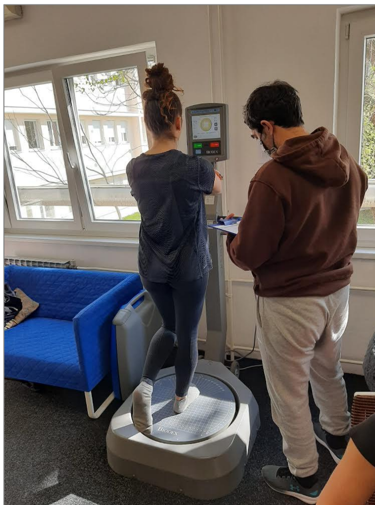
Slika 4. Mjerenje unilateralne statičke ravnoteže na Biodex-u

„Postural Stability“ testom (PS) mjeri se sposobnost ispitanika da projekciju centra težišta tijela zadrži u centru. Kao rezultat testa na ekranu BBS-a ispisuje se Overall Stability Indeks (OSI) koji predstavlja prosječan nagib platforme u svim smjerovima za vrijeme testiranja tj. kut otklona platforme od horizontale (Spasić, 2013). Veća stabilnost na platformi izražena je manjim indeksom. Zadatak ispitanika je da projekciju centra težišta tijela zadrži u središtu koordinatnog sustava ili što bliže središtu što je duže moguće.