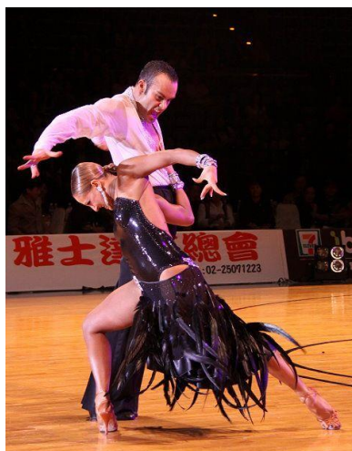
10.Slika: Paso doble