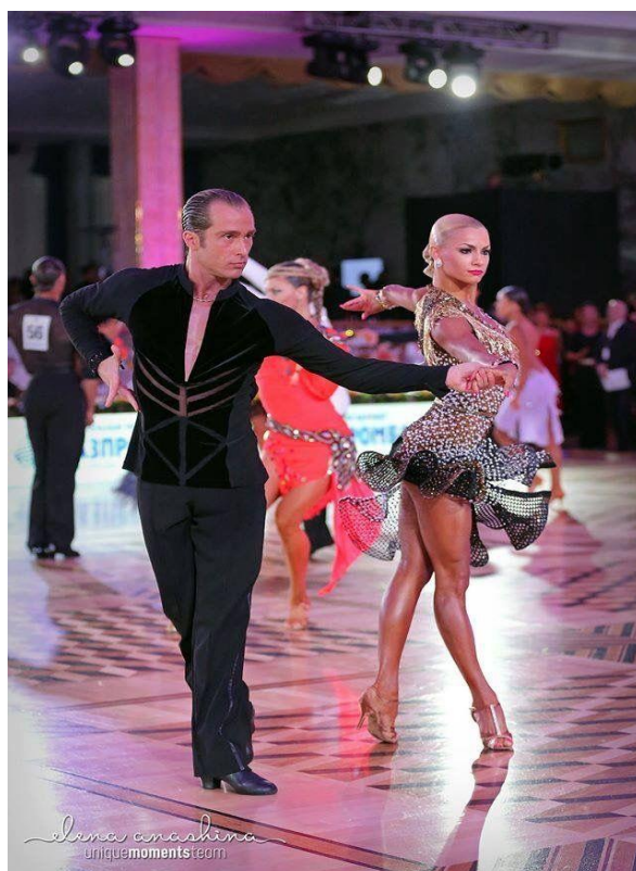
8.Slika: Cha cha cha