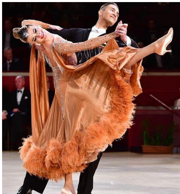
2.Slika: Engleski valcer