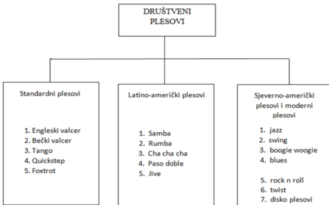
1.Slika: Podjela društvenih plesova