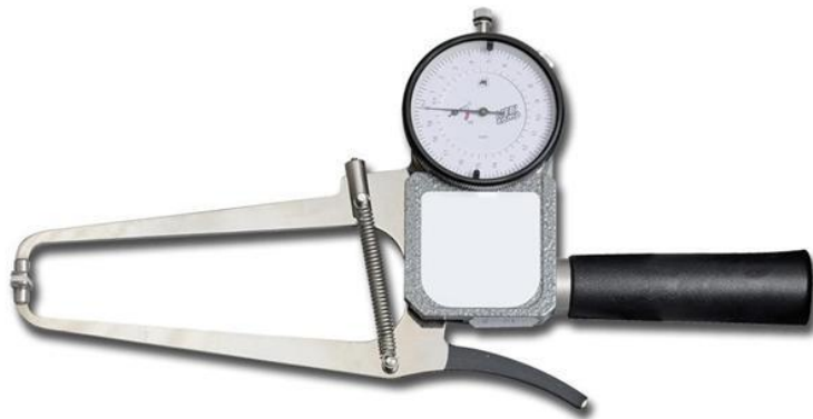
Slika 2. Kaliper, uređaj za mjerenje kožnih nabora