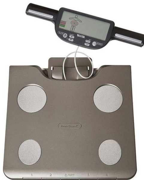
Slika 4. Vaga koja radi na principu bioelektrične impedancijske analize [izvor: https://www.physiosupplies.eu/tanita-bc601 , posjećeno: 10.09.2021.]