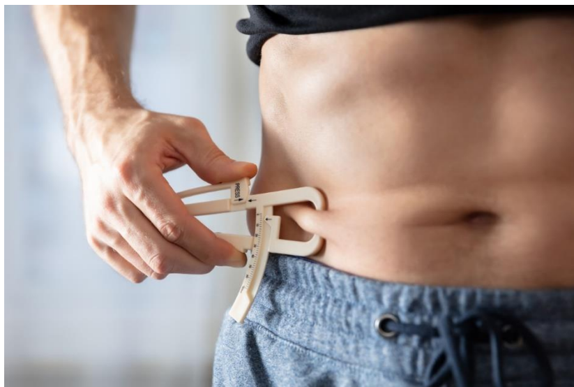
Slika 3. Mjerenje kožnih nabora trbuha kaliperom