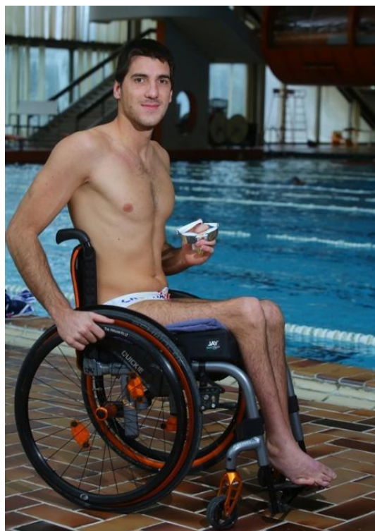
Slika 11. Arthrogryposis

Termin arthrogryposis složen je od grčkih riječi »arthron« što znači zglob i »grypos« što znači savinut, iskrivljen. U novije vrijeme koristi se naziv multiple kongenitalne kontrakture ili arthrogryposis označava se pri rođenju vidljivo stanje ograničene pokretljivosti zglobova u vrlo raznolikih bolesti. Definicija: - neprogresivna prirođena bolest koja je određena slabo razvijenim i kontrahiranim mišićima, simetričnim položajem udova, deformacija zglobova te zadebljanim kontrahiranim zglobnim čahurama. Osjetilni je sustav na udovima očuvan, a inteligencija je normalna. Pojava je bolesti sporadična, a način nasljeđivanja nije poznat. Bolesnici imaju karakterističan klinički izgled – rameni zglob je aduciran i u unutrašnjoj rotaciji, lakatni je zglob češće u ekstenziji nego u fleksijskom položaju, a ručni je zglob u položaju fleksije i ulnarne devijacije. Na donjim udovima kukovi su u izraženoj fleksiji i abdukciji, te u vanjskoj rotaciji i mogu biti luksirani, koljena su često fiksirana u fleksiji ili pak hiperekstendirana, dok je za stopala karakteristično da su u položaju rigidnog equinovarusa.