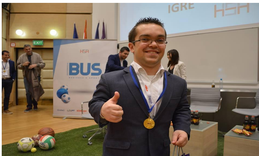
Slika 7. Ahondroplazija

Ahondroplazija je najčešći oblik patuljastog rasta. Odlikuje se jako skraćenim kostima udova, a kosti trupa su najčešće normalne dužine dok je lubanja povećana, dok inteligencija ostaje normalna. Nastaje zbog nedovoljnog rasta i okoštavanja hrskavice. Poremećaj je izražen već pri rođenju. Postoji mogućnost smanjenog opsega pokreta u zglobovima koji uz manju dužinu udova može stvarati probleme u svakodnevnom funkcioniranju. Visina tijela nikad ne prelazi 130 centimetara. Značajno je da zglobna hrskavica nije oštećena i bolesnici nemaju problema vezanih za zglobove. Djeca s ahondroplazijom u prvim godinama života sklona su čestim upalama srednjeg uha, što može uzrokovati oslabljen ili čak gubitak sluha. Zbog malog prsnog koša ova djeca ponekad mogu imati i respiratornih problema.