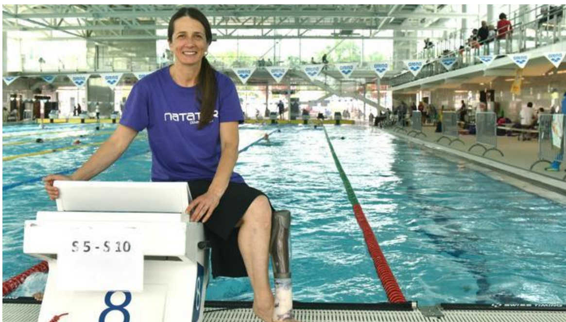
Slika 19. Ana Sršen hrvatska paraolimpijka osvajačica medalje na svjetskim prvenstvima

Ana je u disciplini 100 m slobodno osvojila srebrnu medalju, a na XV Mediteranskim igrama u španjolskoj Almeriji u istoj disciplini je osvojila brončanu medalju. Veliki je to uspjeh s obzirom da se natjecala u mješovitoj kategoriji s plivačicama koje su imale manji stupanj invaliditeta. Ana Sršen je bila sudionica na četiri Paraolimpijade i to u Atlanti 1996., Sydneyu 2000., Ateni 2004. i Pekingu 2008. U Atlanti je osvojila 4. mjesto u disciplini 100 m prsno, a u Ateni je bila također četvrta u disciplini 400 m slobodno. Od 1998. do 2005 Ana Sršen je na raznim natjecanjima šest puta rušila svjetske i tri puta europske rekorde. Ana Sršen je 1997. dobila državnu nagradu za šport "Franjo Bučar". 2008. godine je dobila priznanje Zagrebačkog športskog saveza osoba s invaliditetom. (Tuđan, 2019)