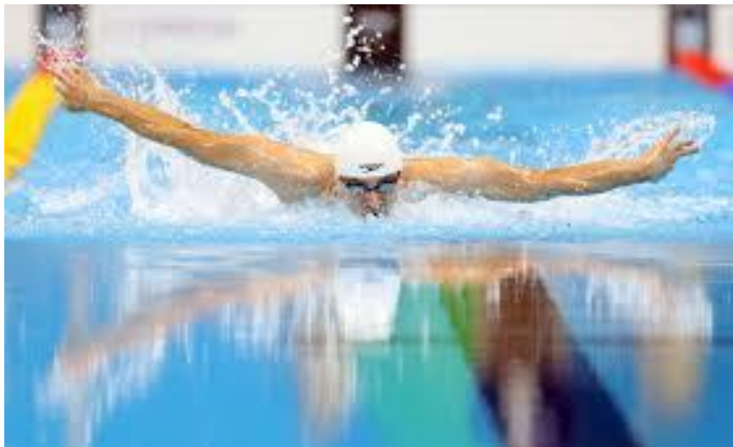
Slika 18. Kristijan Vincetić hrvatski paraolimpijac europski prvak I svjetski rekorder