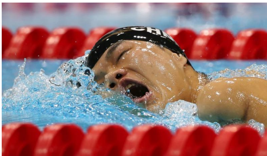
Slika 1. Primjer fizičkog oštećenja

Svjetsko para plivanje služi za tri skupine oštećenja - fizičko, intelektualno i vidno.