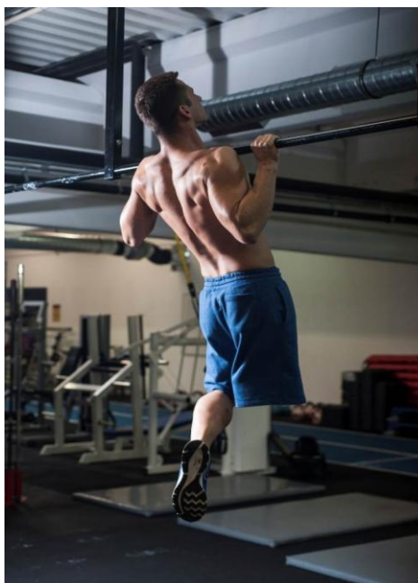
Slika 10. Amputacija noge

Amputacija je kirurški zahvat kojim se odstranjuje dio uda u koštanom području, a dezartikulacijom se odstranjuje dio ili cijeli ud u području zgloba. U populaciji iznad 60 godina glavni uzrok amputacije donjih udova jesu bolesti krvnih žila koje zajedno s dijabetesom čine više od 80% svih uzroka zbog kojih se u oboljelih poduzima amputacija. U dječjoj i mladenačkoj dobi najčešći uzrok amputacija i to u 90% slučajeva jest ozljeda, a zatim tumori i prirođene deformacije. Amputacije na gornjim udovima najčešće su uzrokovane ozljedom, a u djece prirođenom anomalijom, Izbor razine amputacije vrlo je odgovoran i danas vrijedi pravilo da se amputacija mora učiniti što perifernije. Teži se postići što duži bataljak, cilindričan na potkoljenici, koničan na natkoljenici, dobro pokriven mekim tkivom, koštani dio pokriven muskulaturom, dobro opteretiv i bezbolan. Idealan bataljak ima očuvanu senzibilnost, dobru motoriku i urednu pokretljivost zglobova. Fantomski osjećaj imaju gotovo svi bolesnici u kojih je obavljena amputacija i to je osjećaj prisutnosti amputiranog dijela uda. Fantomska bol je rijetka i obilježena je jakim grčevitim bolima u izgubljenom ud.