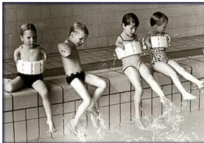
Slika 9. Dysmelia

Može biti prisutna na jednom ili više ekstremiteta, većeg ili manjeg stupnja – od manjeg broja prstiju do potpunog ne funkcioniranje jednog ili više ekstremiteta.