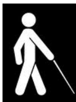
Slika 12. Međunarodni znak za osobe s oštećenjem vida

Općenito govoreći razvoj motorike ovisi s jedne strane o maturaciji organskih sustava a s druge strane o vježbanju. Motoričke aktivnosti novorođenčadi većinom su refleksne prirode, ali kasnije viši kortikalni centri preuzimaju kontrolu pokreta. Kod slijepe djece postoje i objektivna ograničenja u vježbanju motorike. Za slijepu djecu okolina ima manju stimulativnu vrijednost nego za djecu normalnog vida, u slijepe djece ne postoji mogućnost vidne imitacije i kod njih ne postoji vizuomotorička koordinacija.