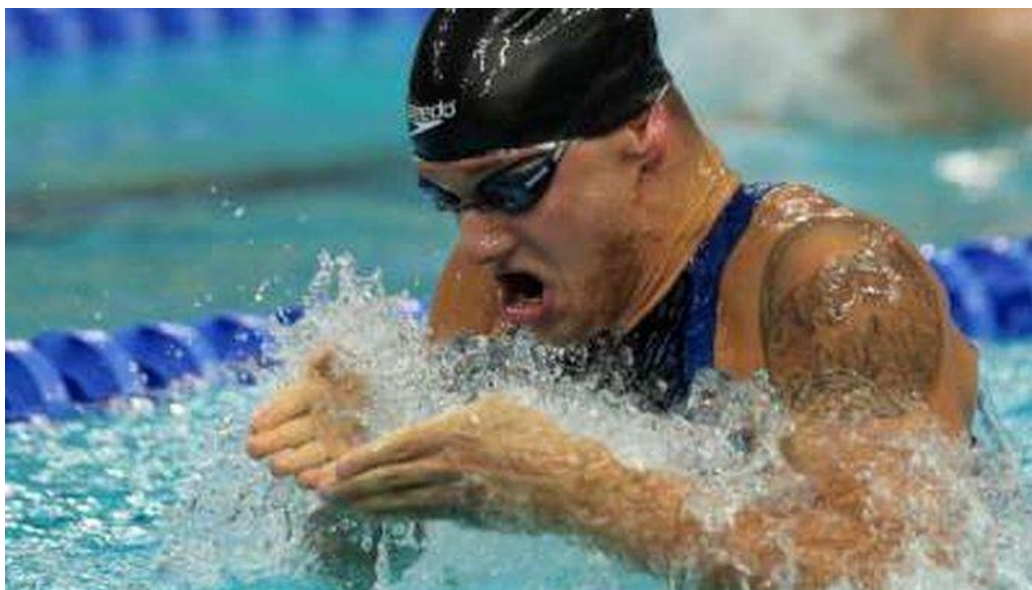
Slika 16. Mihovil Španja hrvatski paraolimpijac osvajač 4 medalje na paraolimpijskim igrama

Na svom prvom velikom natjecanju, IPC Europskom prvenstvu u njemačkom Braunschweigu, osvaja srebrnu medalju u disciplini 400 m slobodno, dok dvije godine kasnije postaje europski prvak u istoj disciplini, s novim rekordom europskih prvenstava. Premijeru na Paraolimpijskim igrama imao je 2000. godine u Sydneyu, gdje je nastupio kao najmlađi član reprezentacije, a sa 16 godina i tri finala ujedno je bio i najuspješniji. Na IPC Svjetskom prvenstvu za plivače s invaliditetom prvi put je nastupio 2002. u Mar de Plati, u Argentini, gdje je osvojio srebrnu i brončanu medalju u disciplinama 100 m leđno i 400 m slobodno. Najzapaženije rezultate postigao je na Paraolimpijskim igrama 2004. godine u Ateni, gdje se okitio s tri brončane medalje u disciplinama 100 m leđno, 400 m slobodno i 200 m mješovito.