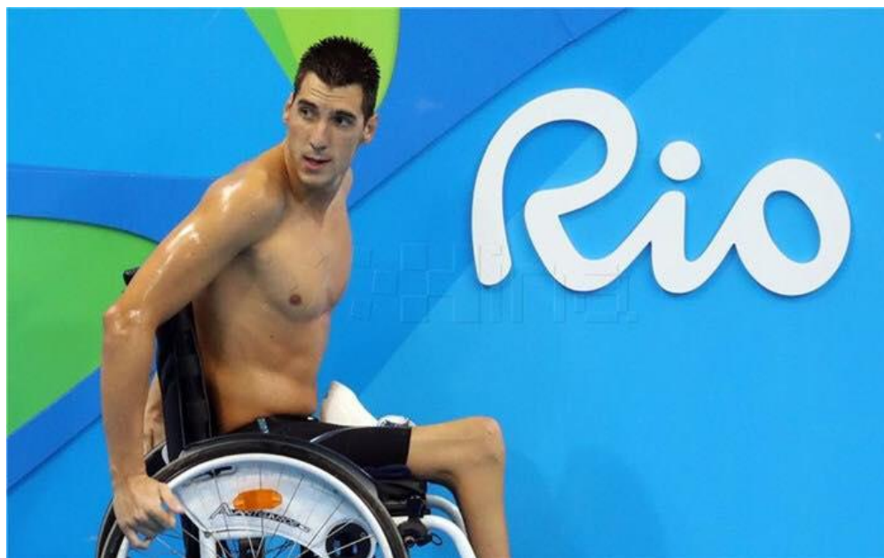
Slika 17. Dino Sinovčić hrvatski paraolimpijac svjetski prvak

Sportom se počeo baviti 2004. godine kao rekreativni plivač zbog poboljšanja zdravstvenog statusa. Već iduće godine postaje član Plivačkog kluba Mornar Split te shvaćajući da bez problema može pratiti tempo drugih plivača, počinje s ozbiljnim treninzima. Godine 2006. priključuje se novoosnovanom Plivačkom klubu za osobe s invaliditetom Cibal, u kojem pod stručnim vodstvom prof. Slobodana Glavčića sve do danas odrađuje treninge.