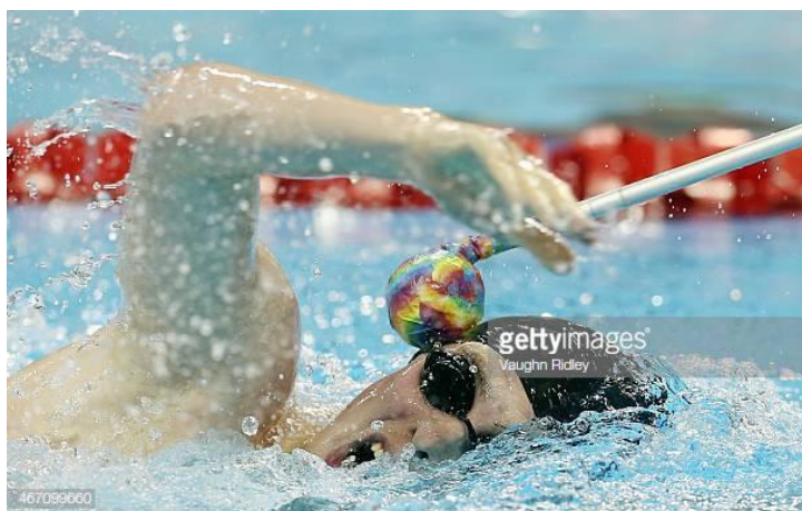
Slika 13. Primjer osobe s oštećenjem vida