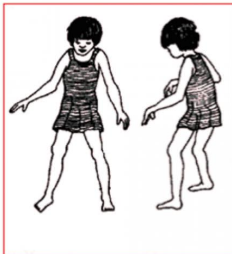
Slika 5. Ataxia

ograničena na jednu stranu tijela, što se naziva hemijataksija. Nekoliko je mogućih uzroka za ove obrasce neurološke disfunkcije. Dystaxia je blagi stupanj ataksije. Friedreichova ataksija ima abnormalnost u hodu kao simptom koji se najčešće prikazuje.