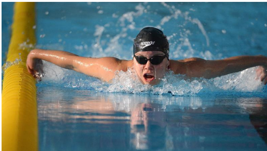
Slika 3. Primjer oštećenja vida