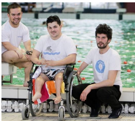
Slika 14. Bivši paraplivači