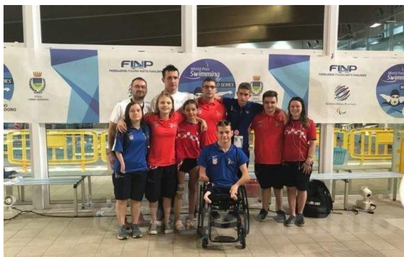
Slika 15. Hrvatska reprezentacija u paraplivanju