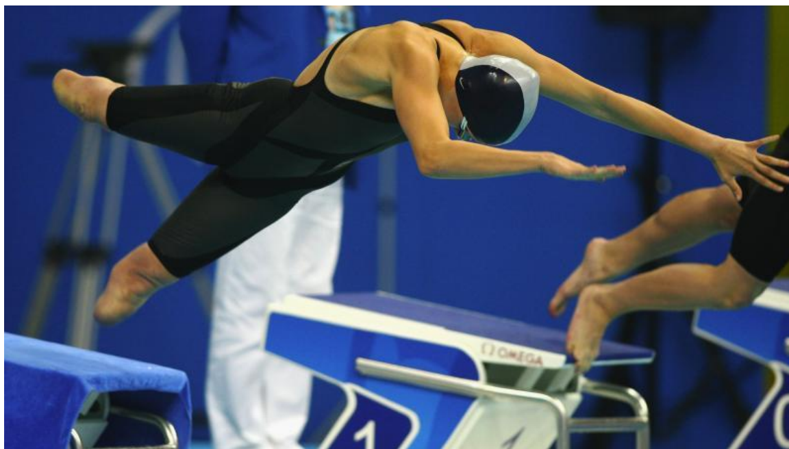
Slika 2. Primjer fizičkog oštećenja