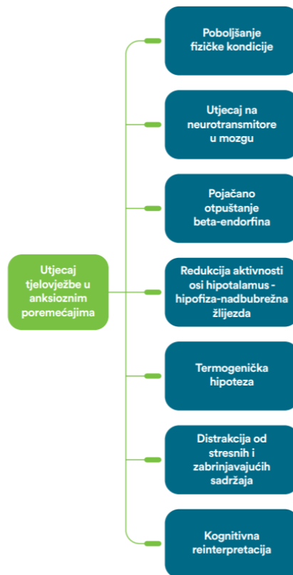
Slika 1. Utjecaj tjele vježbe na anksiozne poremećaje

Izvor: Grošić, V., & Filipčić, I. (2019). Tjelesna aktivnost u poboljšanju psihičkog zdravlja. Medicus , 28(2 Tjelesna aktivnost), str. 199.