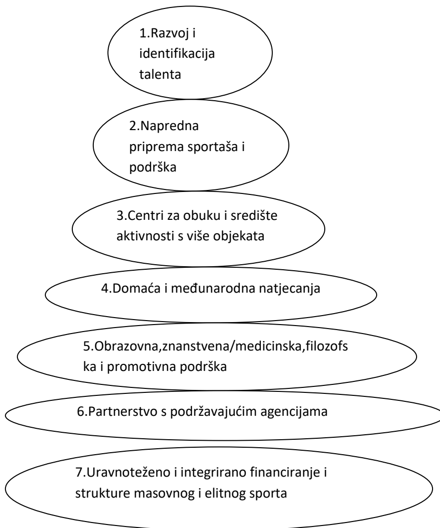
Slika 2. Model integracije vrhunskog sporta i sporta za sve (Camey i sur., 2012)

Autori Smolianov i Zakus (2008) model integracije vrhunskog sporta i sporta za sve, prvi put su objavili u recenziranim međunarodnim novinama sportskog menadžmenta. Prihvaćen je kao model za daljnje razumijevanje različitih sportskih sustava. Kod ovog