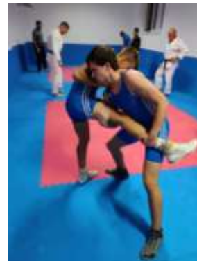
Slobodni stil 6.

Borbe za hvat - one se rade u 3. i 4. zoni opterećenja i njihov cilj je prvenstveno anaerobna izdržljivost i simulacija jednog segmenta borbe. Ako imamo više rundi borbi za hvat sa adekvatnom pauzom do značaja će nam i doći aerobna izdržljivost. Borbe za hvat po trajanju se rade po dvije minute sa pola minute pauze. U slobodnom stilu borbe za hvat ujedno mogu biti i ulasci jer se hvat može ostvariti oko nogu što znači da dominantni hvatovi za ruke odnosno zglobov šake nisu toliko prisutni u slobodnom stilu, a u grčko-rimskom su najdominantniji dio borbe .