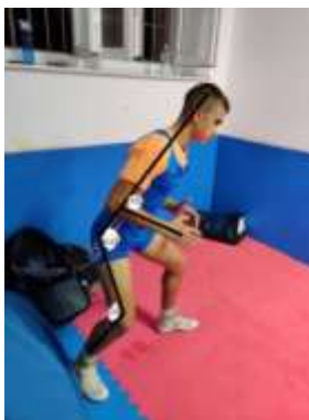
gard slobodni stil 2.