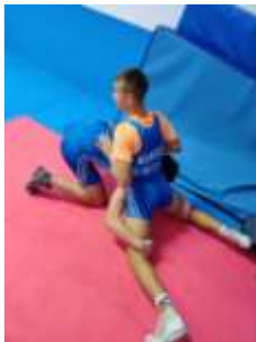
Slika 42 Priprema

Ona je specifičnija za slobodni stil i manifestira se u borbi kad jedan hrvač radi ulazak u noge odnosno zahvat za noge, a drugi hrvač reagira tako da svoje noge izbaciva iza sebe, a kukove zabija u pod i na taj način poklapa hrvača koji napada i svojim centrom težišta ga poklapa i usporava ga. Ujedno na taj način pomiće svoj centar mase prema dolje i nazad i onemogućava daljnje napredovanje napada.