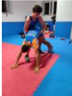
Priprema za podizanje 25.