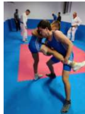
Slobodni stil 6.

Borbe za hvat - one se rade u 3. i 4. zoni opterećenja i njihov cilj je prvenstveno anaerobna izdržljivost i simulacija jednog segmenta borbe. Ako imamo više rundi borbi za hvat sa adekvatnom pauzom do značaja će nam i doći aerobna izdržljivost. Borbe za hvat po trajanju se rade po dvije minute sa pola minute pauze. U slobodnom stilu borbe za hvat ujedno mogu biti i ulasci jer se hvat može ostvariti oko nogu što znači da dominantni hvatovi za ruke odnosno zglob šake nisu toliko prisutni u slobodnom stilu, a u grčko-rimskom su najdominantniji dio borbe .