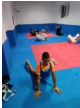
ulazak u noge 13.