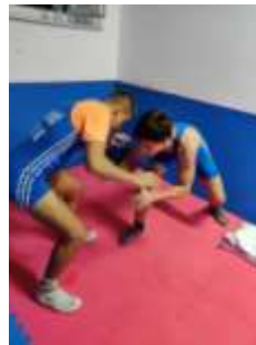
slika 44. Obrana