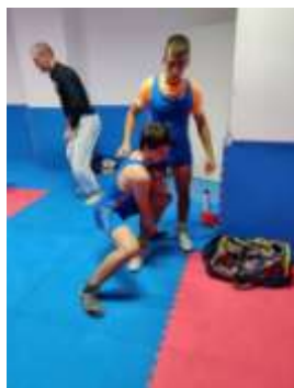
Slika 39. Hvat oko noge slika 40. Podizanje

Vježba podizanje noge -ovo je vježba koja prvenstveno služi u ravnoteži ,ali na nju utjeće fleksibilnost u velikoj mjeri i zbog smanjene fleksibilnosti u ovoj vježbi biti će narušena ravnoteža. Vježba se radi u paru i cilj vježbe je podignuti protivnikovu nogu i hvatom oko gležnja kontrolirati ga, da bi vježbi dodali karakter fleksibilnosti nogu podižemo što višoj i time istežemo zadnju ložu hrvača . ova vježba radi se kad se rade tehnike slobodnog stila i radi se bez velikog inteziteta sa trajanjem od 30sekundi nakon koje slijedi promjena uloga , radi se 5-6serija .