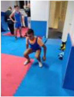
Stoj ispucavanje 34.