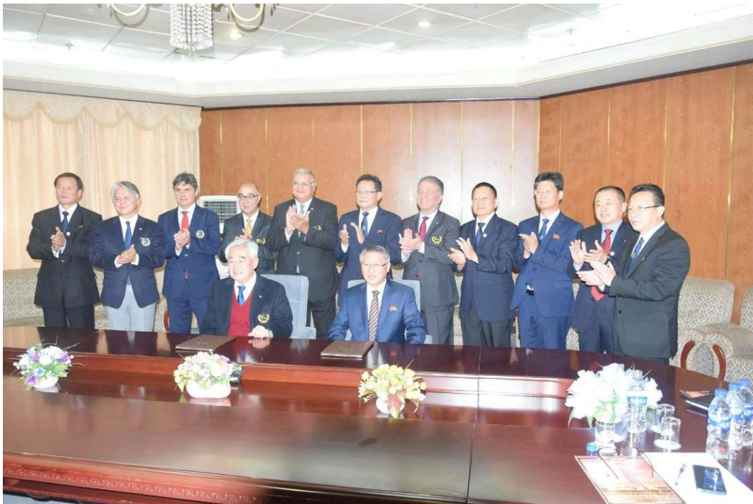
Slika 5. Potpisivanje sporazuma WT - ITF, Pyongyang, DPR Korea (2. studenog 2018.)