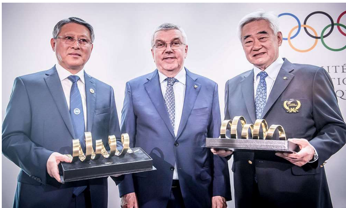
Slika 6. Obilježavanje 25. godina uvrštavanja Taekwondo u Olimpijski program, Lousanne, Švicarska (11. travnja 2019.)

2019. godinu obilježava proslava 25. godišnjice uključivanja Taekwondo u Olimpijski program. U sklopu obilježavanja obljetnice održane su zajedničke demonstracije tijekom travnja u Olimpijskom muzeju u Lausannei (11. travnja) na simboličan datum uz prisustvo Predsjednika MOKa, prostorima UNa kao simbolu jedinstva, suradnje i mira u Ženevi (12. travnja) i Beču (5. travnja). Ideju za ovakav zajednički nastup dao je WT predsjednik Chungwon Choue a podržao ju je ITF predsjednik Ri Yong Son. Moto ovih nastupa je “Jedan svijet, jedan Taekwondo”.