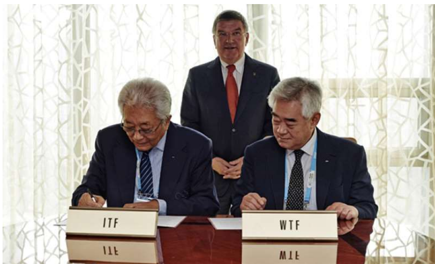
Slika 1. Potpisivanje Protocol of Accord, Nanjing, Kina (21. kolovoz 2014.)

Bacha potpisao je sporazum kojim se formalno definira sve dogovoreno na sastanku u Hamburgu. Sporazum je otvorio put konkretnim aktivnostima a često je bio iterpretiran i kao početak ujedinjavanja dviju federacija. No ipka, Predsjednik WTFa dao je odmah jasnu informaciju kako potpisano sporazum ni u kojem segment ne podrazumijeva ujedinjavanje ITFa i WTFa u bilo kojem obliku. Naglasio je kako postoji niz problema koje treba riješiti između ITFa i WTFa prije nego osnove navedenog sporazuma budu u potpunosti implementirane. No ipak sporazum u svojem obliku, sa svojim ciljem i politički izvrsnom tajmingu predstavlja izrazito važan korak naprijed u ispunjavanju vizije Taekwondo pokreta.