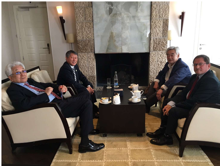
Slika 3. službeni razgovori na relaciji WTF – ITF, Lausanne, Švicarska (3. svibnja 2017.)

3. svibnja 2017. Godine službeni razgovori na relaciji WTF – ITF nastavljaju se u Lausannei u Švicarskoj.