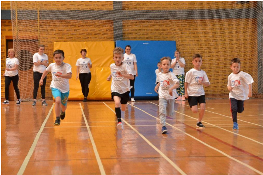
Slika 1. Jedna od disciplina s vrtičke Olimpijade

programi koji omogućavaju funkcionalno-motorički razvoj djece, kognitivni i govorni razvoj, emocionalno sazrijevanje te naviku tjelesnog vježbanja kao preduvjet zdravog odrastanja. Igra je primarna potreba djeteta kroz koju dijete oslobađa višak energije te postiže unutarnju mirnoću. Osim toga, igrom dolazi do razvijanja mišića i usavršavanja motorike, intelektualnih sposobnosti te društvenog ponašanja. Djeca se u igri ne osjećaju sputano nego slobodno, te su maksimalno tjelesno i emocionalno angažirani. Djeca se međusobno igraju, natječu i surađuju (Andrilović i Čudina-Obradović, 1994). Igra za djecu predškolske dobi predstavlja osnovni oblik učenja. U predškolskoj dobi igre osiguravaju raznovrsnu lepezu dobrobiti i beneficija, jer se njihovim primjerenim sadržajima osiguravaju uvjeti za normalan zdravstveni status i razvoj kondicijskih sposobnosti, razvijanje lokomotornog sustava, stjecanje znanja, vještina i navika, utjecaj na psihološku dobrobit, samopouzdanje, zadovoljstvo uz neizostavni odgojni moment.