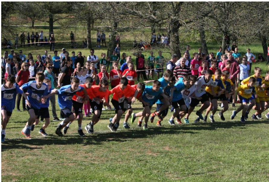
Slika 3. Kros natjecanje za djecu osnovnih škola

Stvaranje navike tjelesnog vježbanja jedna je od primarnih odgojnih zadaća u današnje vrijeme. Pozitivan odnos prema tjelesnom vježbanju važan je za kontinuirani nastavak baljenja tjelesnom aktivnosti. Djeca i mladež u slobodno vrijeme mogu vježbati samostalno, ili u dopunskim aktivnostima učenika u slobodno vrijeme po uputama nastavnika.