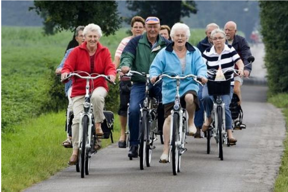
Slika 7. Vožnja biciklom u grupi starije populacije