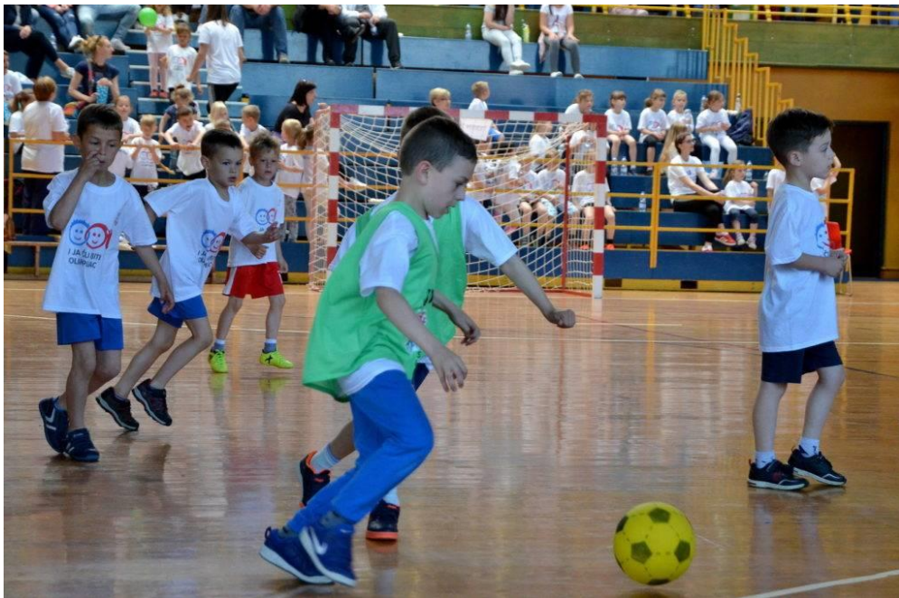
Slika 2. Djeca posebno vole ekipne sportove

Razvoj funkcionalnih sposobnosti djece u predškolskoj dobi ima određene specifičnosti. Naime, djeca predškolske dobi dišu u frekvenciji od 20/min za razliku od novorođenčeta koji diše brzinom od 70/min. S obzirom da djeca imaju uže dišne putove od odraslih i dišu abdominalno, potrebno je paziti na pravilno disanje (Neljak, 2009). Djeca u ovoj dobi kompenziraju ovaj nedostatak povećanim brojem udisaja od 22-24 u minuti u usporedbi s odraslima koji to čine 16-18 puta/min (Findak i Delija, 2001). Omjer veličine srca i tjelesne mase omogućuje niži sistolički i dijastolički tlak u usporedbi s odraslima, što znači da otkucaji srca brže dostižu maksimalne vrijednosti pri vježbanju. Dakle, djeca su sposobna podnositi intervalna opterećenja niskog intenziteta, ali se brže umaraju od odraslih. S obzirom na njihovu dob, ne poznaju svoje granice te ih je potrebno zaustavljati i usporavati.