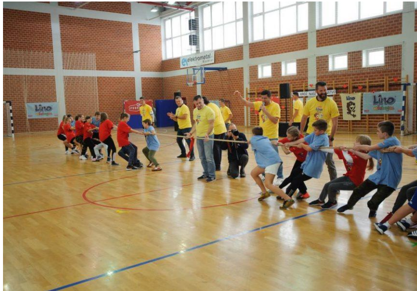
Slika 4. Zabavne sportske aktivnosti djece u osnovnoj školi

U odgojno – obrazovnom sustavu, tjelesna i zdravstvena kultura je jedinstven predmet koji promiče važnost tjelesnog vježbanja kod djece. Međutim, samo dva školska sata tjedno u trajanju od 45 minuta nisu dostatna za zadovoljenje potreba učenika za tjelesnom aktivnošću. Sportska infrastruktura u ustanovama osnovnoškolskog odgoja vrlo je loša i oskudna. Mali broj sati tjelesne i zdravstvene kulture djelomično se može nadomjestiti izvannastavnim i izvanškolskim aktivnostima učenika nižih razreda osnovne škole (Caput Jogunica i Barić, 2015).