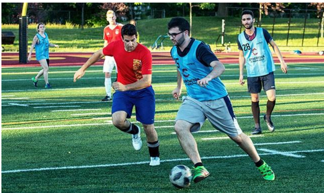
Slika 5. Nogomet je jedna od češćih momčadskih sportova u rekreaciji