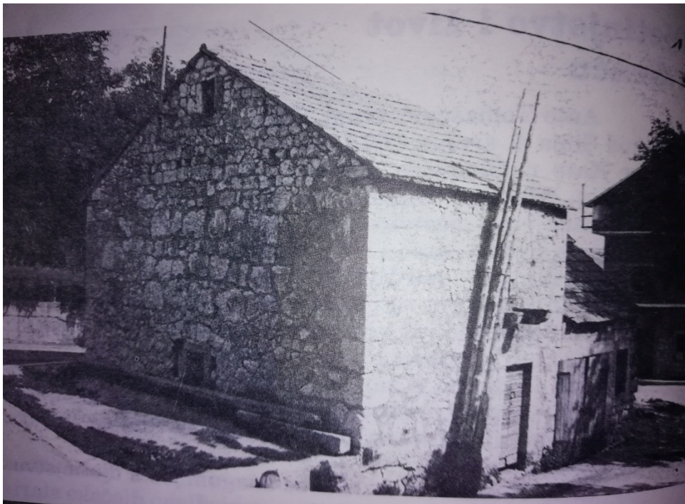
Slika 1. Rodna kuća Ante Tomaševića u Brnazama kod Sinja

Ante Tomašević zvani Kuka rođen je u Brnazama kod Sinja (Slika 1.) 4.7.1872. godine. Otac mu je bio Stjepan Tomašević, a majka Kate Tomašević (rođena Šušnjara). Bio je član velike obitelji od dvanaestoro djece i to sedam braće i pet sestara. Bili su srednje bogata seljačka obitelj sve dok nisu zbog zajma bankrotirali te je Stjepan Tomašević trebao prodati svoju djedovinu. Ante Tomašević se isticao snagom već u samom djetinjstvu pobjeđujući u međusobnim dvobojima i dječake nekoliko godina starije od sebe. Čak je kao šestogodišnje dijete znao pobjeđivati djecu od dvanaest godina. Sa šest godina otac ga šalje u fratarsku klasičnu gimnaziju u Sinju, ali je Ante uvijek sanjao o junačkim pothvatima te se odmah vidjelo da je više za junački i sportski poziv nego za fratarski. Već kao mladić je izvrsno jahao te su mu se na tome divili i stariji ljudi. Kao mladić je trčao i alku (Slika 2.). Nakon prodaje najbolje zemlje uz rijeku Cetinu Ante napušta svoj rodni kraj te odlazi u Graz, živjeti i služiti u carskoj konjici. Jako se brzo snašao te je vrlo brzo naučio govoriti nekoliko stranih jezika. Zbog svoje atletske građe i izvrsnog jahanja često je bio primjećivan, te su mu često zavidjeli i najviši oficiri, pa je zbog ljubomore drugih znao upadati u sukobe.