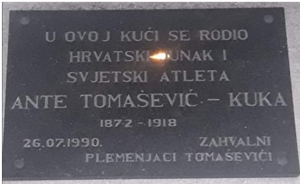
Slika 7. Spomen ploča na rodnoj kući Ante Tomaševića-Kuke

Kroz povijest hrvatskog naroda, hrvatski narod je često bio tlačen od drugih naroda, ali su se uvijek nalazili neki pojedinci koji bi se borili protiv toga da hrvatski narod bude potlačen i da hrvatski narod živi ponosno. Ante Tomašević-Kuka je kroz sportske uspjehe pronosio ime Hrvatske, Dalmacije i Cetinskog kraja boreći protiv toga da ti dijelovi padnu pod utjecaj Mađara. Kroz čast i junaštvo koji su uvijek bili na prvom mjestu kod Tomaševića, on ulazi u srca cijelom puku Austro-Ugarske monarhije. Borio se protiv najsnažnijih ljudi na svijetu i dokazao da je on jedan od njih. Primjer pravog sportaša i osobe koja cijeni ono što je njegovo. Bilo bi nepravedno da takva povijesno važna ličnost za Hrvatsku, a posebno za cetinjsku krajinu ode u zaborav i da nove generacije ne čuju priče o podvizima Hrvatskog junaka i svjetskog atleta Ante Tomaševića. Stvarna životna priča o djetetu iz malog sela kraj Sinja koje odlazi u veliki svijet i tamo se uspijeva izboriti za sebe te pomoću svoje upornosti i volje postaje jedan od najcjenjenijih ličnosti u narodu i to natječući se u jednom od najtežih sportova, hrvanju. To je svakako vrijedno divljenja i poštivanja na što i dan danas podsjeća spomen ploča (Slika 7.) postavljena na Tomaševićevu rodnu kuću u čast ovog velikog sportaša i svjetskog atleta.