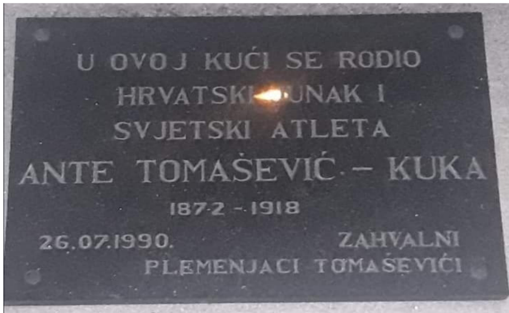
Slika 7. Spomen ploča na rodnoj kući Ante Tomaševića-Kuke

Kroz povijest hrvatskog naroda, hrvatski narod je često bio tlačen od drugih naroda, ali su se uvijek nalazili neki pojedinci koji bi se borili protiv toga da hrvatski narod bude potlačen i da hrvatski narod živi ponosno. Ante Tomašević-Kuka je kroz sportske uspjehe pronosio ime Hrvatske, Dalmacije i Cetinskog kraja boreći protiv toga da ti dijelovi padnu pod utjecaj Mađara. Kroz čast i junaštvo koji su uvijek bili na prvom mjestu kod Tomaševića, on ulazi u srca cijelom puku Austro-Ugarske monarhije. Borio se protiv najsnažnijih ljudi na svijetu i dokazao da je on jedan od njih. Primjer pravog sportaša i osobe koja cijeni ono što je njegovo. Bilo bi nepravedno da takva povijesno važna ličnost za Hrvatsku, a posebno za cetinjsku krajinu ode u zaborav i da nove generacije ne čuju priče o podvizima Hrvatskog junaka i svjetskog atleta Ante Tomaševića. Stvarna životna priča o djetetu iz malog sela kraj Sinja koje odlazi u veliki svijet i tamo se uspijeva izboriti za sebe te pomoću svoje upornosti i volje postaje jedan od najcjenjenijih ličnosti u narodu i to natječući se u jednom od najtežih sportova, hrvanju. To je svakako vrijedno divljenja i poštivanja na što i dan danas podsjeća spomen ploča (Slika 7.) postavljena na Tomaševićevu rodnu kuću u čast ovog velikog sportaša i svjetskog atleta.