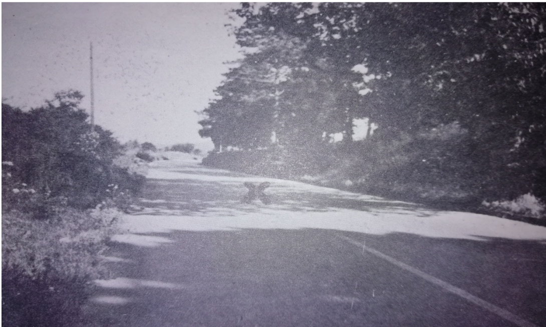
Slika 6. Mjesto pogibije Ante Tomaševića – označeno križićem

napadače po hotelu dok nije počela pucnjava. Tko je točno počeo s pucnjavom nije poznato. Bilo je više ozlijeđenih i u tučnjavi i u pucnjavi, a jedan od metaka je pogodio i Tomaševića. Kada je pokušao pobjeći iz hotela ponovno se osula paljba iz prve zasjeda koja je bila skrivena u kući preko puta hotela Danica. Tomašević je krenuo trčati prema Miljevcima gdje bi imao potporu svojih gardista, ali je i na tom putu bila zasjeda te biva ponovno ranjen. Kada je vidio da do Miljevacu ne može doći, Tomašević se okreće te bježi prema selu Kričke gdje je također ima svoje ljude. Ali i na ovom putu je Tomaševića čekala zasjeda i to preko puta pravoslavnog groblja. Već podosta malaksao od umora i rana, usporava tempo trčanja. Snažni Tomašević je ovoga puta bio velika i nepogrešiva meta pa Vjekoslav Štrkalj i Niko Dereta nisu mogli promašiti. Nažalost na tom mjestu je izdahnuo (Slika 6.)