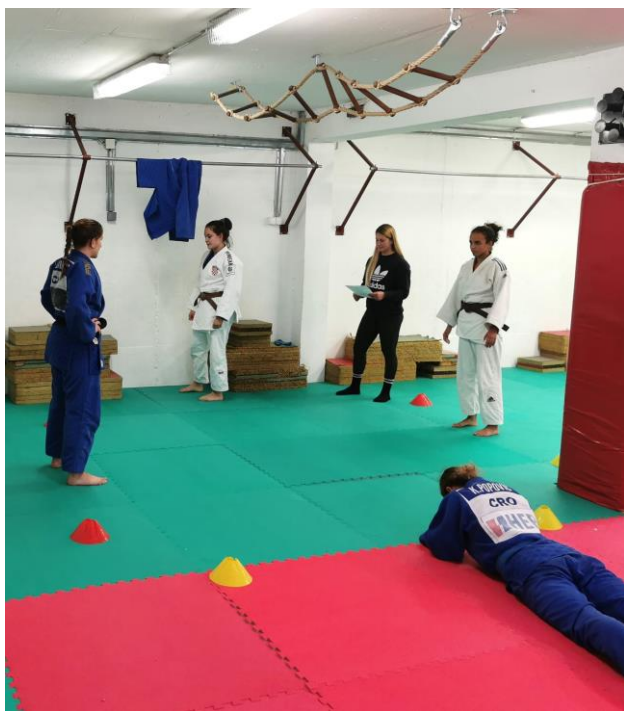
Slika 3. Judašice iz Judo kluba "Pujanke" u pripremi za izvedbu JPFT

Testni prostor sastoji se od središnje točke, oko koje su postavljena četiri markera na udaljenosti od 1,5 metara. Dva uke-a smještena su jedan nasuprot drugom, na udaljenosti od 3 metra, dok treći uke leži na prsima nasuprot judogiju, koji je ovješten na visokoj letvi (također na udaljenosti od 3 metra). Test se sastoji od tri radna intervala u trajanju od 30 sekundi, s pauzama od 10 sekundi između njih. Svaki radni interval podijeljen je na dva segmenta: 10 sekundi izometrijskog rada tijekom kojeg judaš ispruženim rukama hvata judogi, zatim 20 sekundi izvodi isprekidane tehnike. Tehnike uključuju bacanje ippon-seoi-nage i tehniku partera yoko-sankaku-jime. Tijekom intervala pauze, tori stoji ispod viseće šipke s judogijem i priprema se za sljedeći radni interval. Ukupna uspješnost u testu određuje se zbrojem svih ponavljanja (N) izvedenih tijekom tri serije. Osim toga, srčana frekvencija mjeri se odmah po završetku testa (P1) i jednu minutu nakon testa (P2). Uspješnost u testu određuje se prema sljedećoj formuli: \text{Indeks} = N * (P1 - P2) / P1 .