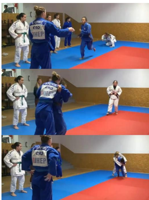
Slika 1. Manje uspješne judašice iz Judo kluba "Pujanke" u izvedbi SJFT

sportašica. Rezultati prethodnih istraživanja ukazuju na značajnu povezanost izvedbe na SJFT testu s aerobnim i anaerobnim kapacitetima (Šimenko & Karpljuk, 2015).