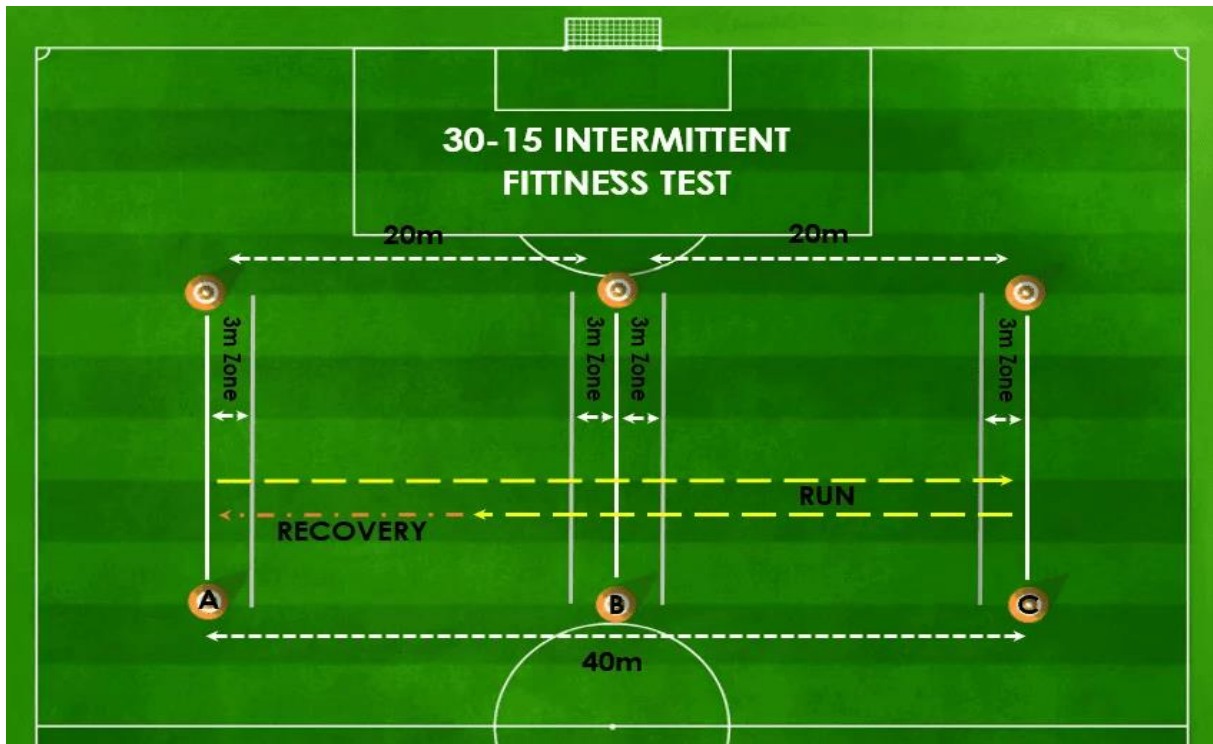
Slika 1. prikaz testa 30-15 IFT za nogomet

obje svoje strane udaljene 3 metra. Kako bi igrači znali kojim je tempom potrebno trčati te kada počinju i završavaju intervali rada, potrebno je pomoću ozvučenja puštati snimku testa na kojoj se za svaku zonu čuje zvučni signal. Ovisno o brzini određene razine, ti se signali čuju sve brže iz razloga što igrači moraju brže stizati u određene zone. Potrebno je imati testiranje pod kontrolom jer igrači ispadaju u slučaju da 3 puta nisu u zoni tijekom zvuka. U slučaju da igrač nije u mogućnosti završiti započetu razinu, zadnja ispunjena razina će biti ona upisana kao njegov krajnji rezultat.