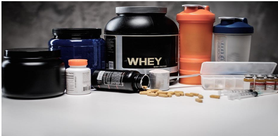
Slika 2. Oblici suplemenata

U nastavku se prikazuje Slika 2. koja daje uvid u oblike suplemenata.