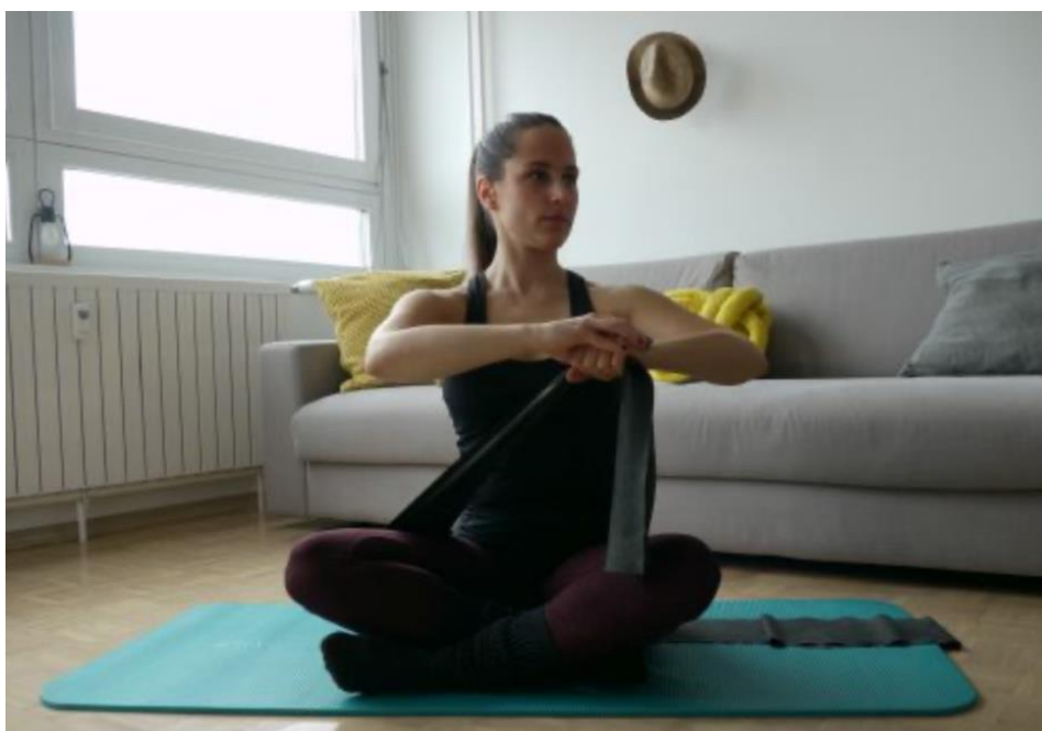
Slika 3. Izvođenje vježbe za mobilnost ramena s elastičnom trakom

Ove vježbe ne moraju se izvoditi samo u turskom sjedu već postoje različite varijante postavljanja tijela a ovo je jedna od njih.