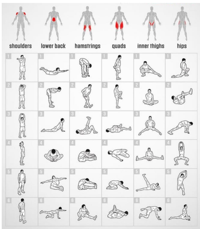
Slika 2. Vježbe za istezanje cijelog tijela

Fleksibilnost i mobilnost također igraju veliku ulogu u odbojci iz razloga prevencije ozljeda i poboljšanja tehnike izvođenja pokreta. Statičkim istezanjem može se poboljšati fleksibilnost mišića a time i mobilnost zglobova, jer teško da će zglobovi biti dovoljno mobilni ako su mišići skraćeni i kruti. Dinamičkim istezanjem prije treninga pripremiti će se mišići i zglobove za rad. Statičko istezanje izvodi se lagano, bez trzanja i naglih pokreta. Bolje ga je izvoditi poslije treninga kada su mišići zagrijani iako se ponekad izvodi i prije treninga no u tom slučaju to istezanje mora biti lagano i onoliko koliko mišići dopuštaju jer nisu zagrijani i još su skraćeni i kruti. Ako se već izvodi prije treninga poželjno je da nakon njega se odradi dinamičko istezanje. Dobar pokazatelj istezanja je blagi osjećaj zatezanja ali nikako bol. Kod statičkog istezanja pozicije se zadržavaju kroz vremenski period od 15 do 30 sekundi dok dinamičko istezanje se odvija kroz pokrete i svaki pokret se ponavlja 10 do 12 puta.