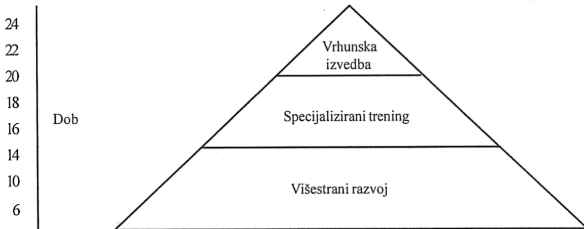
Ilustracija 2. Baza piramide (Bompa, 2005)

U ilustraciji 2. je prikazan optimalan dugoročni razvoj sportaša, točnije odnos između dobi i planiranog treninga. Dakle, baza piramide, koja se može smatrati temeljem svakog programa treninga, naglašava važnost višestranog razvoja. On uključuje širok spektar motoričkih i fizičkih vještina, kao i kognitivnih i emocionalnih aspekata sportskog sudjelovanja. Višestrani razvoj osigurava stvaranje čvrstih temelja na kojima će sportaši graditi svoje specijalizirane vještine (Bompa, 2005).