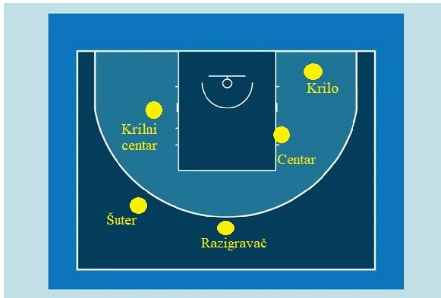
Slika 4. Pozicije igrača u modernoj košarci(vlastita slika)

i linije za tri poena. Krilni centri su fizički robusni i sposobni za čuvanje visokih protivničkih igrača u obrani ispod koša. Neki od poznatih krilnih centara u NBA ligi su Dirk Nowitzki i Kevin Garnett. Centar (eng. center) je najčešće najviši igrač u momčadi. Kreće se najviše pod košem i u reketu i ključan je u obrani, posebno u blokiranju šuteva i hvatanju skokova. Nikola Jokić i Giannis Antetokoumpo su među najpoznatijim centrima u NBA ligi.