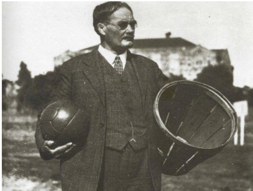
Slika 1. James Naismith – „otac košarke“ sa prvom loptom i košem

u Springfieldu. Iduće godine odigrane su prve košarkaške utakmice između ekipa sa različitih sveučilišta. Prvo svjetsko košarkaško prvenstvo koje je organizirala FIBA održalo se 1950. godine u Argentini, a od tada se natjecanje održava svake četiri godine. U 1989. godini ukinuto je pravilo o amaterizmu, što je omogućilo profesionalnim igračima iz NBA lige da sudjeluju na Svjetskim prvenstvima. Ovi igrači prvi put su sudjelovali 1992. godine na Olimpijadi u Barceloni, Španjolska. Zbog toga je iz naziva FIBA-e uklonjena riječ "amateur", iako se kratica FIBA-e nije promijenila (Mance, 2019).