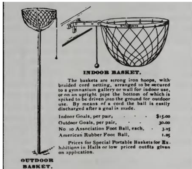
Slika 2. Prikaz prvih koševa Naismith, J. (1996). Basketball: Its origin and development . U of Nebraska Press.