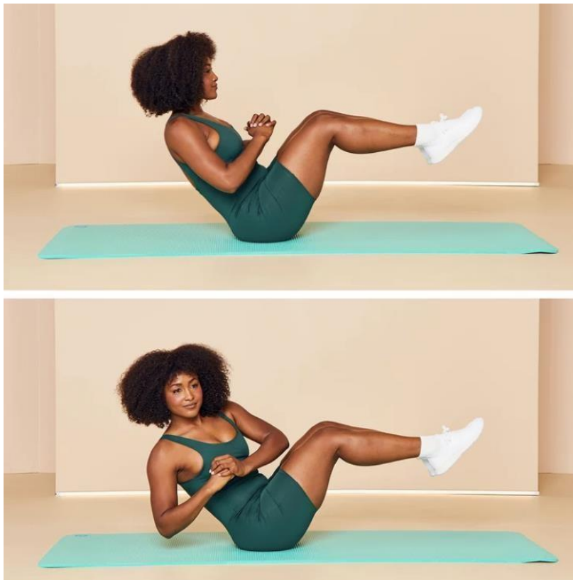
Slika 3. Prikaz russian twista

Cilj: Jačanje bočnih trbušnih mišića i poboljšanje rotacione stabilnosti.