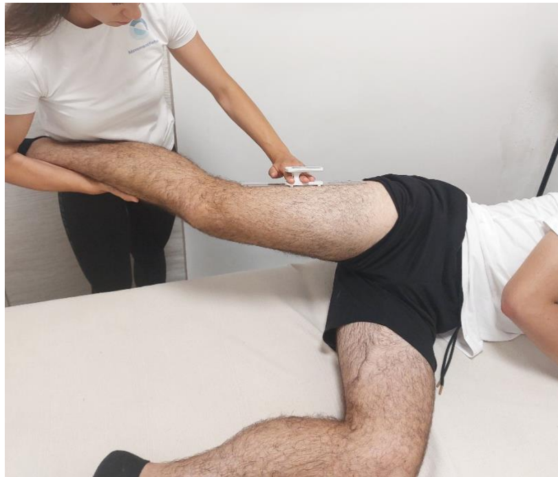
Slika 1. Prikaz mjerenja opsega pokreta kroz Ober test EasyAngle goniometrom

Istraživanje se provodilo u MovementRehab centru za kineziterapiju, a korištena oprema bio je stol za masažu, spužvasti valjak i goniometar. Na ispitanicima je izveden Ober test koji je korišten da bi se utvrdila napetost iliotibialnog trakta prije i nakon tretmana klasičnom masažom, a raspon pokreta postignut kroz test izračunat je korištenjem goniometra. Radi se o digitalnom goniometru naziva EasyAngle, a proizvod je švedske tvrtke Meloq. Omogućuje mjerenje opsega pokreta u bilo kojem zglobu, a mjerenja su precizna do 1^\circ . Jednostavan je i pouzdan za korištenje jer se rezultati dobivaju kroz dva pritiska na tipku i zahtjeva korištenje samo jedne ruke za mjerenje pri čemu se druga može koristiti za stabilizaciju i pridržavanje ovisno o potrebi pri izvođenju mjerenja (Radić, Paušić i Rak, 2024).