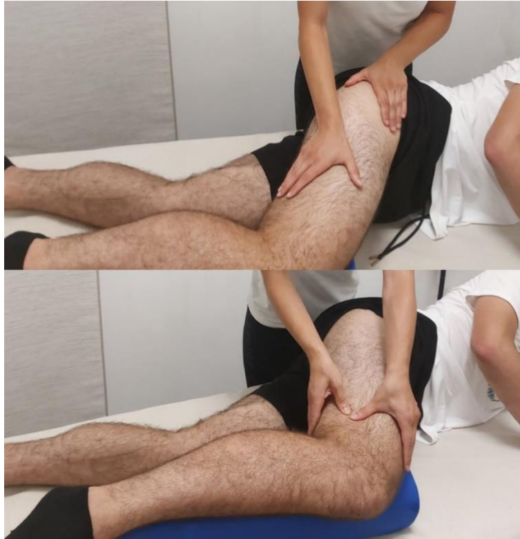
Slika 2. Prikaz obrade ITB sveze pokretima korijenom dlana i palcima