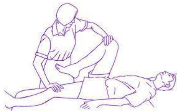
Slika 11. PNF Istezanje