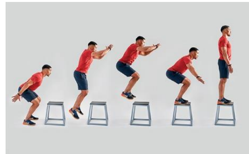
Slika 6. Pliometrija