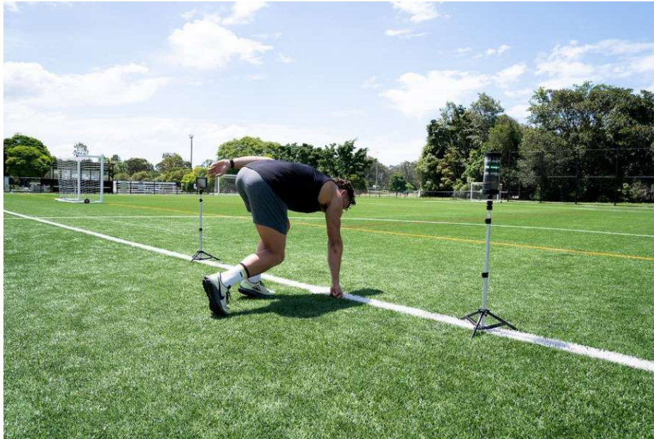
Slika 7. Početak testa sprinta na 30m