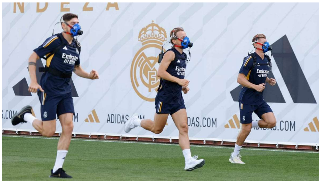
Slika 3. Fitness test igrača Real Madrida

Trčanje na 40 jardi koristi se za mjerenje brzine trčanja. Istraživanja su pokazala da je ovaj test valjan i pouzdan, s pozitivnim rezultatima za protokole od jednog i dva ispitivanja, što sugerira da pojedinačno testiranje također može biti korisno (Paule i sur., 2000). Koeficijent varijacije za ovaj terenski test zabilježen je na 2%, a koeficijent međurazredne korelacije iznosi 0,994 (Mayhew, Piper, Schwegler i Ball, 1989).