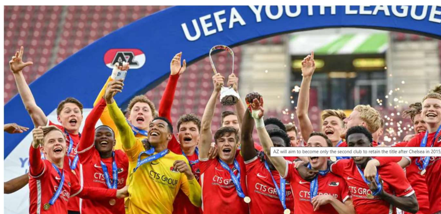
Slika 2. Osvajaci UEFA Youth lige prvaka mladih 2022/23