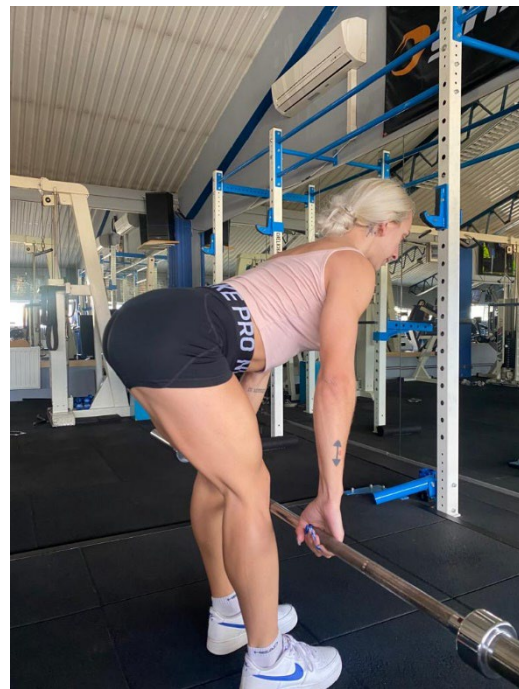
Slika 14. Donja pozicija mrtvog dizanja

Najčešće greške: kukovi idu premalo prema iza, leđa su savijena i podiže se teret iz donjeg dijela leđa