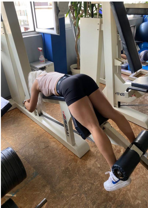
Slika 9. Početni položaj

Izvedba: Tijelom ležimo na klupi s licem prema dolje, hvatamo se za ručke što je vidljivo na slici (Slika 9). Jastučići su postavljeni na gležnjevima dok su koljena na klupi. Vršimo udah i savijamo obje noge istodobno nastojeći povući jastučice do glutealnih mišića te izdahujemo na kraju kretnje (Slika 10). Kontrolirano i polako se vraćamo u početni položaj gdje su noge ispružene.