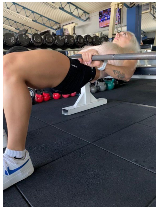
Slika 12. Gornja pozicija hipthrusta

Najčešće pogreške: Ako su stopala previše blizu tijela opteretit će se mišići prednje strane natkoljenice, a ovom vježbom želimo aktivirati najviše mišiće gluteusa pa ćemo postaviti stopala malo dalje od tijela.