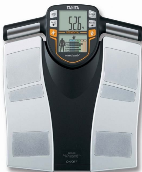
Slika 19. Tanita vaga

Odmah prvi dan ujutro na tašte provest će se inicijalno mjerenje morfoloških parametara koje ćemo pratiti i mjeriti svaka dva tjedna te će mjeriti uvijek ista osoba i to tri puta istom tehnikom. Mjerit ćemo uz pomoć Tanita vage (Slika 19.) koja pomoću dvofrekventne bioelektrične impedancije precizno daje analizu sastava tijela. Parametre koje ćemo pratiti su tjelesna težina, postotak potkožnog masnog tkiva i čista mišićna masa te će biti unešeni u tanitinu tablicu za praćenje napretka (Slika 20.). Uz ove parametre vaga još prikazuje postotak vode u tijelu, metaboličku dob, koštanu masu, visceralnu masnoću i bazalni metabolizam. Uz sve navedeno još ćemo uz pomoć centimetarske trake mjeriti obujam struka, bokova, noge i ruke. Mjere uzimamo na najširem mjestu ovih dijelova tijela. Plan prehrane bit će složen prema izmjerenom bazalnom metabolizmu, potrošnji na treninzima i aktivnostima tijekom dana. U cjelokupnom trenažnom procesu bitno je pratiti napredak i razvoj kako bi se lakše uočila odstupanja, stagnacija ili regresija te se na vrijeme uvele potrebne promjene. Kako bi se povećala mišićna snaga potrebno je pratiti napredak mišićne hipertrofije i prilagoditi prehranu kako bi količina potkožnog masnog tkiva bila optimalna i da ne narušava zdravlje.