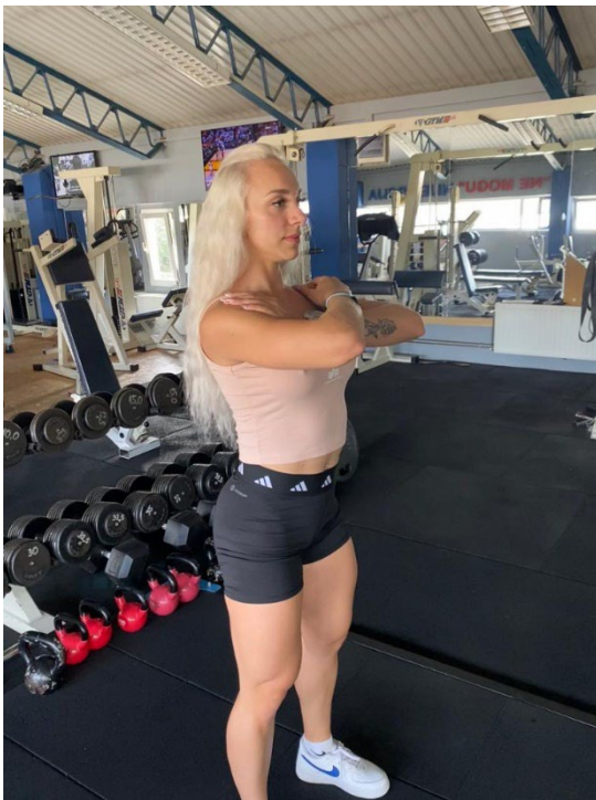
Slika 1. Početna pozicija čučnja

Test se izvodi jednu minutu, a cilj je napraviti što više pravilnih čučnjeva u zadanom vremenu. Sportašica kreće raditi na znak i također se na znak i zaustavlja, a mjerioc broji na glas čučnjeve koji su izvedeni pravilno.