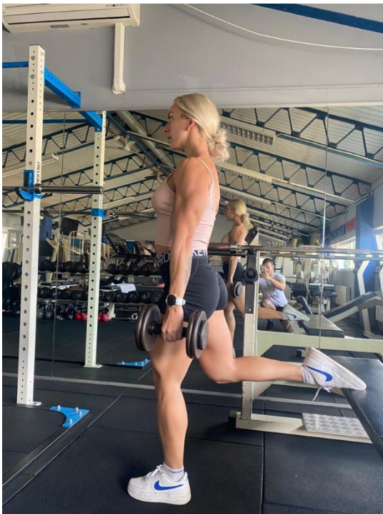
Slika 15. Početna pozicija

Izvedba: Sjednemo na klupicu, ispružimo noge kako bi odredili duljinu gdje moramo stati s jednom nogom dok drugu pozicioniramo na klupicu. Uz udah guramo kukove iza, savijamo koljena i sa tijelom idemo lagano u pretklon. Uz izdah vraćamo noge i kukove u početni položaj, a trup izravnamo. Početna pozicija bugarskog čučnja i donja pozicija prikazane su na sljedećim slikama (Slika 15. i 16.).