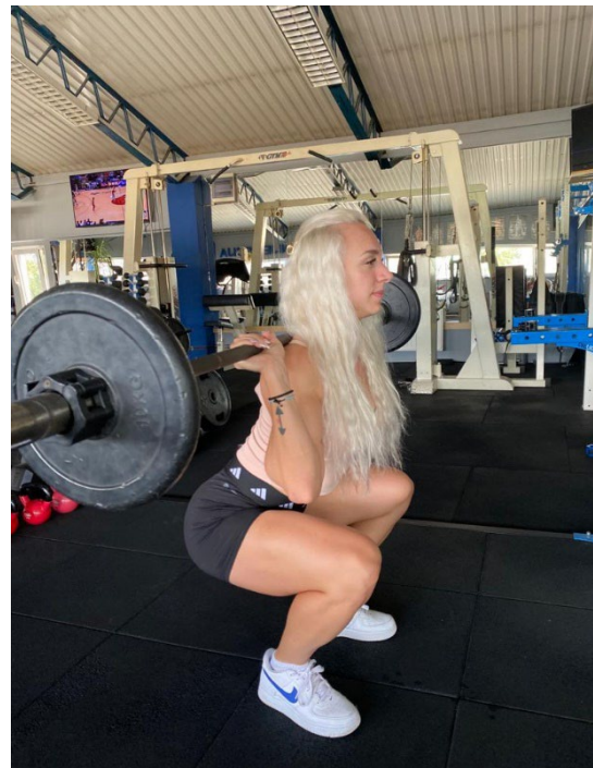
Slika 4. Donja pozicija čučnja

Najčešće pogreške: Često se događa da osoba ne zna dovoljno široko postaviti stopala ili koljena ne prate gdje idu prsti na nogama. Tijekom čučnja dolazi do savijanja leđa što može rezultirati ozljedom slabinskog dijela kralježnice.