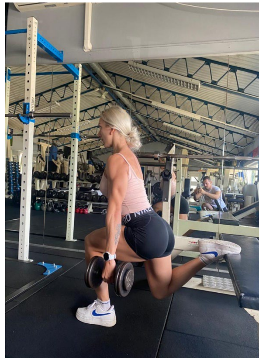
Slika 16. Donja pozicija bugarskog čučnja

Najčešće greške: noge se nalaze pod krivim kutem, koljeno prednje noge prelazi preko prstiju iste, pokret se izvodi prebrzo i nekontrolirano