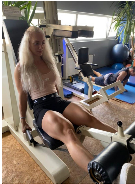
Slika 8. Ekstenzija nogu

Najčešće greške: Krivo postavljene valjke na nogama ili ako leđa nisu na klupi uzrokovat će da nećemo toliko dobro pogoditi mišiće prednje strane natkoljenice ili će opterećenje biti previše na koljenima.