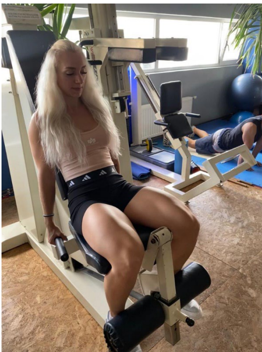
Slika 7. Početni položaj

Izvedba: Sjednemo na spravu i čvrsto se pridržavamo sa ručke dok je trup nepomičan. Leđa moraju cijela biti naslonjena na naslon, valjci moraju doći iznad skočnog zgloba dok nožne prste vučemo prema sebi. Vršimo udah, podižemo potkoljenice u vodoravni položaj i izdahnemo na kraju vježbe. Početni položaj ove vježbe i sama ekstenzija nogu prikazana je na slikama (Slika 7. i 8.). Ova vježba pogodna je za vježbače početnike kako bi se uvježbali za tehnički zahtjevnije vježbe nogu.