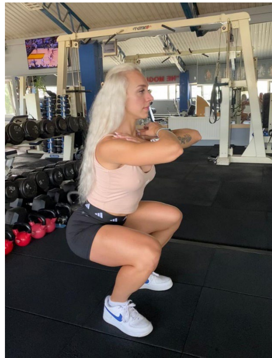
Slika 2. Donja pozicija čučnja