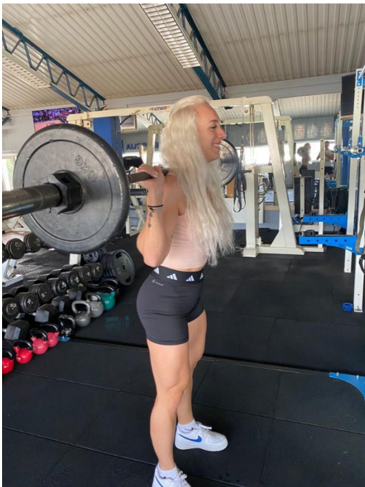
Slika 3. Početni položaj čučnja

Izvedba: Čučanj je jedna od najosnovnijih vježbi koja uključuje cijeli mišićni sustav. Izvodi se na način da dvoručni uteg koji stoji na stalku stavimo na gornji dio leđa točnije na m. trapezius i malo iznad stražnjeg dijela m. deltoideusa. Napravimo dva koraka unatrag i stanemo tako da su stopala postavljena u širini ramena, nožni prsti blago okrenuti prema van. Napravi se udah i kontrahiraju se trbušni mišići i pokret ide polako iz kukova, zatim savijamo koljena i spuštamo se do pozicije gdje su bedra usporedna s podlogom nakon čega ispravljamo noge, vratimo se u početni položaj i vršimo izdah. Pravilno izvođenje ove vježbe vidljivo je na sljedećim slikama (Slika 3. i 4.).