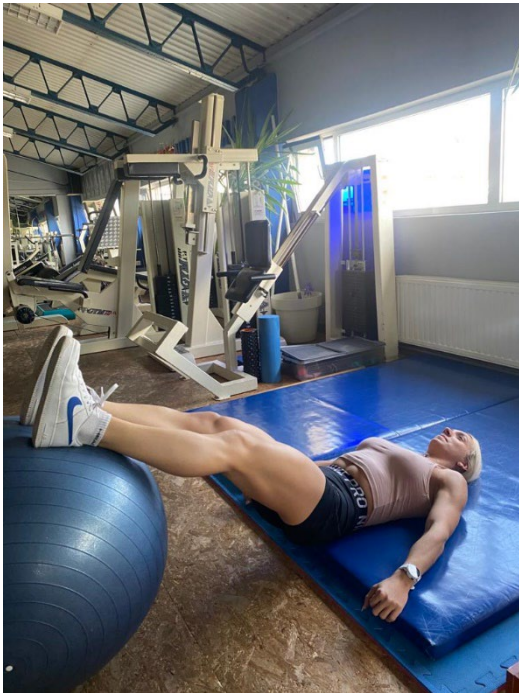
Slika 17. Početna pozicija

Izvedba: Noge su pozicionirane na lopti i ispružene (Slika 17.). Uz udah se upremo u pete i istovremeno podižemo kukove u zrak i privlačimo noge prema sebi. Polako i kontrolirano stišćemo mišiće stražnjice u gornjem položaju i nakon toga ispružamo noge naprijed uz udah (Slika 18.).