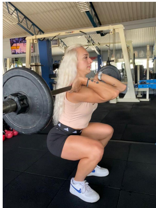
Slika 5. Početna pozicija prednjeg čučnja Slika 6. Donja pozicija prednjeg čučnja