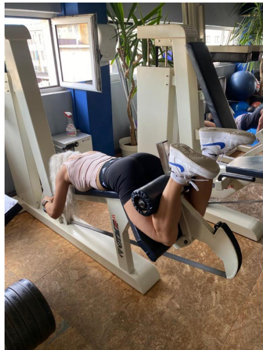
Slika 10. Nožna fleksija

Najčešće pogreške: Krivo postavljanje jastučića sprave, podizanje zdjelice sa klupe, koljena nisu na klupi ili prebrzo izvođenje vježbe.