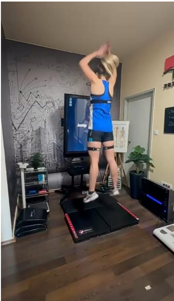
Slika 1. Vertikalni skok

Vertikalni skok je test za procjenu eksplozivne snage donjeg dijela trupa. Mjeri se maksimalna visina skoka izražena u centimetrima. Prilikom ovog testiranja ispitanik se iz uspravnog, opruženog položaja spušta u čučanj te iz čučnja bez zadržavanja skače što više u zrak. Prilikom testiranja izmjerena su tri skoka, a zabilježen je najbolji ostvaren rezultat.