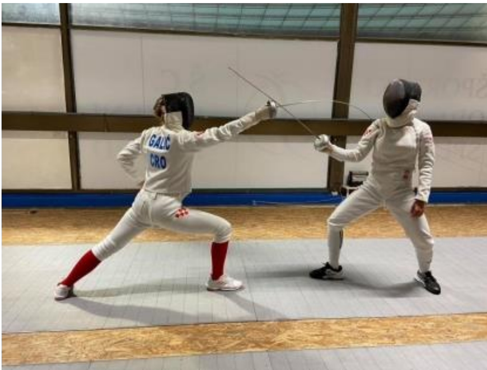
Slika 9. Vježbe u paru (Preuzeto iz Napadački tehnički elementi u mačevanju: završni rad, od P. Jukić, 2020, Sveučilište u Splitu, Kineziološki fakultet. Preuzeto s https://urn.nsk.hr/urn:nbn:hr:221:683453 )

Vježbe u paru odvijaju se na način da se dva borca odjevena u mačevalačku opremu nalaze se jedan nasuprot drugoga. Oni asistiraju jedan drugome. Dok jedan mačevalac radi akciju, drugi asistira. Mogu se raditi jednostavne kretnje i zadatci, kao i složenija gibanja i akcije. Zadatci se mogu raditi u mjestu ili u kretanju. „Vježbe u parovima nalikuju individualnoj školi. Sportaši imaju zadatak da jedan prema drugome izvršavaju zadatke iz repertoara mačevalačkih akcija (jednostavni složeni napadi, parade, kontra parade i sl.“ (Kovačić, 2023)