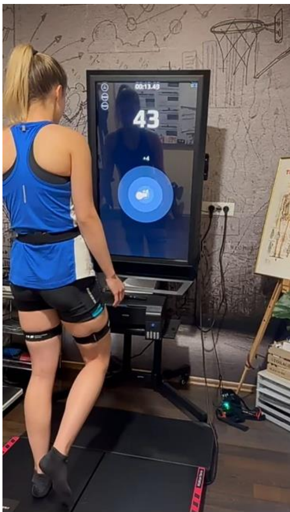
Slika 4. Jednonožno održavanje ravnoteže