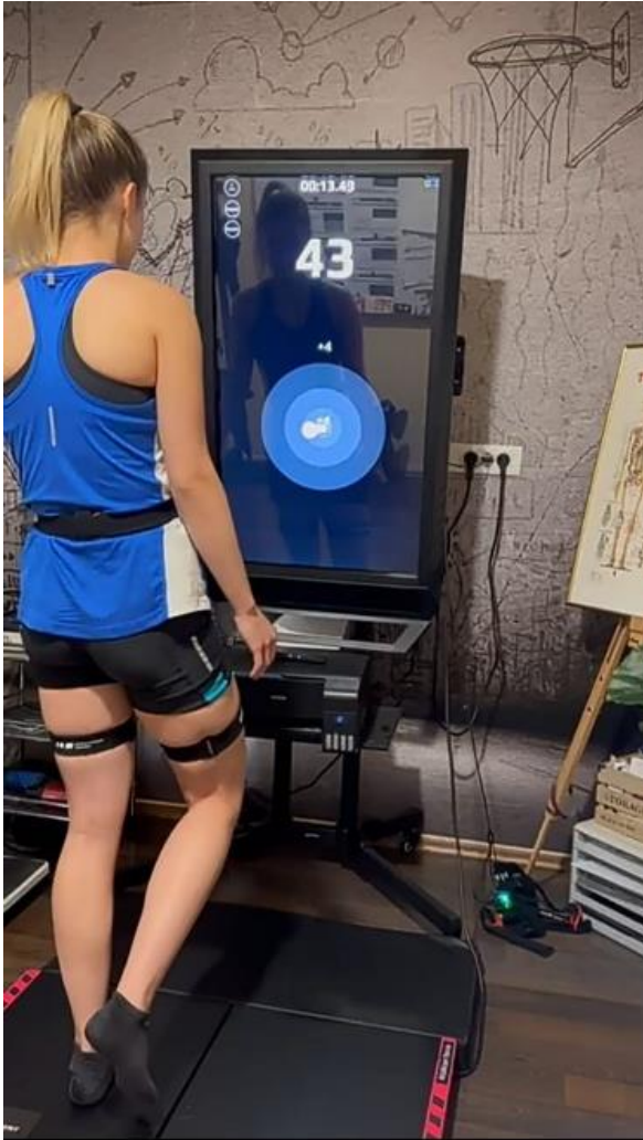
Slika 4. Jednonožno održavanje ravnoteže