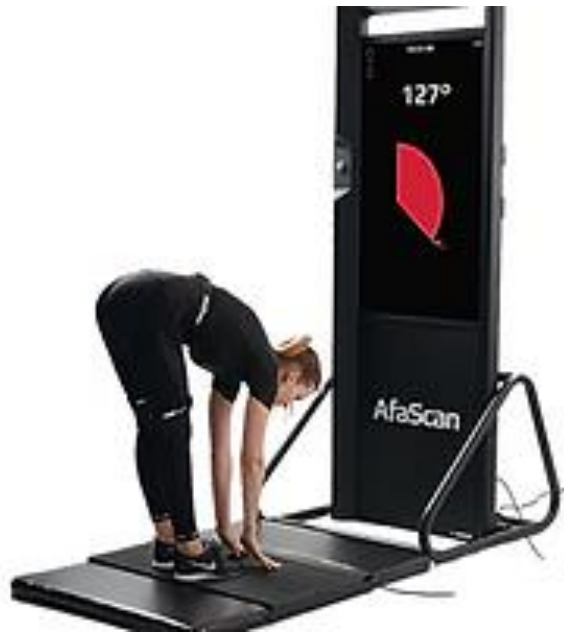
Slika 5. Pretklon sunožno