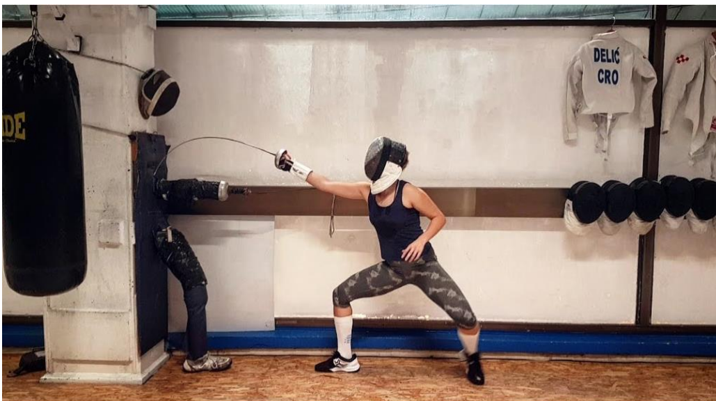
Slika 8. Vježbe na meti

Preciznost je izrazito bitna motorička sposobnost u mačevanju. Meta je alat pomoću kojeg se usavršava navedena motorička sposobnost. Osim preciznosti, radom na meti, usavršavaju se osnovne mačevalačke kretnje. Vježbama na meti korigira se tehnika držanja oružja te se razvija osjećaj za distancu. (Kovačić, 2023)