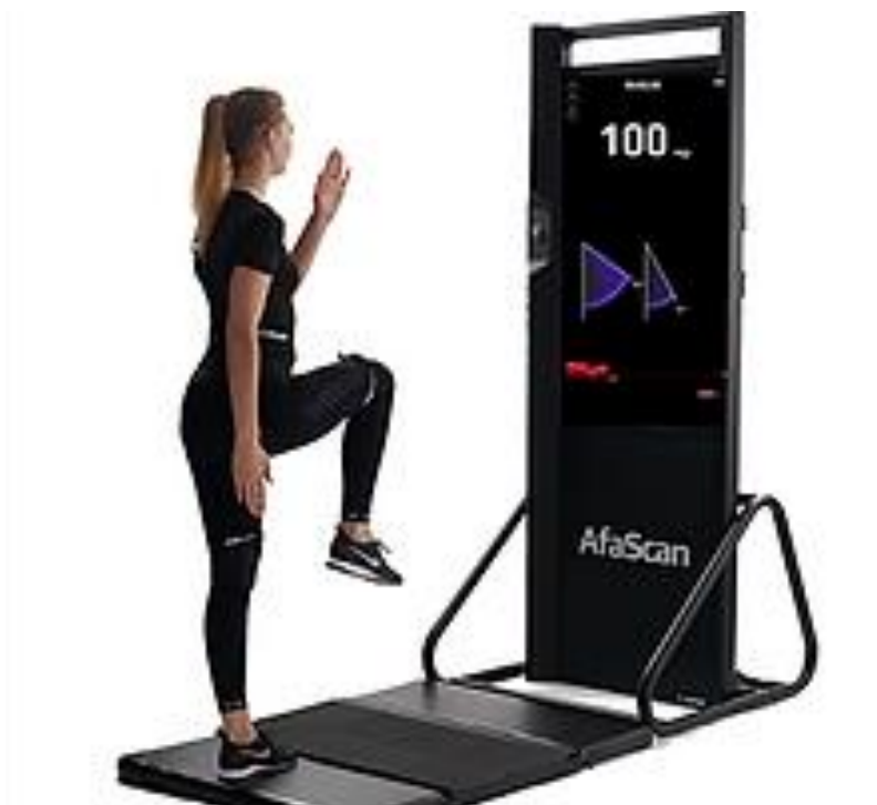
Slika 7. Visoki skip

Test visoki skip ukazuje na snagu donjih ekstremiteta, trupa, mišića zdjelice, kao i na izdržljivost ispitanika. Početni položaj ispitanika je uspravan položaj rukama opruženih uz tijelo. U testu ispitanik treba podizati noge barem do 65 stupnjeva. Nakon što podigne nogu treba ju u što kraćem vremenu spustiti na tlo. Brojanje pravilnih izvođenja se regulira nosivim sensorima koji mjere navedene stupnjeve prilikom podizanja nogu. Cilj testa je što brže izvoditi navedeni pokret. Test se izvodi 30 sekundi i ima za cilj odrađen što veći broj ponavljanja.