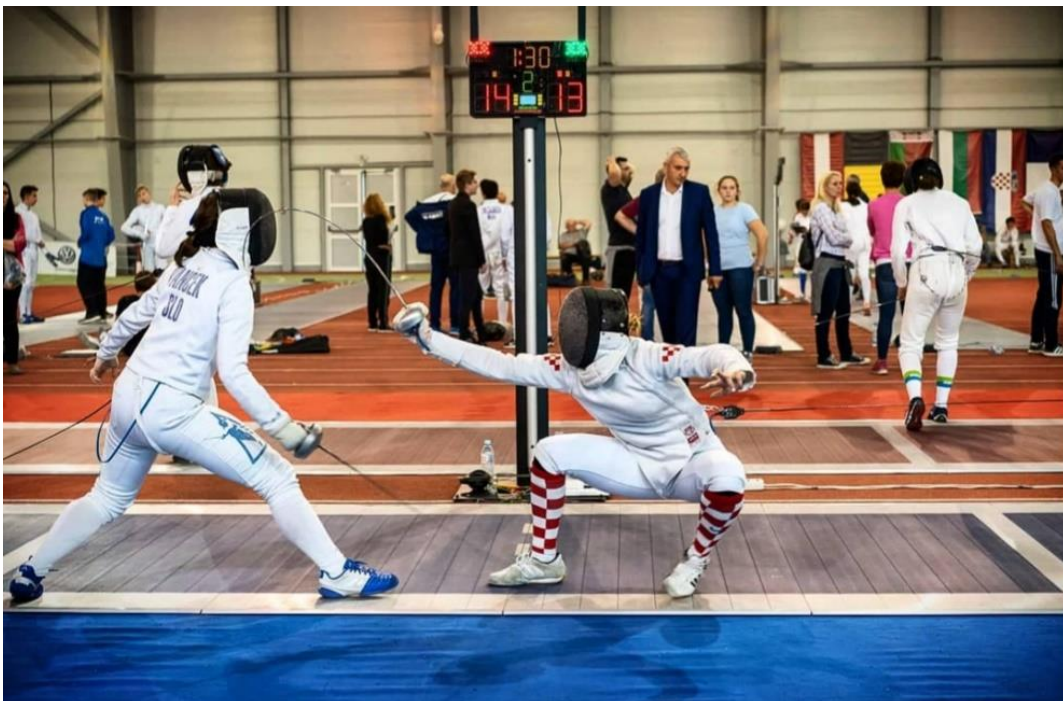
Slika 11. Slobodna borba

Slobodna borba je vid vježbanja vještine mačevanja u kojoj je sportaš slobodan da po vlastitom nahođenju donosi odluke u borbi. Kreće se tempom kojim želi i kreira situacije u borbi koje mu najviše odgovaraju. Slobodne borbe su najbližije natjecateljskim borbama i stoga su najvažniji dio mačevalačkog treninga. Služe za procjenu forme borca i mogućih pogrešaka. Rezultat se u slobodnoj borbi može, ali i ne mora računati. U natjecateljskom dijelu sezone slobodne borbe su najzastupljenija vježba mačevalačkog treninga. (Kovačić, 2023) Potrebne su kako bi se uvježbala taktika za natjecanje koje prethodi.