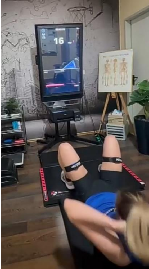
Slika 3. Trbušnjaci (izvor: vlastita arhiva autora)

savijenih nogu po devedeset stupnjeva dolazi do uspravnog položaja trupa. Ispravan trbušnjak je onaj u kojem ispitanik laktovima dotakne koljena koja su i dalje savijena pod istim kutom. Senzori koji se nalaze na trupu omogućavaju nam mjerenje kuta prilikom podizanja trupa u uspravan položaj. Ukoliko pokušaj nije ispravan, takav pretklon trupa nije validan te se ne računa. Na taj način eliminiramo pogreške prilikom izvođenja testa.