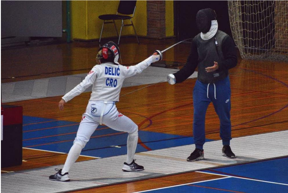
Slika 10. Individualna škola

boda, ispada i fleša. Osim kretnji ispravlja se držanje mača, pokreti oružjem i pozicije. Moguće je raditi škole na način da budu primarno tehničkog tipa ili taktičkog tipa. Moguća su izvođenja složenih ili jednostavniji akcija. Nedostatak ovakvog tipa vježbanja je nemogućnost postizanja potpune simulacije borbe. (Kovačić, 2023)