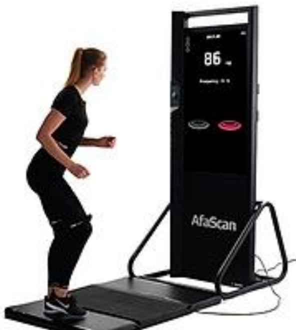
Slika 6. Brzina frekvencije pokreta

Cilj testa je da ispitanik odradi što više i što brže manjih koraka u mjestu unutar zadanog vremena. Test se izvodi petnaest sekundi. Veći rezultat može ukazivati na veći postotak brzih mišićnih vlakana u tkivu, kao i dobru povezanost živčanog sustava sa mišićnim sustavom.