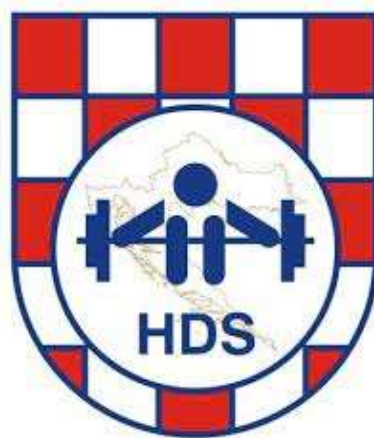
Slika br. 10

Savez je osnovan 1949. godine u Zagrebu. Poznato je da je dizanje utega unutar Hrvatske jedno od najtrofejnijih hrvatskih sportova. Nikolaj Peshalov najznačajniji je u hrvatskoj povijesti dizanja utega. Podrijetlom iz bugarske, ali sa hrvatskom putovnicom na Olimpijskim igrama s rezultatom od 150 kg trzaj, 175 kg izbačaj, osvojio zlatnu medalju. Osim toga njegova postignuća su se nastavila u Ateni 4 godine nakon kada osvaja broncu. Uz Nikolaja poznati hrvatski trener Luka Radman osvojio je 1983. godine svije srebrene medalje. Poznati osvajači medalja u dizanju utega još su Zdenko Korpar, Amar Mušić, Eni Mušić, Silvio Bijelić... Na našim prostorima poznato je ukupno 9 klubova: Split, Solin, Kaštela, Metalac ZG, Vukovar, Osijek, Slavonija Osijek, Rijeka i Dražice.