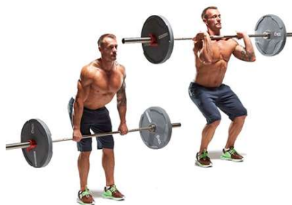
Slika br. 6 ( Slika nabačaja)