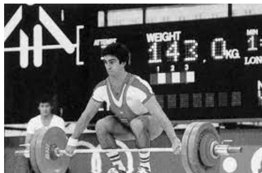
Slika br. 3

Olimpijski weightlifting u javnosti pojavljuje se kao pojam već u staroj Grčkoj gdje su utezi zamijenjeni kamenjima. Osim u staroj Grčkoj natjecanje u dizanju utega zabilježeno je i u drevnom Egiptu. Dizanje utega koje poznajemo kao danas kreće u devetnaestom stoljeću. U Londonu 1891. godine održano je prvo svjetsko natjecanje u dizanju utega koje je osvojio Edward Lawrence Levy. Kao jedna od disciplina na Olimpijskim igrama pojavljuje se 1896. godine i u program ulazi od 1920. godine. Žene su u dizanju utega odobrenje za natjecanje dobile tek 2000. godine u Sydneyu. Organizacija IWF, odnosno International Weightlifting Federation osnovana je 1905. godine sa sjedištem u Budimpešti. Unutar Europe poznata je organizacija EWF ili European Weightlifting Federation osnovana 1969. godine u Varšavi. Grad Rijeka bila je grad domaćin 76. po redu Europskog prvenstva u dizanju utega. 1997. godine. Svjetsko prvenstvo koje je omogućilo natjecanje ženskog spola održalo se 1987. godine u SAD-u. Zasad svjetske rekorde u muškoj kategoriji drži Hossein Razazadeh iz Irana (rekord od podignuta 472 kg u kategoriji preko 105kg), a ženskoj kategoriji kineska dizačica Zhou Lulu (rekord od podignuta 333kg u kategoriji preko 75kg). Za Hrvatsku povijest dizanja utega značajan je Nikolaj Pešalov koji je osvojio ukupno 16 odličja na dvije Olimpijade, dva Svjetska te četiri Europska prvenstva.