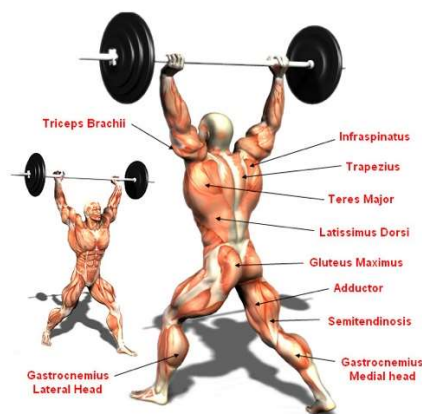
Slika br. (Anatomska struktura izbačaja)

Agonisti kod izbačaja su m. deltoid i m. quadriceps femoris, a sinergistim. Triceps Surae i opružaci kuka. Za razliku od nabačaja i trzaja, izbačaj ima nešto više stabilizatora zbog stabilnosti koja je potrebna pri izvođenju vježbe. Stabilizatori su: m. erector spinae, pregibači trupa, m. triceps brachii i gornji dio leđa.