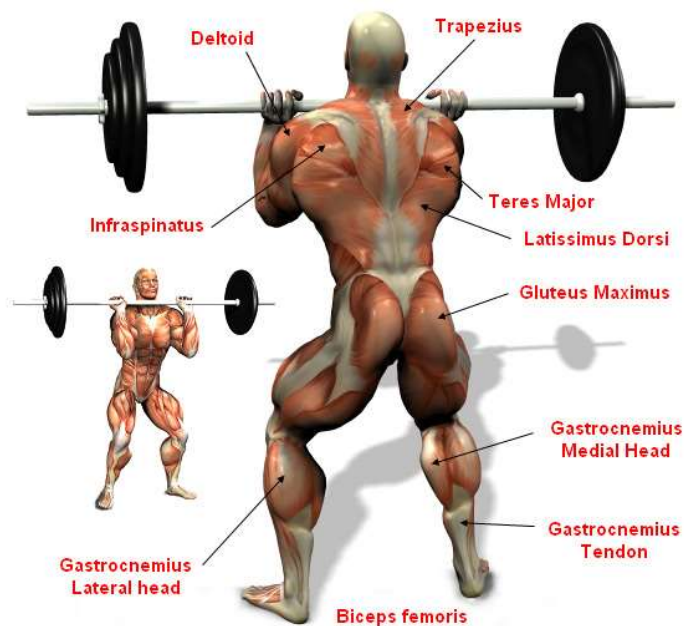
Slika br. 7 (Anatomska struktura nabačaja)

Što se tiče anatomske analize nabačaja koriste se različite grupe mišića. Agonisti su m. erector spinae i m. quadriceps femoris. Od sinergista u nabačaju sudjeluju m. triceps surae, m. trapezius i m. gluteus maximus, a stabilizatori su m. deltoides, p. deltoides i gornji dio leđa.