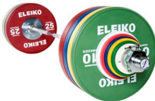
Slika br. 9

Prema pravilima koje navode u svojim dokumentima Olimpijskih igri oprema se sastoji od šipke težine 20 kg za muškarce, a kod natjecanja 15 kg za žene. Na šipku postavljaju se željezni utezi u obliku ploča različitih boja koje označavaju težinu ploče. Težine ploča kreću se od 2.5 kg do 25 kg. Na šipku postavlja se jednak broj ploča s obje strane kako bi se dobila željena težina utega. Natjecanje se odvija na drvenom podu 4x4 metra prekrivenom materijalom koji omogućava da se dizač prilikom izvođenja vježbi ne poklizne. Svaka od šipki na dva dijela označena je posebno kako bi хват dizača uvijek bio na istom mjestu.