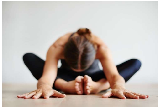
Slika br. 12 (Prikaz vježbe mobilnosti)

Naglasak na osnovne vježbe kod rekreativaca svodi se na vježbama mobilnosti. Naime mobilnost u dizanju utega jako je bitna značajka koja itekako utječe na napredak i samo izvođenje vježbe. Između pojedinaca razvio se mit kako su ljudi rođeni s mobilnosti i ne može se raditi na njoj, no to je potpuno krivo. Naporan trud i uloženo vrijeme u vježbe koje pospješuju mobilnost mogu rekreativca dovesti od vrlo niske mobilnosti do perfekcije. Različita istezanja na dnevnoj bazi pospješuju mišićima i tetivama da se opuste i ne budu grčeviti. Mišići i tetive opuštaju se i iz dana u dan mobilnost rekreativca postaje sve bolja.