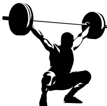
Slika br. 1

Olimpijski weightlifting pojam je koji definira teškoatletsku vrstu sporta u kojemu je natjecatelj cilj podići što veću težinu. Prvi put pojavljuje se na prvim Olimpijskim igrama 1896. godine u Ateni, a konstantno se pojavljuje na programu od 1920. godine. Žene s natjecanjem na Olimpijadi kreću tek od 2000. godine u Sydney-u. Prvo natjecanje u weightliftingu u Europi održano je 1896. godine u Rotterdamu. Važno je naglasiti da ova vrsta športa ne bavi se isključivo snagom već je potrebno znanje o specifičnoj tehnici koja se koristi. Trzaj i izbačaj dvije su glavne discipline weightliftinga. Dvije su jako zahtjevne discipline u kojima natjecatelj mora spojiti snagu, tehniku i mobilnost u istom trenutku. U suvremenome svijetu weightlifting postaje sve poznatiji među populacijom zbog velike mogućnosti u napretku. (Everett, G. (2014). Olympic Weightlifting, A Complete Guide for Athletes & Coaches, Second Edition)