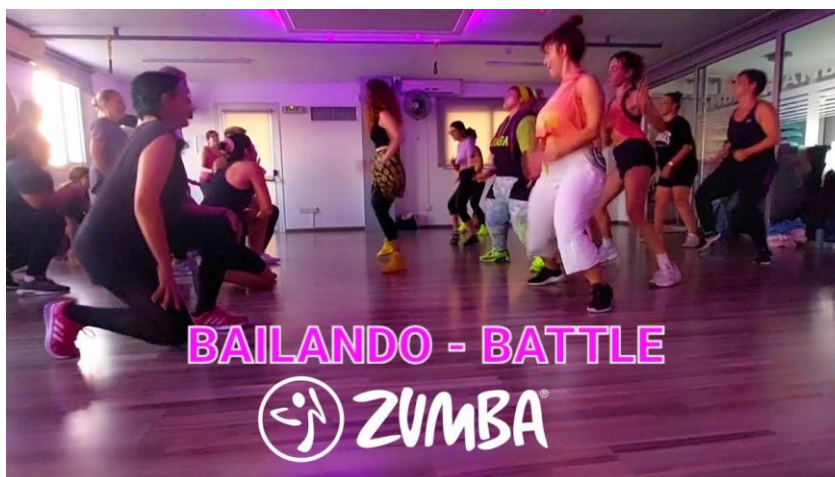
Slika 6-1. Primjer igre u Zumba fitnessu za poticanje kreativnosti i razmišljanja (preuzeto iz [24])

Ne poštivanjem ovih principa napredak u bilo kojoj grani sporta pati. Trening bez zdrave prehrane ne daje dobre rezultate, a manjak sna dovodi do umora i pretreniranosti. Kognitivni status omogućuje pravilniju izvedbu, povećava motivaciju i doprinosi zdravlju mozga kao i općenitom tjelesnom zdravlju.