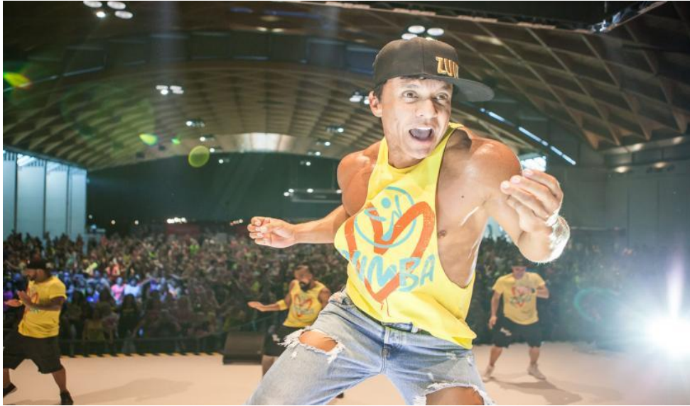
Slika 3-1. Alberto Perez – Osnivač Zumba Fitnessa (preuzeto iz [3])