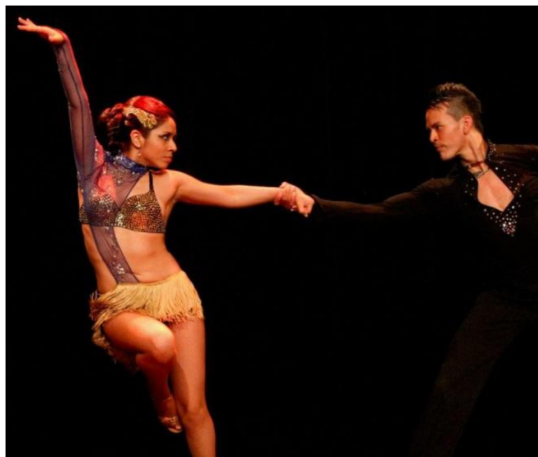
Slika 4-4. Salsa (preuzeto iz [14])

Slike glavnih plesnih stilova od kojih se sastoji Zumba fitness: