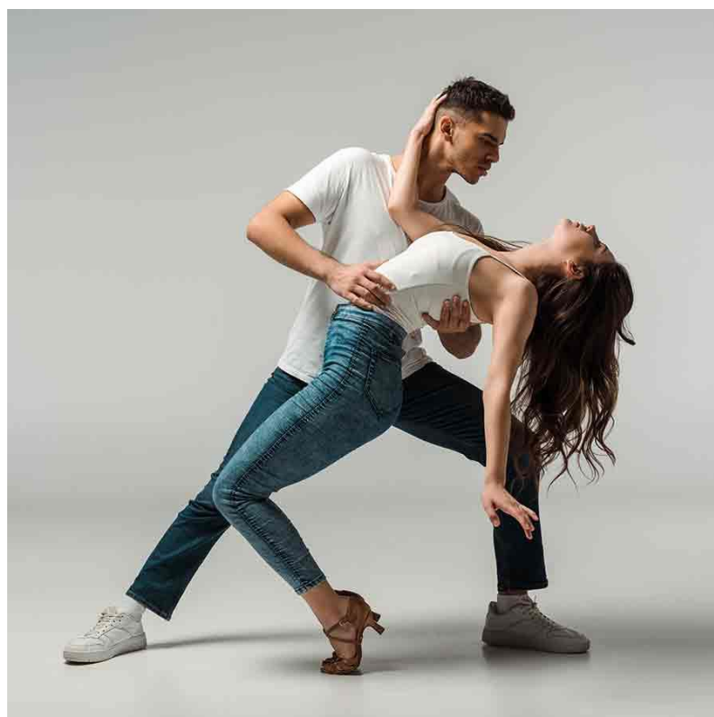
Slika 4-5. Bachata (preuzeto iz [15])