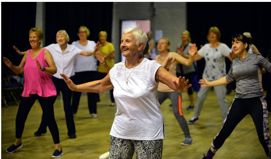
Slika 5-1. Sat Zumba Gold prilagođen starijoj životnoj populaciji (preuzeto iz [21])

Razvijanje funkcionalnih sposobnosti kod djece je bitan za njihov rast i razvoj. Funkcionalne sposobnosti kod djece se odnosi na njihovu sposobnost izvršavanja različitih motoričkih, kognitivnih i socijalnih zadataka primjereni njihovoj dobi. Djeca u ranijoj životnoj dobi jako puno uče i usvajaju pojedine vještine koje im poslije puno znače. Redovita tjelesna aktivnost kod djece pospješuje napredniji rast i razvoj. Postavljanje određenih zadataka bilo da se radi od raznim poligonima ili igricama pomaže djeci da razvijaju svoje sposobnosti. Sportaši ili rekreativci koji su počeli rano sa tjelesnim aktivnostima, te kojima je trening bio dio svakodnevnice postali su puno uspješniji naspram drugih. Takvi sportaši imaju znatno bolje razvijene funkcionalne i motoričke sposobnosti, te im je uvelike lakše naučiti neki određeni pokret ili neku novu kretnju. Važno je napomenuti da se razvoj funkcionalnih sposobnosti kod djece odvija individualno i da djeca mogu napredovati u različitim područjima u različito vrijeme.