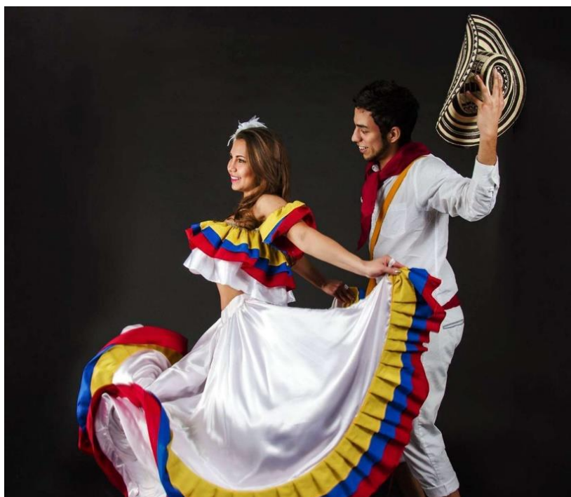
Slika 4-6. Cumbia u tradicionalnoj nošnji (preuzeto iz [16])