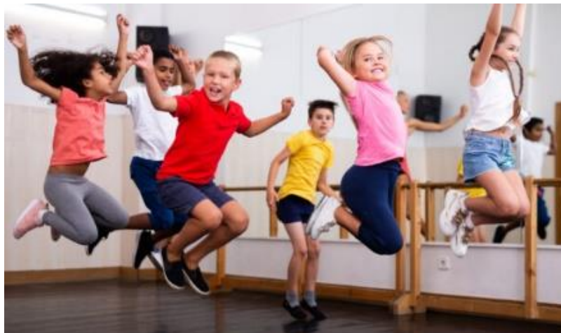
Slika 4-1. Zumba Kids program (preuzeto iz [10])

Na slikama ispod prikazani su neki od gore navedenih programa Zumba Fitnessa: