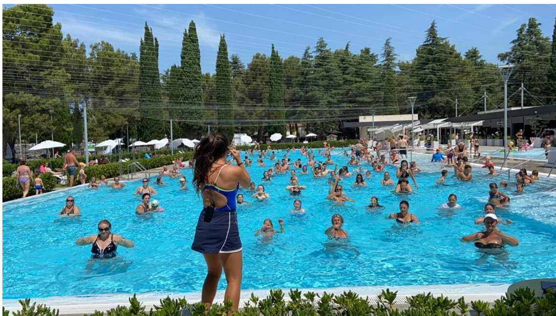
Slika 4-2. Aqua Zumba (osebna slika)