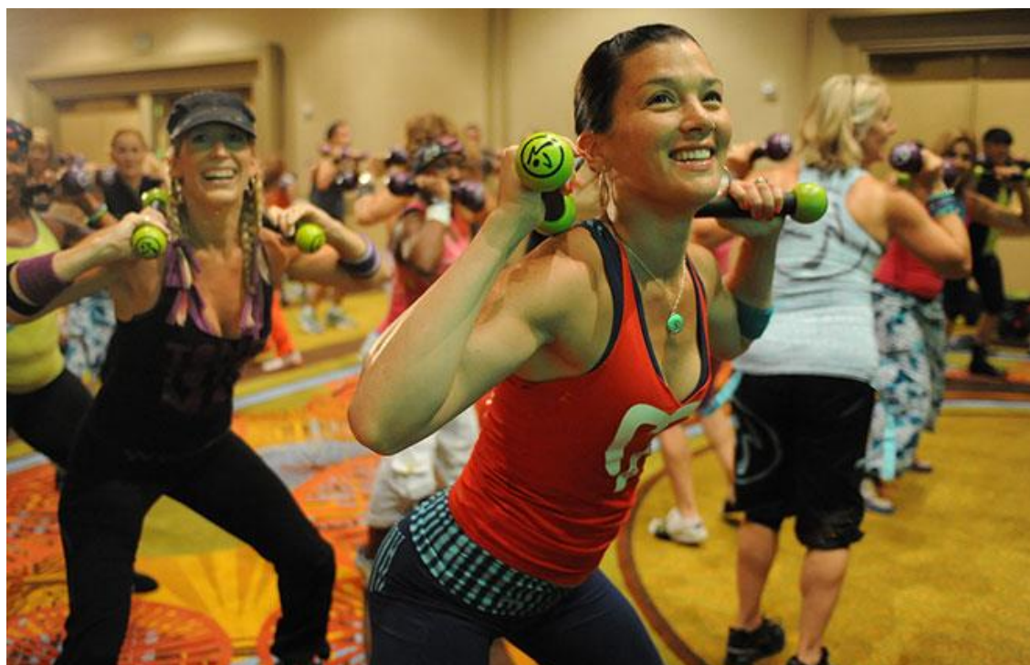
Slika 4-3. Zumba Toning (preuzeto iz [11])