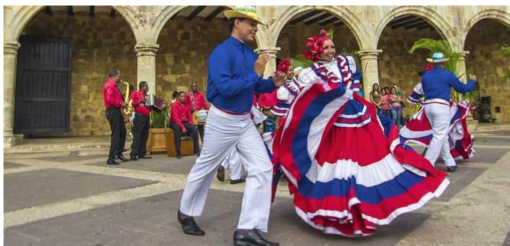
Slika 4-7. Merengue u tradicionalnoj nošnji (preuzeto iz [17])