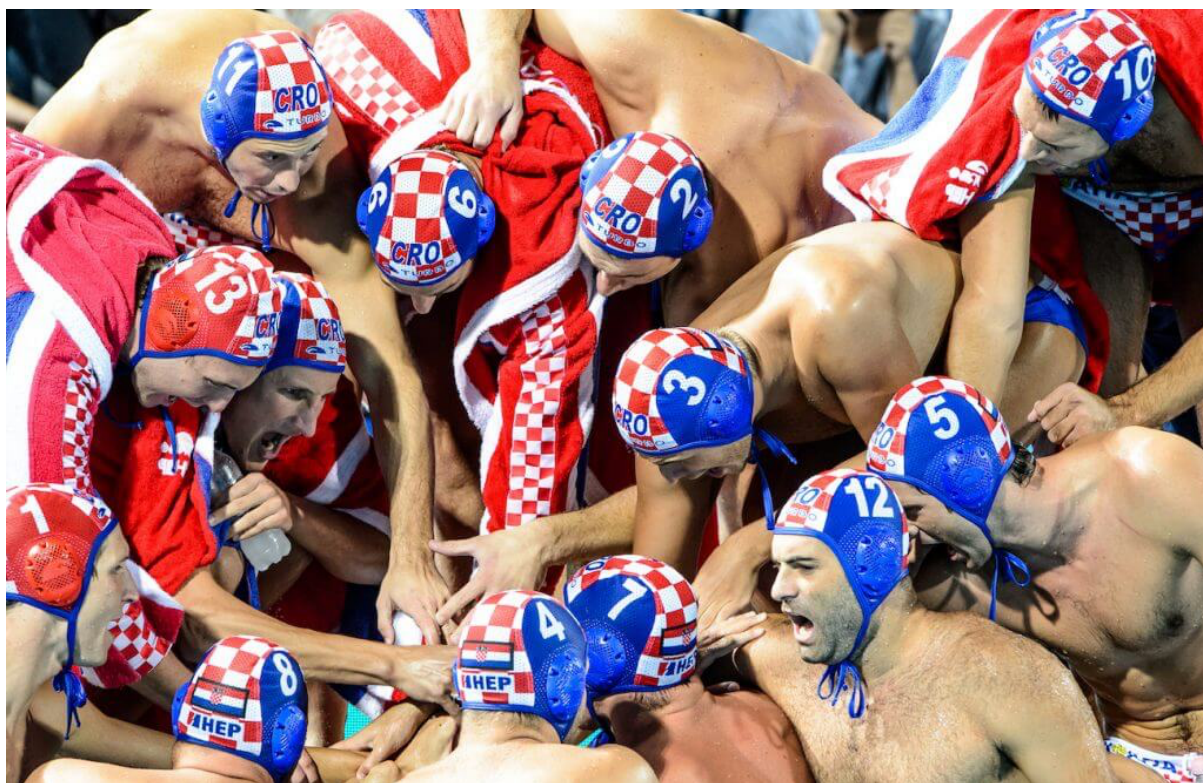
Slika 1. prikazuje slavlje hrvatskih reprezentativnih vaterpolista – „Barakuda“