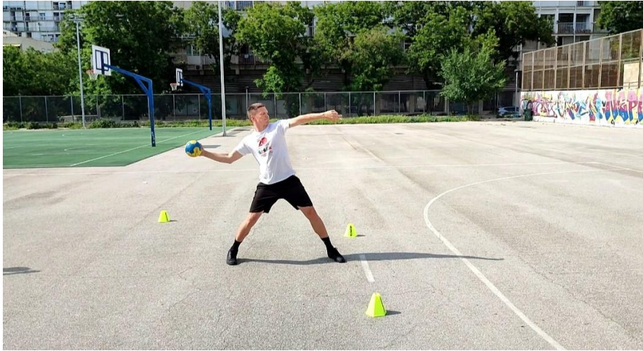
Slika 2: prikaz izvedbe šuta na gol rukom

Ocjenjivači tehnike – ocjenjivači tehnike su profesori sa kineziološkog fakulteta u Splitu iz područja rukometa i nogometa. Profesori su ocjenjivali tehniku izvođenja rukom i nogom te dodjeljivali ocjene od 1 do 5 za svaki od tri pokušaja.