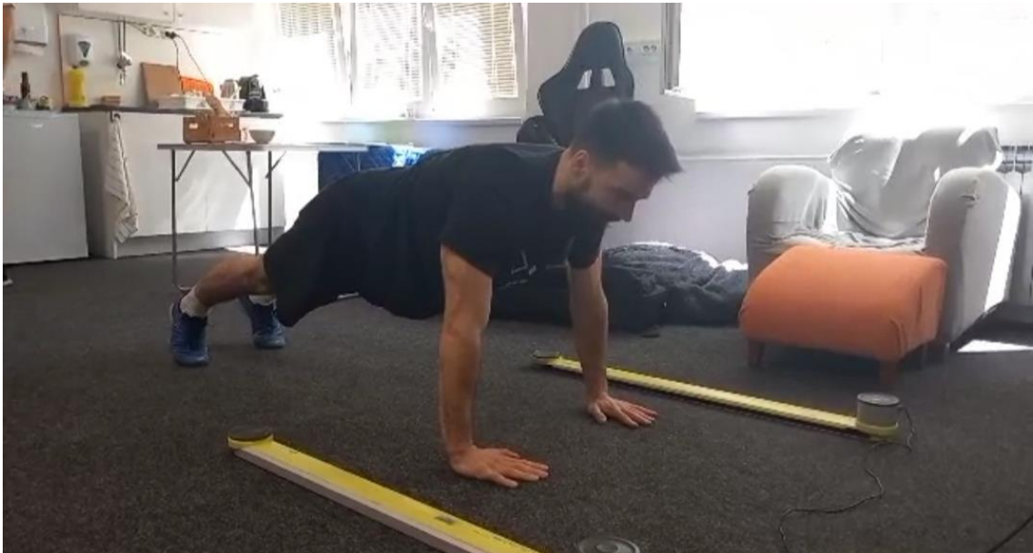
Slika 3: prikaz izvedbe cmj ruke – početni položaj

Uređaj se prvenstveno koristi u dijagnostici parametara u izvođenju različitih skokova, kao što su visina odraza, vrijeme trajanja kontakta sa podlogom, vremensko trajanje skoka. Također se može koristiti za određivanje specifičnih kinematičkih parametara u analizi hodanja (OptoGait) te analizi trčanja. Korištenje uređaja omogućuje objektivnu dijagnostiku, također i usvajanje korektivnih kinezioloških sadržaja kako bi se korigirale utvrđene nepravilnosti. Ovaj test se provodio u prostorijama kineziološkog fakulteta gdje je svaki od ispitanika prvo radio CMJ – noge na način da se iz polučučnja pokuša što više odraziti u zrak ispruženih nogu. Bilježio se svaki rezultat iz tri pokušaja. Nakon testiranja nogu radio se CMJR ruke. Test se izvodio na način da se ispitanik nalazi u položaju plenkica ispruženih ruku te radi sklek i odražava se u istom položaju u zrak ispruženih ruku. Također se bilježio svaki rezultat iz tri pokušaja.