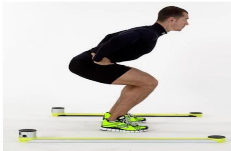
Slika 5: prikaz izvedbe cmj noge