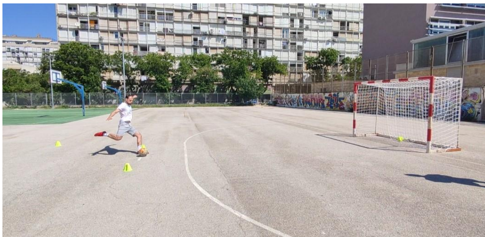
Slika 1: prikaz izvedbe šuta na gol nogom

Šut – radar pištolj je elektronički uređaj koji koristi princip radara za odašiljanje elektromagnetskog signala prema lopti te mjeri vrijeme koje je potrebno da se signal vrati natrag. Na temelju tog vremena, uređaj izračunava brzinu objekta. Ovaj test se izvodio na otvorenom prostoru Kineziološkog fakulteta koji je namijenjen za praktičnu nastavu. Svaki ispitanik je tri puta šutirao na gol prvo rukom a zatim tri puta nogom. Šut se izvodio sa sedam metara udaljenosti iz kratkog zaleta od dva koraka. Svaki rezultat izmjeren radar pištoljem se zapisao u mjernim jedinicama km/h.