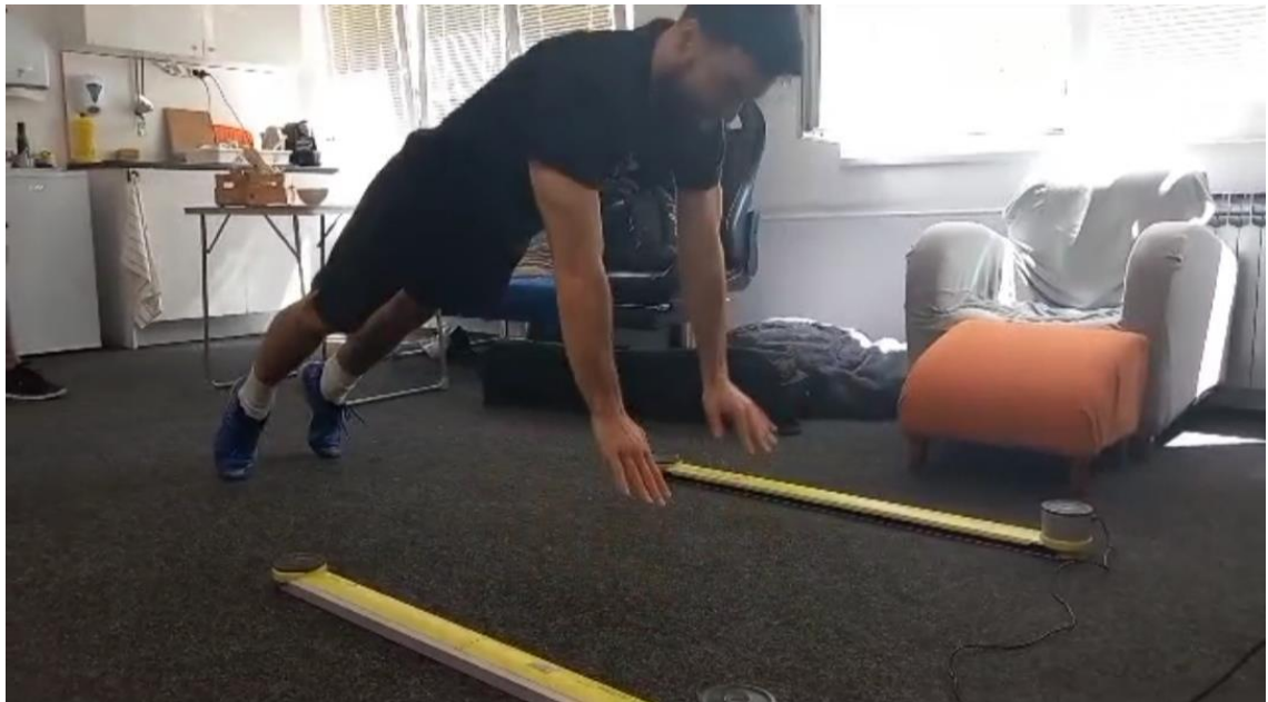
Slika 4: prikaz izvedbe cmj ruke – faza odraza