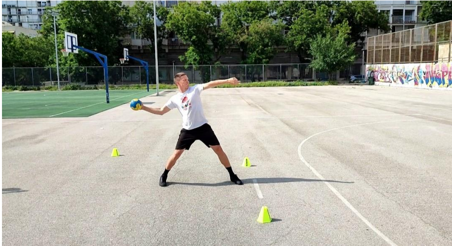
Slika 2: prikaz izvedbe šuta na gol rukom

Ocjenjivači tehnike – ocjenjivači tehnike su profesori sa kineziološkog fakulteta u Splitu iz područja rukometa i nogometa. Profesori su ocjenjivali tehniku izvođenja rukom i nogom te dodjeljivali ocjene od 1 do 5 za svaki od tri pokušaja.