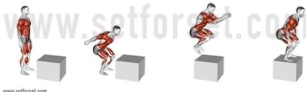
Slika 4. Pliometrijske vježbe skakanja i doskoka

Jačanje donjih udova također je važno u svrhu prevencije ozljeda. Malo je studija pokazalo da program treninga koji kombinira trening snage, proprioceptivni trening i vježbe skakanja i doskoka može biti učinkovit u smanjenju ozljeda kod rukometaša i rukometašica.