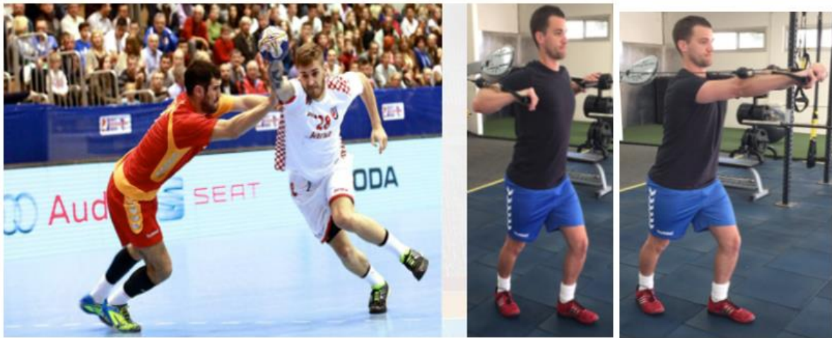
Slika 8. Vježbe postiska za remena

Tipični recept za vježbe trebao bi uključivati, uz bench press, vježbe potiska za ramena, unutarnje i vanjske rotacije protiv otpora s različitim kutovima, brzinama i vanjskim opterećenjima, vježbe tipa pull-over i vježbe usmjerene na mišiće torakalne kralježnice i lopatice. Brzina izbačaja i prevencija ozljeda ramena nisu jedini razlozi za uvođenje treninga snage u program treninga rukometaša. Snaga gornjeg dijela tijela i jezgre zapravo su neophodni za učinkovite obrambene pokrete potrebne za zaustavljanje protivnika u obrambenim akcijama i sugerirano je da su neophodni atributi za elitne rukometaše, posebno za stručnjake za obranu.