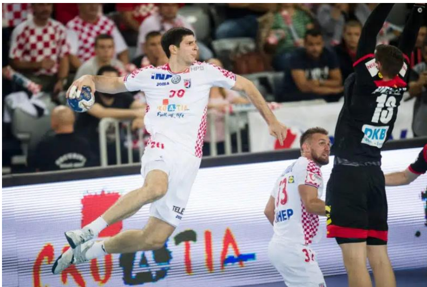
Slika 3. Igrač u skok šutu

Šutevi u skoku su, primjerice, najčešće korištena šuterska tehnika rukometaša (više od 70% udaraca izvode se u skoku 8) i izvode se zaletom, podnožjem i odrazom, obično na suprotnu stranu. noga do ruke koja baca (iako će neki igrači ponekad izvoditi skok udarce odričući se s oba donja uda i/ili skačući na nogu s iste strane ruke koja baca). Reakcijske sile na tlo izmjerene kod rukometaša koji izvode odskok jednom nogom nakon utrčavanja pokazale su vrijednosti veće od 3 x tjelesna masa igrača s vremenom kontakta s tlom kraćim od 300 milisekundi (Pori i sur., 2005.)