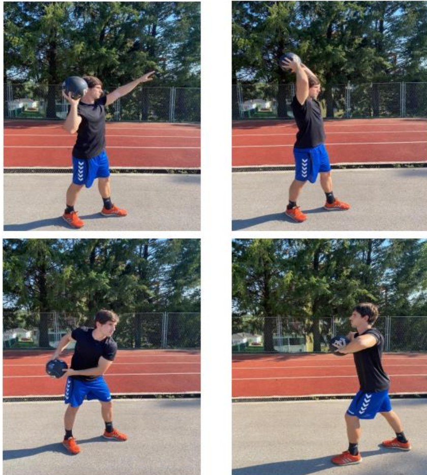
Slika 7. Primjeri različitih vrsta bacanja medicinke (Žganjer, 2020)

Snaga gornjeg dijela tijela, procijenjena dinamički pomoću benchpressa i brzine dizanja s različitim opterećenjem, pokazala se prediktivnom za brzinu bacanja kod rukometaša (Debanne i sur., 2011). Program treninga osmišljen za poboljšanje snage gornjeg dijela tijela mogao bi koristiti bench press kao jednu od vježbi ne samo u svrhu treninga, već i za procjenu napredovanja i učinkovitosti programa.