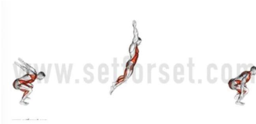
Slika 5. Kontinuirani skokovi u širinu

Jačanje donjih udova zapravo nije važno samo za okomite skokove i skok šuteve, već i za pripremu igrača za izvođenje brzih promjena smjerova i reznih pokreta koji se izvode tijekom treninga i natjecanja. U takvim pokretima igrači ubrzavaju naprijed, a zatim iznenada pokušavaju promijeniti smjer kako bi izbjegli braniča. Za usporavanje i zatim ubrzavanje u drugom smjeru potrebna je visoka razina snage. Stoga bi trening snage trebao biti usmjeren tako da omogući rukometašima da mogu sigurno usporavati i ubrzavati u različitim smjerovima smanjujući rizik od ozljeda (Bencke, 2013.).