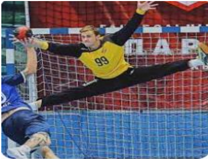
Slika 6. Rukometni golman

Kod treninga snage vratara, posebnu pažnju treba podrediti specifičnoj snazi abduktora, natkoljenice i nadlaktice koji dominantno sudjeluju u obrambenim pokretima vratara. Veća snaga ovih mišića omogućava bržu i stabilniju reakciju, te također izdržljivost ruku i nogu.