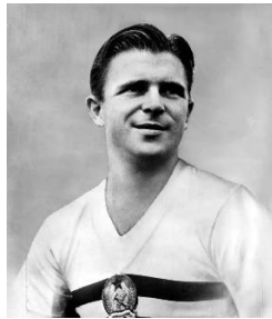
Slika 5. – Ferenc Puskas, slavni mađarski nogometaš

Za samo prvenstvo domaćini su izgradili veliki stadion Maracanu čiji je kapacitet 200 tisuća gledatelja. Pobjednik prvenstva po drugi put postala je mala zemlja Urugvaj koji su u finalu pobijedili domaćina. U Švicarskoj 1954. u finalu su se sastali Njemačka i Mađarska (rezultat 3:2). Tadašnju mađarsku reprezentaciju mnogi smatraju najboljom reprezentacijom uopće (u finalu su izgubili nakon 34 utakmice zaredom). Zvijezde tog prvenstva su njemački kapetan Fritz Walter te najbolji mađarski nogometaš svih vremena Ferenc Puskas.