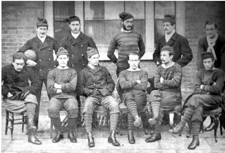
Slika 1. – momčad The Royal Engineers, finalist prvog FA kupa (dostupno na https://en.wikipedia.org/wiki/Royal_Engineers_A.F.C. )

nogometa - FA Cup. Prvo izdanje tog natjecanja je bilo 1872. Momčad The Royal Engineers bila je favorit natjecanja. U finalu koje se igralo pred 2000 gledatelja s plaćenom ulaznicom, favoriti su izgubili rezultatom 1:0, ponajprije jer su većinu utakmice igrali s igračem manje zbog ozljede jednog igrača (tada nije bilo mogućnosti zamjene). Ubrzo je FA Cup postao iznimno popularan, pa su svi klubovi htjeli sudjelovati. Za to su trebali prihvatiti uvjete i pravila Saveza.