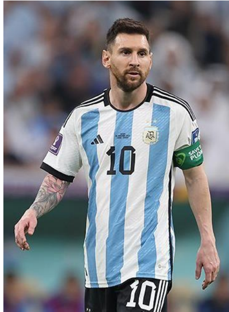
Slika 10. – Lionel Messi, argentinski nogometaš (dostupno na https://hr.wikipedia.org/wiki/Lionel_Messi )

Najviše naslova Copa Americе osvojila je momčad Urugvaja, petnaest puta je bila prvak turnira. Kao zanimljivost ovog turnira, možemo istaknuti da Pele i Maradona, legende svojih momčadi, Brazila i Argentine, nikad nisu uspjeli osvojiti turnir.