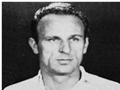
Slika 13. – Frane Matošić, legendarni kapetan Hajduka (dostupno na https://hr.wikipedia.org/wiki/Frane_Matošić )

U Hajduku je ponikao i trofejni hrvatski trener Tomislav Ivić, koji je vodio sjajnu „zlatnu generaciju“ koja je sedamdesetih godina 20. stoljeća četiri puta bila prvak države te osvojila pet kupova.