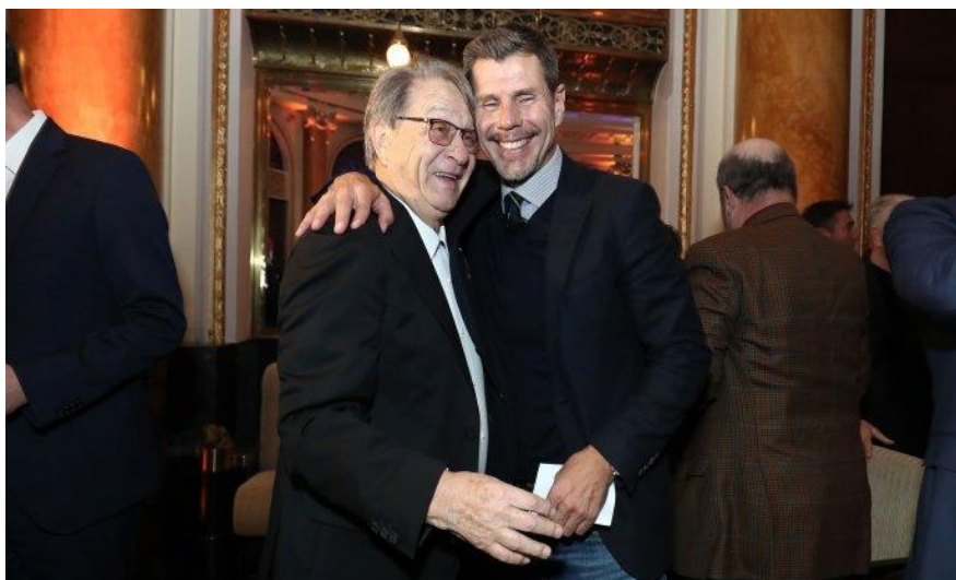
Slika 17. – Miroslav Ćiro Blažević i Zvonimir Boban, izbornik i kapetan Vatrenih na SP 1998.