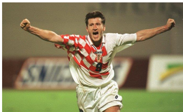
Slika 7. – Davor Šuker, najbolji strijelac SP 1998. (dostupno na

svih dosadašnjih prvenstava. Organizacija SP 1994. pripala je SAD-u. Prvenstvo se igralo na devet stadiona u devet gradova. Finale su u Los Angelesu odigrali Brazil i Italija. Prvi put u povijesti pobjednik je dobiven izvođenjem jedanaesteraca. Brazil je u tome bio bolji. Iako su Amerikanci priredili spektakl, nogomet je i dalje ostao daleko od popularnosti košarke ili bejzbola. Domaćin SP 1998. bila je Francuska. Igralo se u deset gradova na deset stadiona, a 64 utakmice sudila su 34 suca. Svjetski prvaci postali su Francuzi nakon pobjede nad Brazilom u finalu, dok je Hrvatska osvojila treće mjesto, najveći uspjeh do tada. U nogometne anale ušao je Davor Šuker kao najbolji strijelac s 6 zgoditaka. Polufinalni susret domaćina Francuske i naše reprezentacije na francuskoj TV postaji „Tele France 1“ gledalo je 17.6 milijuna ljudi.