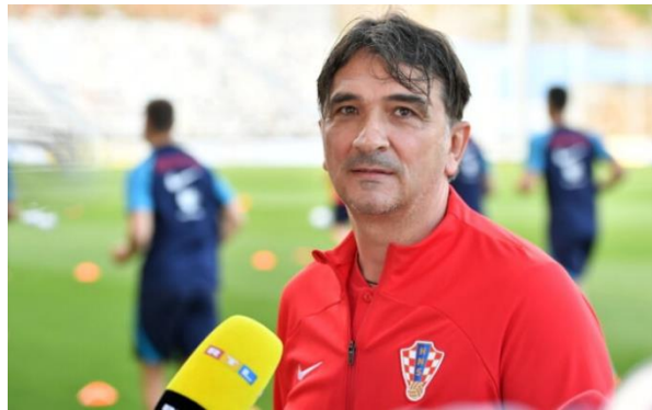
Slika 16. – Zlatko Dalić, hrvatski izbornik u razdoblju 2017.-2023.

Pored navedenog velikog uspjeha u Francuskoj, treba istaknuti srebrnu medalju na SP u Rusiji 2018. te ponovno broncu na SP u Katru 2022. U oba navrata Hrvatsku je vodio izbornik Zlatko Dalić.