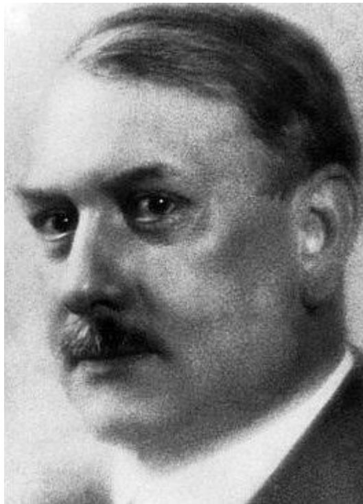
Slika 2. – Robert Guérin, prvi predsjednik FIFA-e, u razdoblju 1904.-1906. (dostupno na https://en.wikipedia.org/wiki/Robert_Guérin )

FIFA je osnovana u Parizu, 21. svibnja 1904. Tog dana skupina elegantne gospode, s modernim cilindrima i obučena u crne frakove, se okupila u zgradi Francuskog sportskog saveza u Ulici Svetog Honorea 229. Bili su tu predstavnici nogometnih saveza Francuske, Belgije, Švedske, Nizozemske, Danske i Švicarske (nešto kasnije se pridružio i predstavnik Španjolske). Možda nisu slutili da će njihov pionirski pothvat promijeniti tijek svjetske nogometne povijesti i postati suvremena civilizacijska stečevina. Rođenjem svjetske nogometne udruge utemeljena je najmasovnija organizacija na Zemlji, s više članova nego što ih imaju Ujedinjeni narodi. Na taj sastanak nisu došli Englezi koji su svoj savez utemeljili davne 1863. te su nogomet smatrali svojom igrom i nisu je željeli dijeliti s drugima. Prvi predsjednik je bio Robert Guérin. Međutim, nakon nekog vremena Englezi su se predomislili i 14. travnja 1905. priznali autoritet FIFA-e i postali njezin osmi punopravni član. Na Drugom kongresu u Parizu u lipnju 1905. FIFA-i su se priključile Njemačka, Italija, Austro-Ugarska te otočni nogometni savezi Škotske, Irske i Walesa.