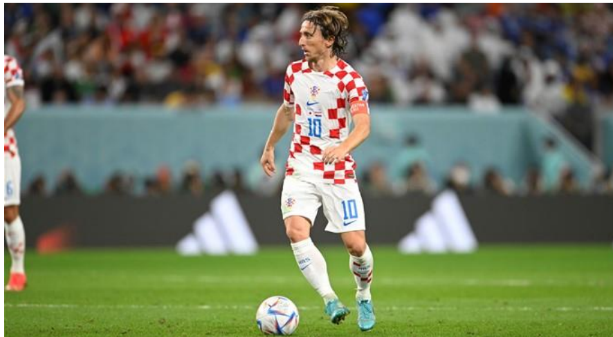
Slika 8. – Luka Modrić, dugogodišnji kapetan hrvatske reprezentacije i rekorder po broju nastupa (dostupno na https://hns-cff.hr/news/25183/luca-modric-u-fifinoj-momcadi-godine/ )

pobijedila Argentinu 1:0. Time se Njemačka po broju titula izjednačila s Italijom (uspješniji je samo Brazil s pet titula). Na SP 2018. u Rusiji prvi put je korištena video tehnologija VAR. To je i prvo svjetsko prvenstvo odigrano u jednoj od bivših sovjetskih republika. Povijesni uspjeh plasmanom u finale ostvarila je hrvatska reprezentacija koja je u istome poražena od Francuske rezultatom 4:2. Najboljim igračem turnira proglašen je naš kapetan Luka Modrić, zasjenivši tako „nogometne bogove“ Lionela Messija i Cristiana Ronalda. Iste je godine u izboru FIFA-e proglašen najboljim nogometašem na svijetu. Svjetsko prvenstvo u Katru održano 2022. je prvo svjetsko prvenstvo u arapskom svijetu i drugo svjetsko prvenstvo ukupno odigrano u Aziji nakon Svjetskog prvenstva 2002. u Južnoj Koreji i Japanu. Zbog velikih vrućina ljeti, igralo se u studenom i prosincu. Hrvatska je treći put u povijesti osvojila medalju. Vatreni su u utakmici za treće mjesto svladali Maroko. Svjetski prvak postala je Argentina koja je pobijedila Francusku u finalu.