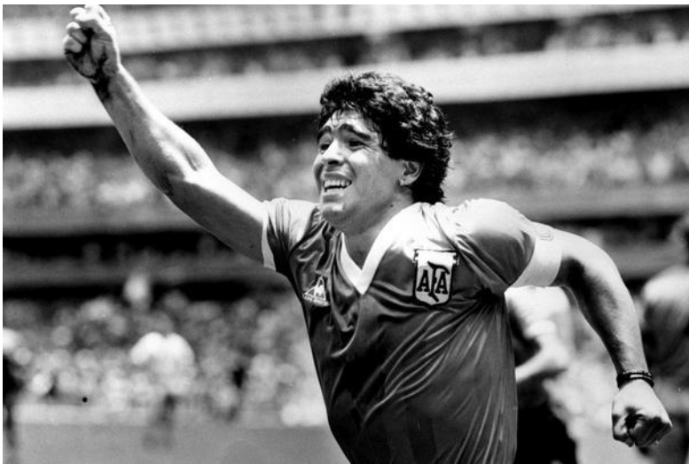
Slika 4. – Diego Maradona, argentinski nogometaš, jedan od najboljih svih vremena

Desetljeće između 1980. i 1990. je bilo vrijeme borbe nogometa za svoju dušu protiv prijetnje huliganstva. Godine 1985. u finalu europskog Kupa prvaka između branitelja Liverpoola i Juventusa na stadionu Heysel u Bruxellesu poginulo je 39 navijača Juventusa. Engleski klubovi su zbog navedenog događaja pet godina bili odsutni iz europskih natjecanja. Tijekom osamdesetih godina nogometnim terenima vladali su Diego Maradona i Michel Platini. Maradona je 1986. odveo Napoli do osvajanja talijanskog prvenstva, a Argentinu do naslova svjetskih prvaka.