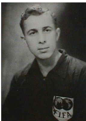
Slika 14. – Bernard Vukas, najbolji igrač u povijesti Hajduka (dostupno na https://hr.wikipedia.org/wiki/Bernard_Vukas )

Stari plac je pučki naziv za nekadašnje igralište nogometnog kluba Hajduk. Prvotno se, prije osnivanja Hajduka, taj komad zemlje zvao Krajeva njiva, koje je služilo kao vježbalište austrougarske vojske. Na Starom placu igralo se od 1911. do 1979., kada je za potrebe 8. mediteranskih igara izgrađen novi moderni stadion na Poljudu.