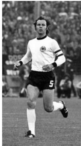
Slika 6. – Franz Beckenbauer, njemački nogometni velikan

Njemačkoj. Njemačka je kao aktualni prvak Evrope, postala i prvak svijeta. Zvijezde ovog prvenstva su kapetan Njemačke Franz Beckenbauer, najbolji igrač prvenstva Nizozemac Johan Cruyff te najbolji strijelac Poljak Grzegorz Lato. Na ovom prvenstvu sudio je Australac rođen u Hrvatskoj Tony Bošković.