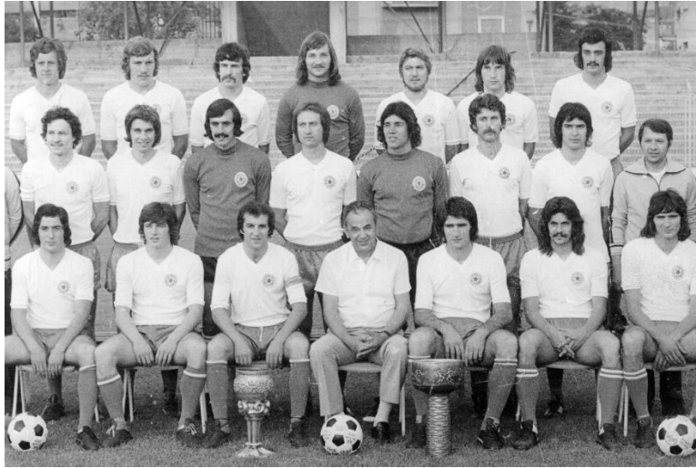
Slika 15. – „Zlatna generacija“ bijelih (dostupno na https://www.gkmm.hr/stranica/-i-tito-kirigin-i-najuspjesniji-predsjednik-hajduka )

(1975/76 i 1979/80 ušao je u četvrtfinale Kupa prvaka, a dvaput je bio u polufinalima - Kupa pobjednika kupova (1972/73) i Kupa Uefe (1983/84).