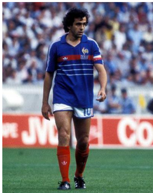
Slika 9. – Michel Platini, čuveni francuski nogometaš (dostupno na https://www.worldfootball.net/player_summary/michel-platini/ )

Godine 1976. europski prvak dobiven je izvođenjem jedanaesteraca, u čemu je Čehoslovačka bila bolja od Zapadne Njemačke. Četiri godine kasnije, 1980., došlo je do promjene načina igranja u završnici. U finalni turnir ušli su pobjednici sedam kvalifikacijskih skupina te domaćin Italija. Zapadna Njemačka pobjedom protiv Belgije postala je drugi put europski prvak. Prvenstvo 1984. jedno je od najljepših u povijesti, na njemu su dominirali Francuzi zahvaljujući nogometnom velemajestoru Michelu Platiniju. U finalu u Muenchenu 1988. Nizozemci su pobijedili SSSR 2:0 golovima Gullita i Van Bastena. Danska je 1992. na natjecanje u Švedskoj ušla kao zamjena za suspendiranu Jugoslaviju, ali je na kraju praktički bez priprema postala europski prvak.