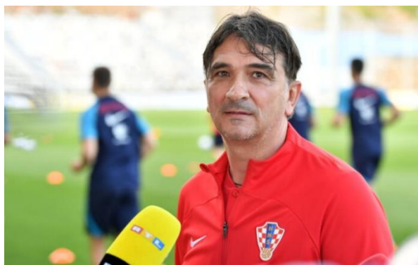
Slika 16. – Zlatko Dalić, hrvatski izbornik u razdoblju 2017.-2023. (dostupno na https://www.7dnevno.hr/sport/dalic-na-treningu-progovorio-o-livaji-pokusao-sam-ga-odgovoriti-da-napusti-reprezentaciju-ali-nazalost-nisam-uspio/ )

Pored navedenog velikog uspjeha u Francuskoj, treba istaknuti srebrnu medalju na SP u Rusiji 2018. te ponovno broncu na SP u Katru 2022. U oba navrata Hrvatsku je vodio izbornik Zlatko Dalić.