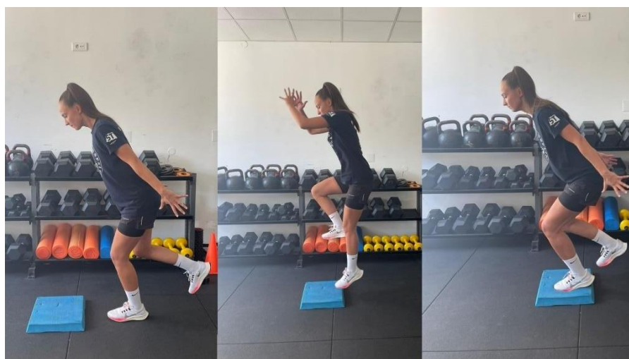
Slika 8 Jednonožni skok naprijed s doskokom na nestabilnu površinu

Vježbe dinamičke ravnoteže imaju vrlo važnu komponentu prilikom raznih doskoka, šutiranja, dodavanja.