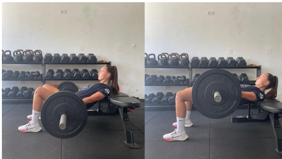
Slika 4 Hip thrust