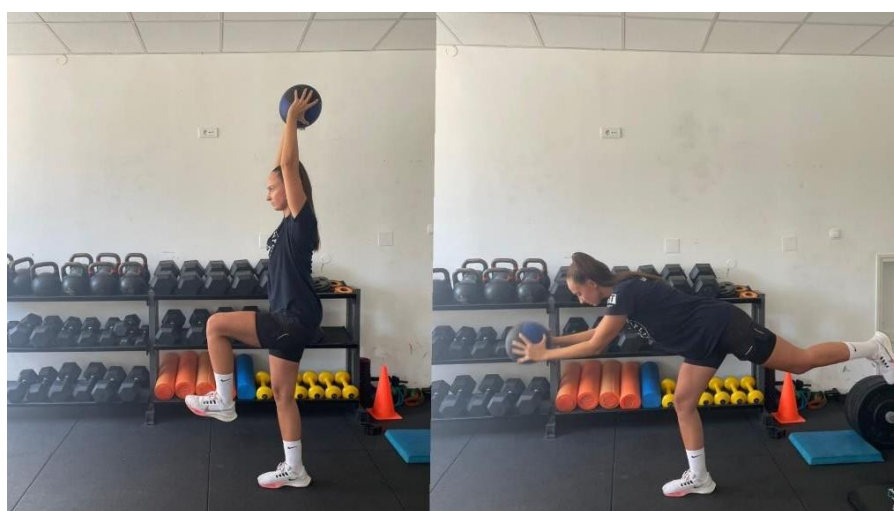
Slika 10 Jednonožno mrtvo dizanje s izbačajem medicine

Nogometna igra zahtijeva visoku razinu funkcionalnih sposobnosti. Izuzetno je važno raditi na povećanju kapaciteta navedenih komponenti. Nakon što smo koristili kontinuiranu metodu rada putem koje razvijamo aerobne sposobnosti, unutar ove faze s koristimo diskontinuiranu metodu. Metodu karakterizira izmjena intenziteta, odnosno izmjena većeg i manjeg opterećenja. Primjer diskontinuiranog oblika rada bi bio 15-15-30. Druga metoda koju koristimo je intervalna, karakteristična je po izmjeni intervala intezivnog rada i pasivnog odmora. Primjer intervalne metode bi bio 15-15.