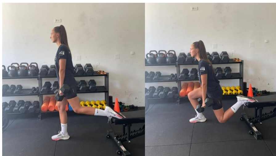
Slika 5 Bugarski čučanj