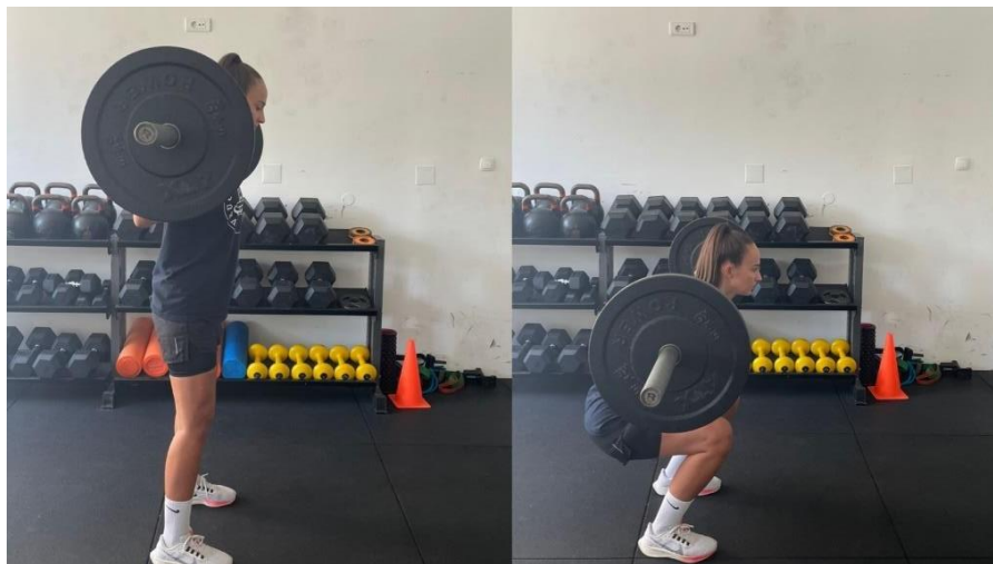
Slika 3 Stražnji čučanj

U nastavku ću prikazati neke od vježbi jakosti koje primjenjujemo unutar prethodno navedenih pod-faza.