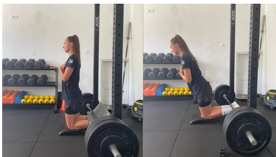
Slika 6 Nordic curl