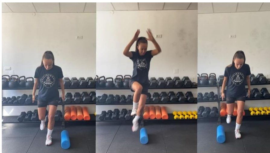
Slika 9 Jednonožni lateralni skok preko prepreke