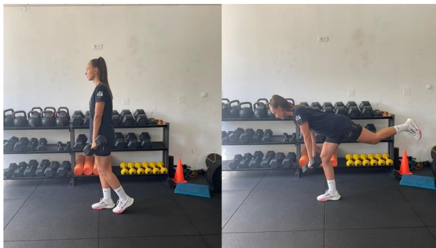
Slika 7 Jednonožno mrtvo dizanje

Osim rada na jakosti mišića nogu, unutar ove faze možemo odrađivati vježbe za jakost gornjeg dijela tijela bez ograničenja. Vježbe mogu biti balističke pri čemu se daje maksimalno ubrzanje tijelu, dijelu tijela ili vanjskom otporu, dominantno u koncentričnom načinu rada mišića.