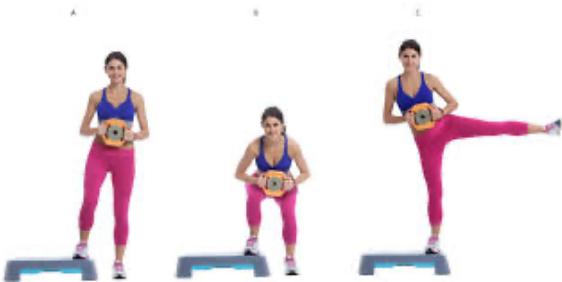
Slika 2.