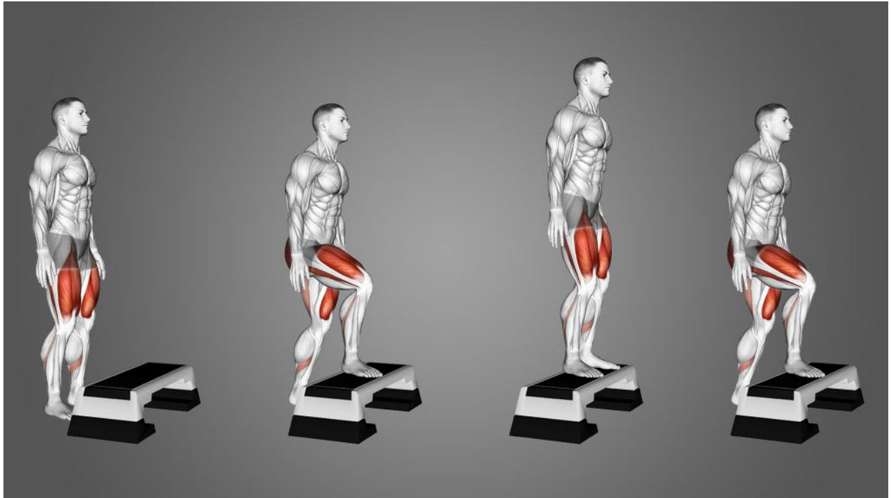
Slika 1.