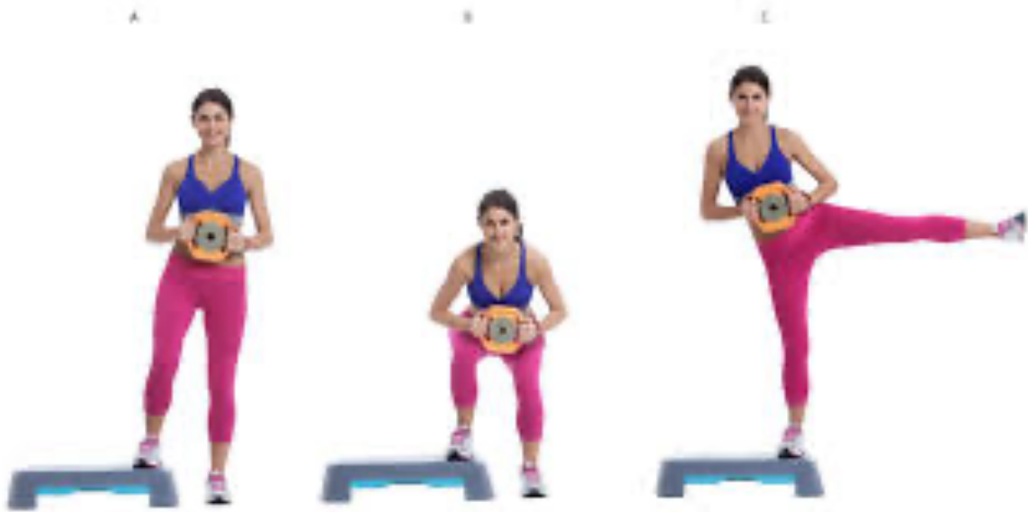
Slika 2.