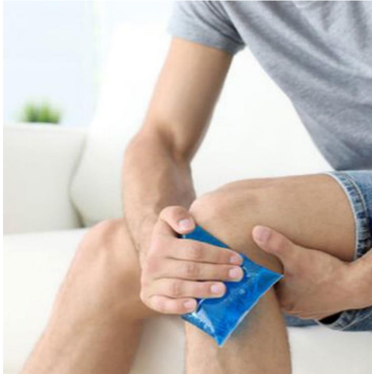
Slika 2. Krioterapija – terapija ledom

( https://arnicentar.com/krioterapija/ )