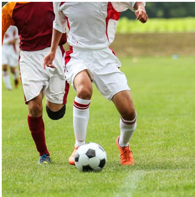
Slika 9. Vođenje nogometne igre

(https://www.supershopmarket.net/sportskaoprema/maestrox/)