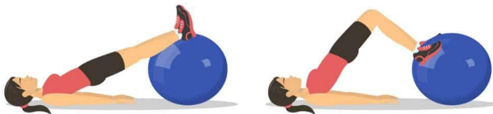
Slika 5. Most na pilates lopti