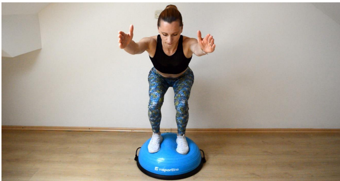
Slika 7. Čučanj na BOSU lopti

(https://www.fitness.com.hr/vjezbe/savjeti-za-vjezbanje/Vjezbe-na-bosu-lopti-za-pocetnike.aspx)