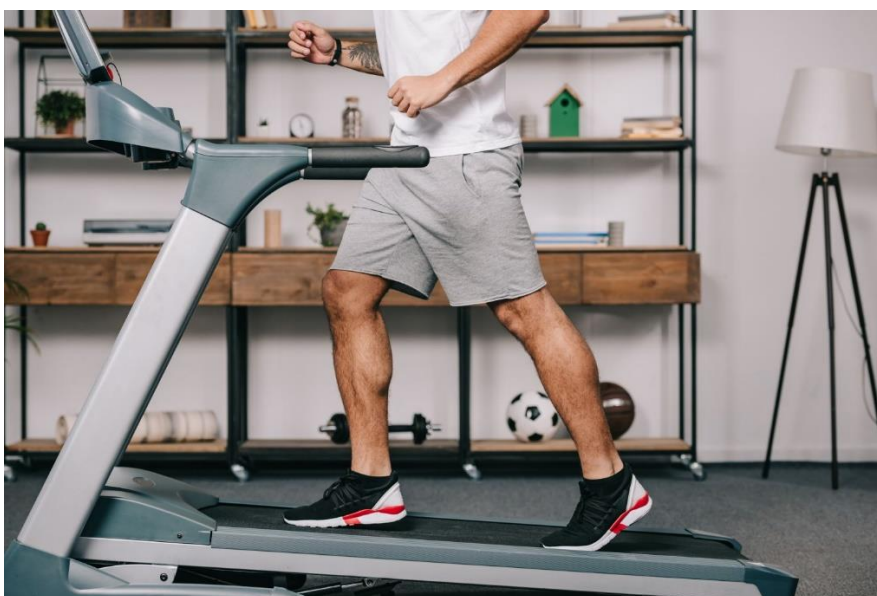
Slika 8. Trčanje na pokretnoj traci

https://www.fitness.com.hr/vjezbe/savjeti-za-vjezbanje/Vodic-za-kupovinu-traka-za-trcanje.aspx