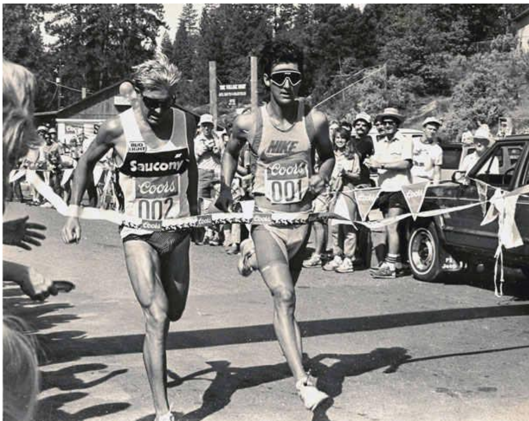
Slika 3. Fotografija s prvog natjecanja u San Diegu