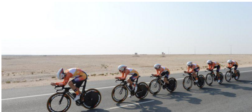
Slika4. Tipičan primjer “ draftinga .”

Cilj svakog natjecatelja u triatlonu je ušteda energije tijekom utrke kako bi si povećao šanse za dobar plasman. Jedan od načina je tzv. „ drafting “ tj. iskoristiti druge sportaše kako bi umanjili jednu varijablu koja utječe na uspješnost u triatlonu, a to je otpor vode u plivanju i zraka u biciklizmu, te nešto manje u trčanju (Brisswalter i Hauswirth, 2008).