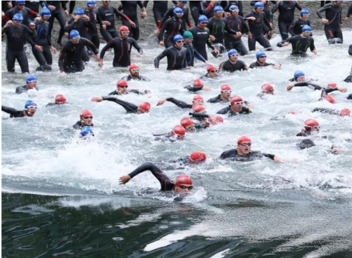
Slika 6. Start Ironman utrke

ušteda energije putem “ draftinga “ najbolje se primjeti u disciplini koja dolazi nakon plivanja, a to je biciklizam. Natjecatelji koji nisu plivali u skupini su imali manju efikasnost u disciplini biciklizam u prosjeku 4.8% (Delextrat i sur., 2003). Nadalje, vrhunski sportaši primjenjuju kod prve discipline u plivanju strategiju ubrzanog tempa na početku utrke, u usporedbi sa tempom tijekom cijelog prvog dijela plivanja koji je vrlo ujednačen. Razlog tomu je što svaki natjecatelj želi zauzeti dobru poziciju u skupini zbog „ draftinga “ i izravnije putanje (Vleck i sur., 2008).