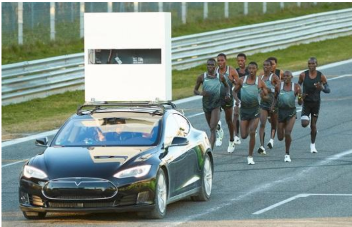
Slika5. Nike "sub2h" projekt (Monza, Italija)

Termin "drafting" ili "draftanje" označava vožnju neposredno iza natjecatelja koji se nalazi ispred kako bi se smanjio otpor zraka, a rezultat je manji utrošak. Točnije, procjenjuje se da se količina utrošene snage tada može smanjiti za 25% kako bi se održala ista brzina. Korist je veća što je veća brzina vožnje i što zavjetrina pokriva veću površinu. Koliko je zapravo zavjetrina važna, možemo vidjeti u dva pokušaja probijanja granica ljudskih mogućnosti u maratonu od 2 sata. Nike „sub2h project“ i „Ineos 1:59 Challenge“ su izabrali nekoliko sportaša, a jedan od njih je bio Eliud Kipchoge kojem je uspjelo (u umjetno napravljenim uvjetima utrke) otrčati 1:59:40. Jedan od faktora uspješnosti je bilo trčanje Kipchoge-a u zavjetrini svojih „pacer-a“ koji su formirali oblik strijele.