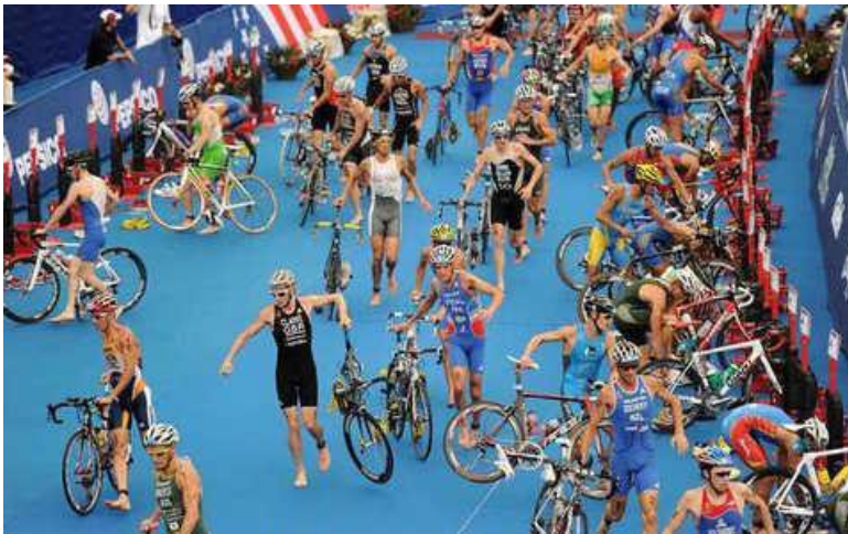
Slika 6. Tranzicija broj 2 (trčanje – biciklizam) u olimpijskom trijatonu

ušteda energije tijekom bicikliranja pozitivno utječe na rezultat u trčanju. U triatlonu se bitno razlikuje tempiranje zasebne discipline i disciplina povezanih u kontinuitetu. Možemo primjetiti da u triatlonu ne vidimo ubrzanje (sprint) u finalnom dijelu utrke i u plivanju i biciklu, no u trčanju nema razlike u tempiranju naspram discipline trčanja zasebno, te vidimo bitno ubrzanje tempa trčanja (Taylor, Smith, i Vleck, 2013).