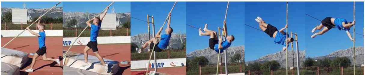
Slika 30. Cijeli skok s ravnom motkom

Nakon prethodnih vježbi slijedi posljednja vježba s ravnom motkom, a to je puni skok ili okret s/bez letvice. Kod ove vježbe motkaš koristi zalet od četiri ili šest koraka, nakon odraza slijedi "split" te položaj gnijezda uz čega se nogama ide vertikalno preko letvice. Za uspješnu izvedbu skoka potrebno je izvesti visok odraz u vertikalu te brzo odraditi ostatak skoka. Pritom se motkaš manje oslanja na motku, nego kod skoka sa savijanjem motke. Cilj vježbe je preskočiti što veću visinu uz uspješnu izvedbu skoka. Treba napomenuti i da ove vježbe pospješuju motkaševu kontrolu nad svojim tijekom i motkom tijekom skoka te se koriste i za poboljšanje "planta" (dio zaleta u kojem se motka postavlja u kutiju) kod motkaša.