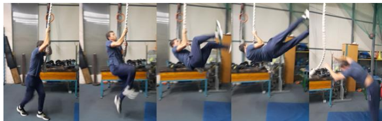
Slika 14. Okret iz mjesta na konopcu

Prva vježba koji nije klasičan gimnastički element je simulacija okreta uz pomoć konopca umjesto motke. Ispred konopca potrebno je staviti strunjaču za sigurnost pri doskoku. Motkaš rukama hvata konopac te se odguruje odraznom nogom skočivši u vis. Povlači noge u položaj gnijezda (noge su zgrčene u razini prsiju) i zatim slijedi brzi okret i doskok na strunjaču. Osim simulacije okreta, u ovoj vježbi naglasak je i na poboljšanju ritma i brzine okreta. Kada motkaš dobro uscoji ovu vježbu može se dodati i mala letvica na određenoj visini koju će motkaš tijekom okreta preskočiti.