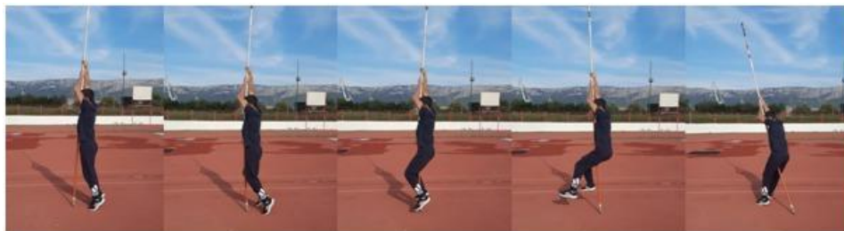
Slika 8. Balans na motci

Motka je postavljena vertikalno na tlo te se motkaš podiže na prste, trupom uz motku i pruženim rukama hvata motku u najvišoj mogućoj točki. Gornja desna ruka i donja lijeva ruka tvore uzak hvat, šake su jedna uz drugu. Iz te pozicije motkaš se odraznom nogom lagano odguruje od tla te ostaje visjeti na motci s lagano savijenim nogama i rukama. Cilj vježbe je održati balans na motci što je duže moguće. Ovom vježbom motkaš dobiva osjećaj držanja motke, oslanjanja i višenja na njoj. Vježba se ponavlja nekoliko puta.