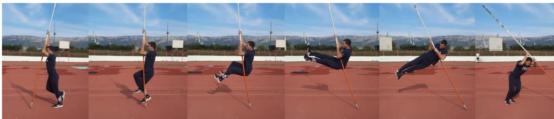
Slika 11. Okret s tla

Kod ove vježbe preporuča se povlačenje rukama kako bi se noge i kukovi podigli do optimalne pozicije za okret. Svrha vježbe je stvaranje osjećaja za okret i savladavanje samog okreta.