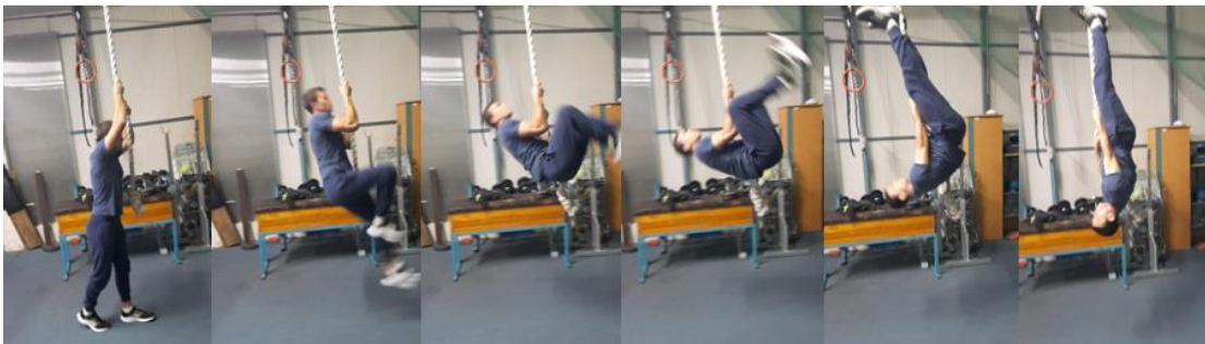
Slika 18. Faza zamaha na konopcu iz mjesta

Ova vježba koristi se u obučavanju početnika kako bi se dobio osjećaj za ekstenziju i višenje naglavačke. Također može i biti dio kondicijskog treninga za jačanje trbušnih mišića. Motkaš se stojeći uhvati za konopac te se odrazi u vis, istovremeno povlačeći rukama preko položaja gnijezda te podiže noge u vis do položaj ekstenzije. Od gnijezda do ekstenzije noge se podižu uz konopac.