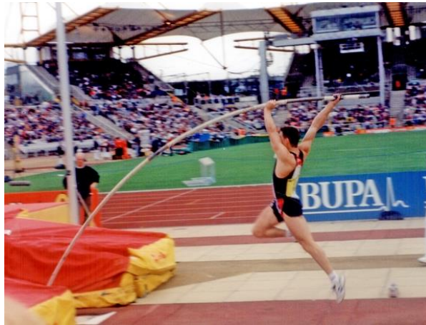
Slika 5. Motkaš u fazi odraza

muškarce te između 18 i 20 stupnjeva za žene. Premali odrazni kut može dovesti do pucanja motke.