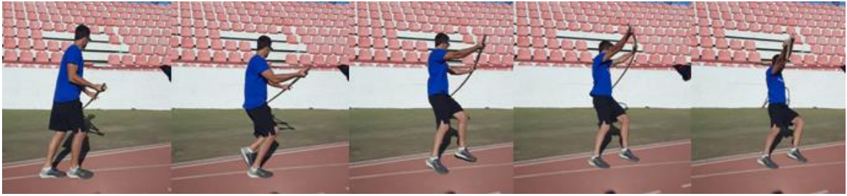
Slika 28. Bočno savijanje motke uza zid