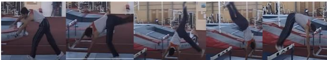
Slika 21. Rondat preko letvice