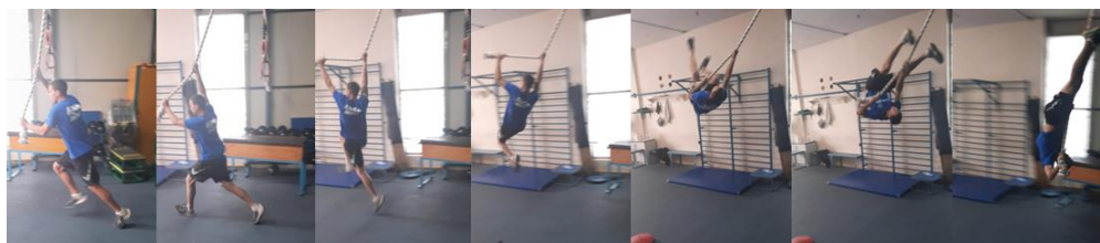
Slika 22. Simulacija savijanja motke na konopcu.

Kompleksnim gimnastičkim vježbama pripada i ova vježba. Motkaš koristi kratki zalet (skip ili nekoliko koraka) te se odrazi prema naprijed i u vis pritom držeći desnu gornju ruku potpuno pruženom, a lijeva donja ruka lagano je savijena. Cilj vježbe je zadržati poziciju gornje ruke, a donjom rukom gurati konopac kao što se gura motka tijekom savijanja. Iza toga slijedi simulacija faze zamaha koja je opisana u prethodnim vježbama. Također u ovoj vježbi se simulira visok i snažan odraz te se poboljšava kontrola motke u skoku. Ovu vježbu rade napredniji motkaši jer početnici ne koriste savijanje motke donjom lijevom rukom.