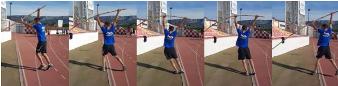
Slika 27. Savijanje motke uza zid

Za ovu vježbu koriste se mekane i srednje mekane motke. Radi se s početnicima s ciljem dobivanja osjećaja za savijanje motke te je napredniji motkaši rade ka dio zagrijavanja prije skakanja. U početnoj poziciji vrh motke nalazi se uza zid, a motkaš drži motku pri vrhu iznad glave sa širokim hvatom. Zatim se odguruje nogama ulazeći bočno pod motku te je savija objema ispruženim rukama. Lijeva donja ruka gura motku prema gore dok desna gornja ruka zajedno s desnom stranom tijela povlači motku prema dolje. U trenutku maksimalnog savijanja motkaš se kratko zadrži u toj poziciji nakon čega se motka počne vraćati u prvobitno stanje odgurujući motkaša u početni položaj. Vježba se ponavlja desetak puta.