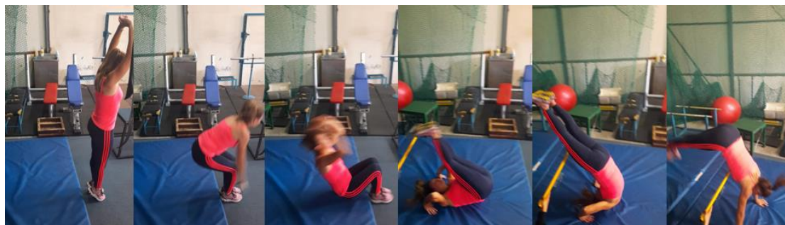
Slika 20. Kolut natrag do stoja

Kolut natrag do stoja preko letvice jedna je od kompleksnijih gimnastičkih vježbi koju rade napredniji motkaši kako bi poboljšali poziciju tijela tijekom prelaska preko letvice. Vježba se izvodi tako da trener ili kolega atletičar pridrži letvicu na određenoj visini dok motkaš na strunjači radi kolut natrag. U trenutku kada slijedi ispucavanje nogu u stoj, motkaš ide nogama preko letvice prelazeći je u sklonjenom položaju tijela iliti položaju slova "U". Nakon prelaska motkaš se dočeka na noge te se letvica podiže ovisno o uspješnosti prelaska.