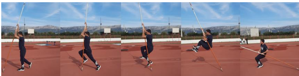
Slika 10. Povlačenje nogu do prsiju

Za ovu vježbu motkaš uzima niži hvat, odguruje se odraznom nogom od tla i dolazi u "split". Zatim se povlači rukama te podiže obje noge s desne strane motke (koje su zgrčene) do prsiju, prolazi vertikalnu i doskače na tlo. Cilj ove vježbe je podići noge do prsiju kako bi se došlo u povoljnu poziciju za okret o kojem će se više govoriti u sljedećoj vježbi.