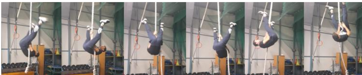
Slika 23. Naopako penjanje

Naopako penjanje na konopcu prvenstveno služi za oslobađanje od straha. Motkaš se penje na način da kada pomiče ruku prema gore istovremeno naoravi zamah nogama do pola ekstenzije. Ova vježba specifična je za skok s motkom jer ovakav položaj i način penjanja simulira poziciju gnijezda i početak ispružanja tijela.