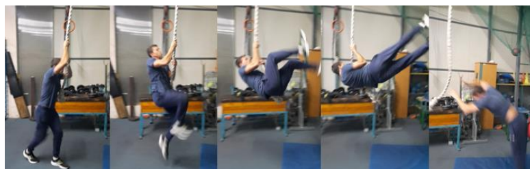
Slika 14. Okret iz mjesta na konopcu

Prva vježba koji nije klasičan gimnastički element je simulacija okreta uz pomoć konopca umjesto motke. Ispred konopca potrebno je staviti strunjaču za sigurnost pri doskoku. Motkaš rukama hvata konopac te se odguruje odraznom nogom skočivši u vis. Povlači noge u položaj gnijezda (noge su zgrčene u razini prsiju) i zatim slijedi brzi okret i doskok na strunjaču. Osim simulacije okreta, u ovoj vježbi naglasak je i na poboljšanju ritma i brzine okreta. Kada motkaš dobro uscoji ovu vježbu može se dodati i mala letvica na određenoj visini koju će motkaš tijekom okreta preskočiti.