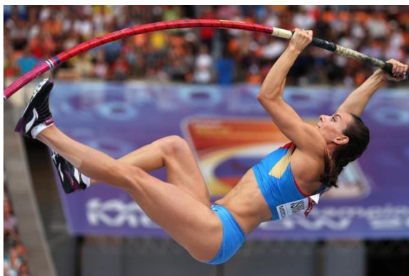
Slika 6. Zamah ispruženom zamašnom nogom