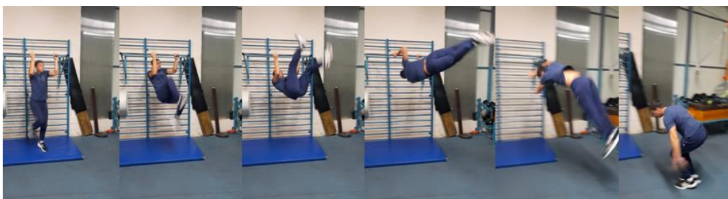
Slika 15. Okret iz mjesta pomoću pritke.

Prethodna vježba može se izvoditi i uz pomoć pritke koja se postavi u razini motkaševe visine. Pokret koji se izvodi jednak je kao i u prethodnoj vježbi s time da je pritka stabilniji oslonac te motkaš može više podići kukove. Također može se postaviti mala letvica koju motkaš preskače u fazi okreta. Svrha vježbe je dobivanje osjećaja za okret i brzinu okreta.