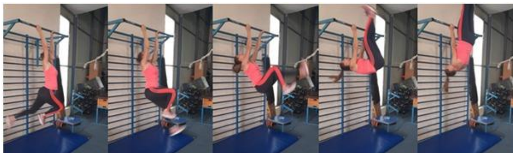
Slika 17. Faza zamaha na pritci

Osim za obučavanje i korekciju, ova vježba se najčešće koristi i tijekom kondicijskog treninga. Svrha vježbe je simulacija faze zamaha u skoku s motkom, dobivanje osjećaja za ispužanje uz motku (u ovom slučaju pritku) te jačanje trbušnih mišića i mišića podizača. Vježba se izvodi tako da motkaš visi na pritci u poziciji "splita", lagano zamahuje prema natrag te podiže noge do pozicije "svijeće" pritom prolazeći nogama uz pritku. Vježba se ponavlja dvije do tri serije po deset ponavljanja.