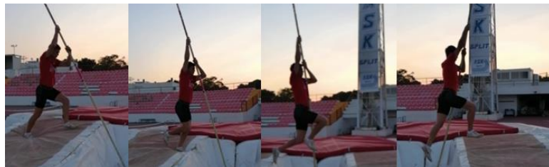
Slika 12. "Split" na motci

Nakon što je motkaš savladao prethodne vježbe prelazi se na strunjače. Motka se postavlja u kutiju te motkaš ponavlja vježbe 2,3 i 4 prelazeći s jedne na drugu stranu strunjače. Ove vježbe služe za oslobađanje od straha, navikavanje na snažniji odraz i povećanje kontrole nad motkom.