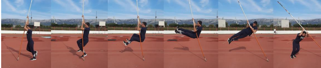
Slika 11. Okret s tla

Kod ove vježbe preporuča se povlačenje rukama kako bi se noge i kukovi podigli do optimalne pozicije za okret. Svrha vježbe je stvaranje osjećaja za okret i savladavanje samog okreta.