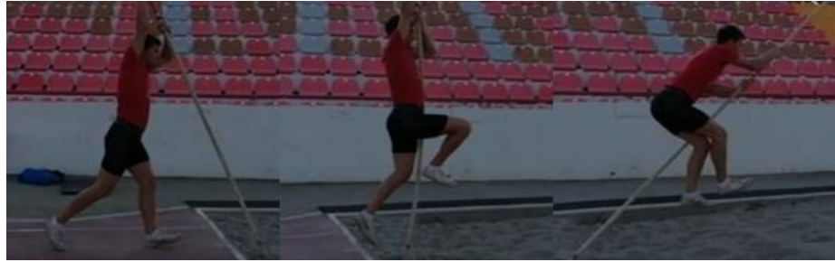
Slika 13. "Split" na motci u jami za skok u dalj