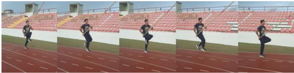
Slika 25. Visoki skip s motkom

Visoki skip s motkom je vježba koju rade i početnici i napredniji motkaši. Pomoću nje motkaši uče kakvo im treba biti držanje tijela tijekom zaleta s motkom. Kako bi održali to držanje, ova vježba se radi tijekom zagrijavanja prije skakanja s motkom. Ponavlja se četiri do pet serija po 20-30m. Kako je za zalet s motkom karakteristično veće podizanje koljena nego u sprintu, ova vježba se smatra odličnom za postizanje tog cilja.