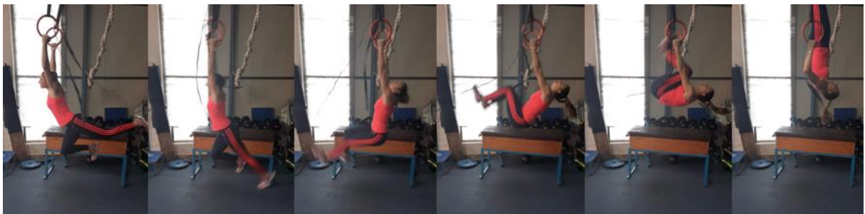
Slika 19. Faza zamaha na karikama

Još jedna od vježbi za poboljšanje faze zamaha je simulacija navedene faze na karikama. Motkaš visi na karikama u "splitu", zamahuje unatrag te dolazi do pozicije gnijezda. Iz te pozicije vertikalno ispucava noge istovremeno se povlačeći rukama prema gore. Vježba se osim za korekciju, koristi i u obučavanju kako bi se početnici naučili podizati kukove što više prema gore.