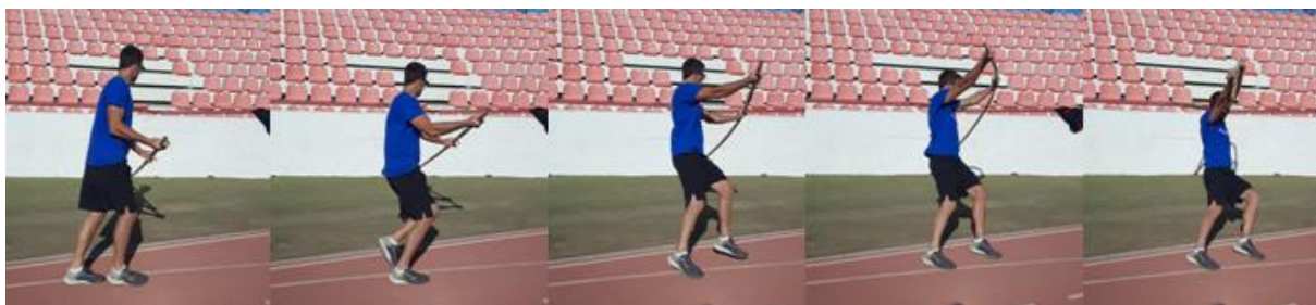
Slika 28. Bočno savijanje motke uza zid