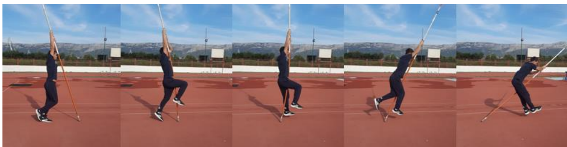
Slika 9. "Split" na motci

povlači s desne strane motke i doskače na tlo. Ova vježba simulira fazu nakon odraza te se nastoji postići kontrola tijela u "splitu". Vježba se ponavlja dok motkaš ne dobije potpunu kontrolu.