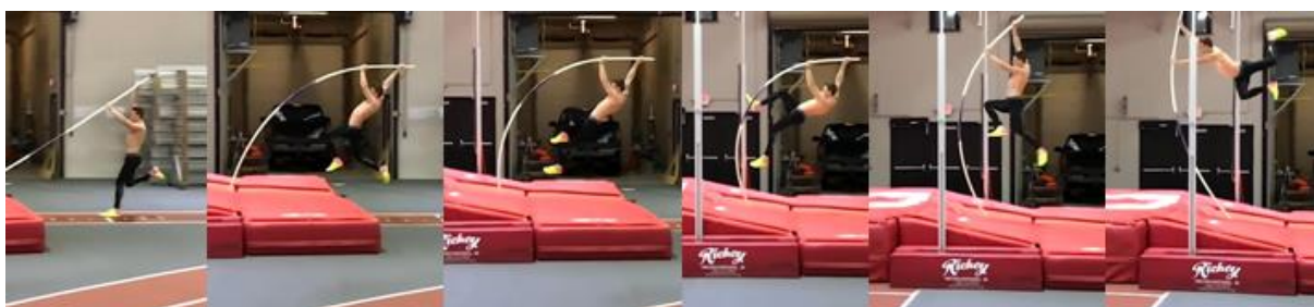
Slika 31. "Split" uz savijanje motke

Kod naprednijih motkaša koji su prošli fazu početnika počinje se učiti savijanje motke pomoću lijeve donje ruke. Najjednostavnija vježba za to je skok u poziciji "splita" gdje se tijekom skoka nastoji držati desnu gornju ruku potpuno pruženom dok je lijeva donja ruka lagano savijena i gura motku. Daskok je kao i uvijek na obe noge. U početku se ova vježba izvodi u jami za skok u dalj gdje se motkaš osjeća sigurnije te se poslije prelazi na strunjače.