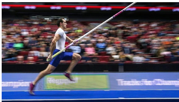
Slika 3. Motkaš u fazi zaleta

Ponajbolji skakači koriste tehniku spuštanja motke tijekom trčanja iz vertikalne do horizontalne pozicije. Time se u znatnoj mjeri smanjuju sile koje se stvaraju tijekom trčanja u fazi zaleta u horizontalnijoj poziciji. Postoji značajna korelacija između brzine u zadnjih 5 metara zaleta i očišćene visine letvice. Ovaj parametar je najvažnija odrednica uspjeha u skoku s motkom.