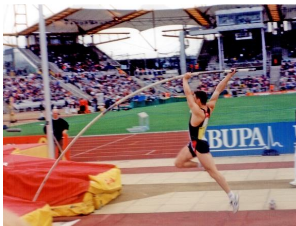
Slika 5. Motkaš u fazi odraza

muškarce te između 18 i 20 stupnjeva za žene. Premali odrazni kut može dovesti do pucanja motke.