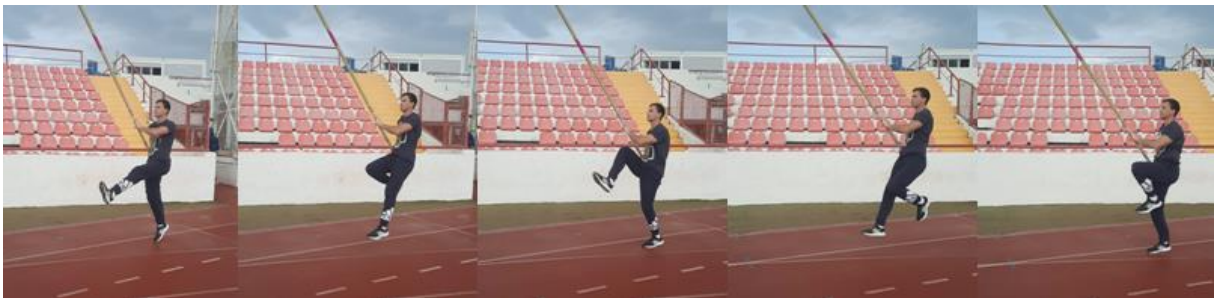
Slika 26. Galop ili grabeći korak s motkom

Kao i visoki skip, galop ili grabeći korak s motkom rade svi, od početnika do vrhunskih motkaša. Motka se drži skoro za vrh te je kao i kod skipa cilj držati tijelo uspravno i podizati koljeno visoko. Vježba se radi četiri do pet serija po 20-30m.