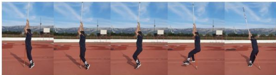
Slika 8. Balans na motci

Motka je postavljena vertikalno na tlo te se motkaš podiže na prste, trupom uz motku i pruženim rukama hvata motku u najvišoj mogućoj točki. Gornja desna ruka i donja lijeva ruka tvore uzak hvat, šake su jedna uz drugu. Iz te pozicije motkaš se odraznom nogom lagano odguruje od tla te ostaje visjeti na motci s lagano savijenim nogama i rukama. Cilj vježbe je održati balans na motci što je duže moguće. Ovom vježbom motkaš dobiva osjećaj držanja motke, oslanjanja i višenja na njoj. Vježba se ponavlja nekoliko puta.