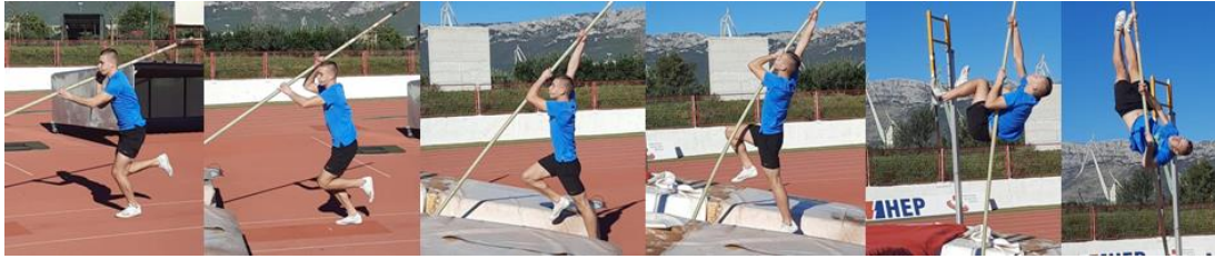
Slika 29. Faza zamaha s ravnom motkom