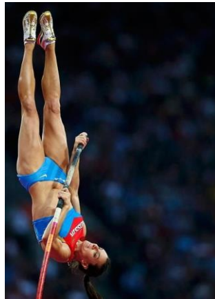
Slika 7. Ispružanje uz motku

Pomičući centar gravitacije ispred motke dok se motkaš ispruža nogama prema gore pomaže pri zaustavljanju rotacije motkaša unatrag. Noge i trup tada počinju padati i rotiraju se prema letvici. Kako bi se to izbjeglo motkaš treba ostati što je više moguće bliže motci ili iza nje dok se okreće, ispruža i rotira. Motkaš treba težiti tome da nadjača motku tj. da dođe u poziciju na vrh motke kako bi iskoristio povrat energije od motke. Izbor jačine motke i visine hvata utječe na sposobnost motkaša da nadjača motku.