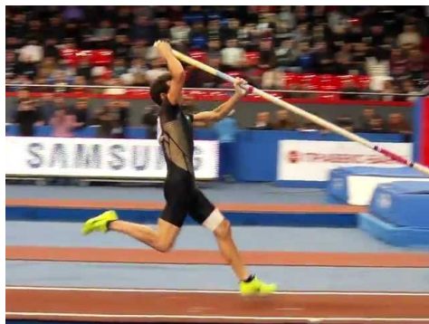
Slika 4. Motkaš u trenutku ubadanje motke u kutiju

Ubadanje motke u kutiju označava početak prijenosa energije od motkaša prema motci. Ako je motkaševo tijelo opušteno, energija koja se mogla prenijeti na motku može se izgubiti uslijed neelastičnog istezanja mišića i tetiva. Prevelika tenzija mišića trupa, ramemnog pojasa i ruku umanjiti će gubljenje energije. Pojavit će se neki pokreti u zglobu ramena, ali to može biti i djelotvorno ako rezultira u većoj kontrakciji ekstenzora ramena uslijed refleksnog odgovora istezanja ovih mišića.