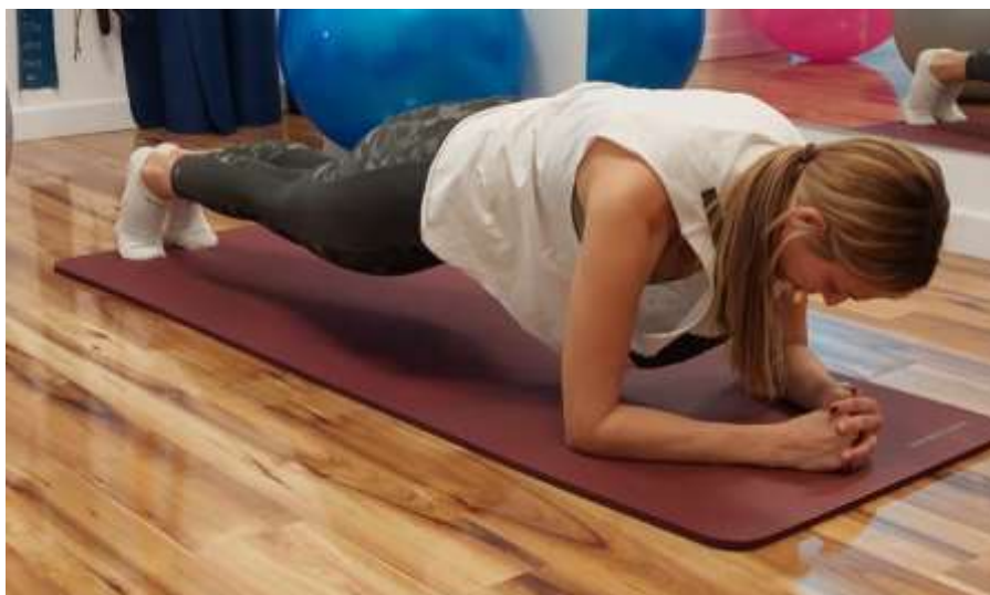
Slika 6: statička snaga trupa

Izdržaj u „plank-u“. Vježba se izvodi na podu, na način da se ispitanik oslanja samo na podlaktice i stopala, dok je cijelo tijelo ravno. Cilj je što duže zadržati pravilan položaj.