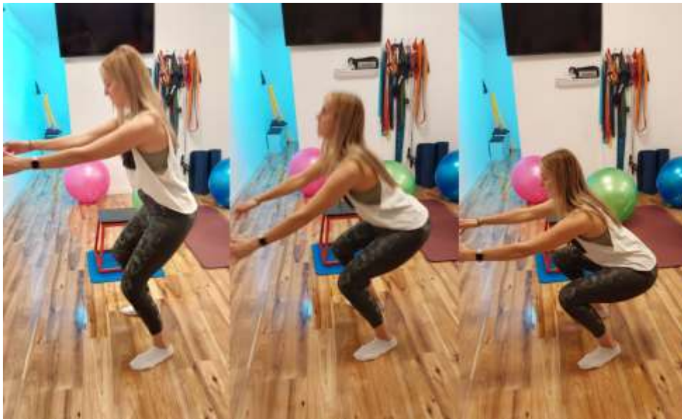
Slika 5: repetitivna snaga nogu

Čučnjevi u 60 sekundi. Vježba se izvodi na način da ispitanik drži noge u širini bokova, a broji se ponavljanje u kojem se ispitanik spusti u čučanj, do položaja sjeda. Cilj je napraviti što veći broj ponavljanja unutar 60 sekundi.