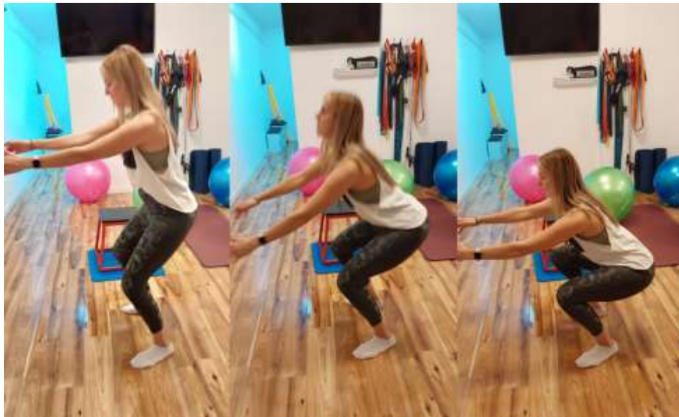
Slika 5: repetitivna snaga nogu

Čučnjevi u 60 sekundi. Vježba se izvodi na način da ispitanik drži noge u širini bokova, a broji se ponavljanje u kojem se ispitanik spusti u čučanj, do položaja sjeda. Cilj je napraviti što veći broj ponavljanja unutar 60 sekundi.