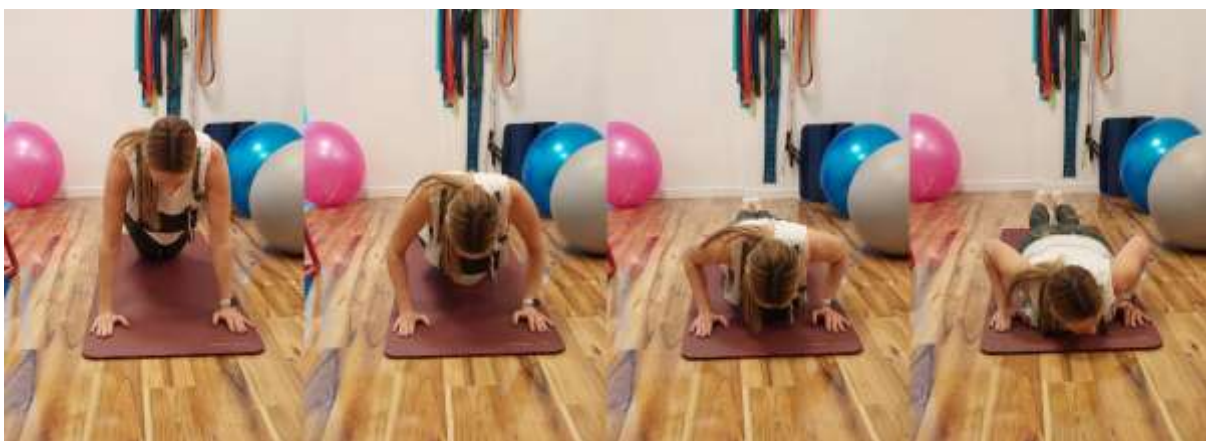
Slika 4: repetitivna snaga

Sklekovi u 60 sekundi. Vježba se izvodi s koljena, dlanovi su u širini ramena, a broji se ponavljanje u kojem ispitanik dotakne prsima pod. Cilj je napraviti što veći broj ponavljanja unutar 60 sekundi.