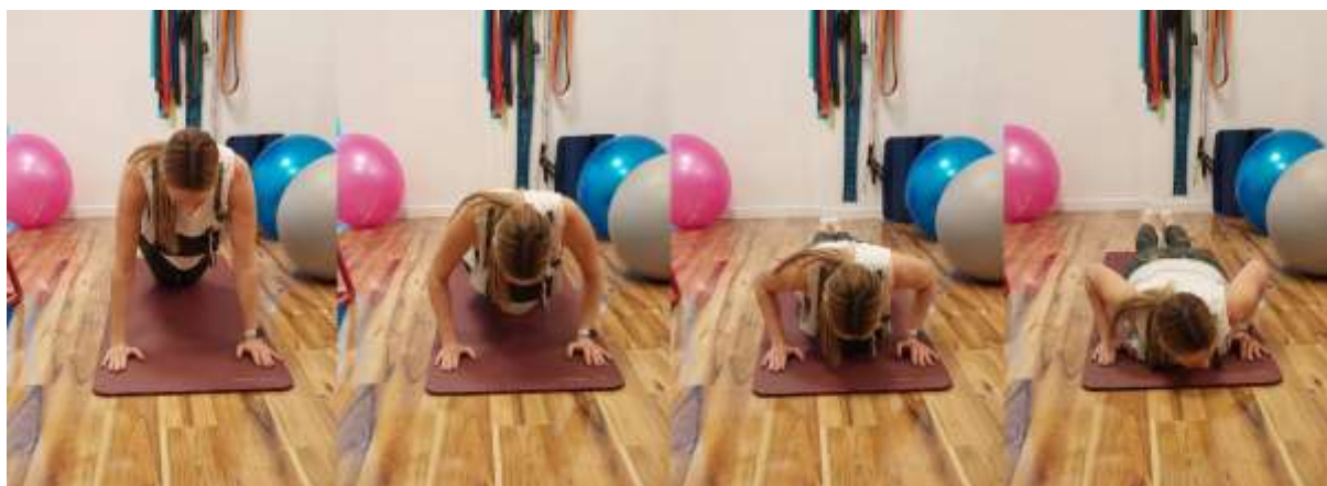
Slika 4: repetitivna snaga

Sklekovi u 60 sekundi. Vježba se izvodi s koljena, dlanovi su u širini ramena, a broji se ponavljanje u kojem ispitanik dotakne prsima pod. Cilj je napraviti što veći broj ponavljanja unutar 60 sekundi.