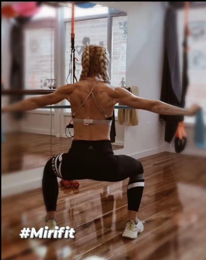
Slika 22 - Obrnuto letenje s elastičnom trakom