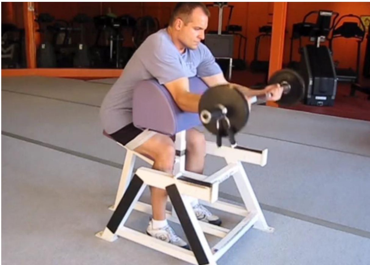
Slika 28 - Biceps pregib preko klupe