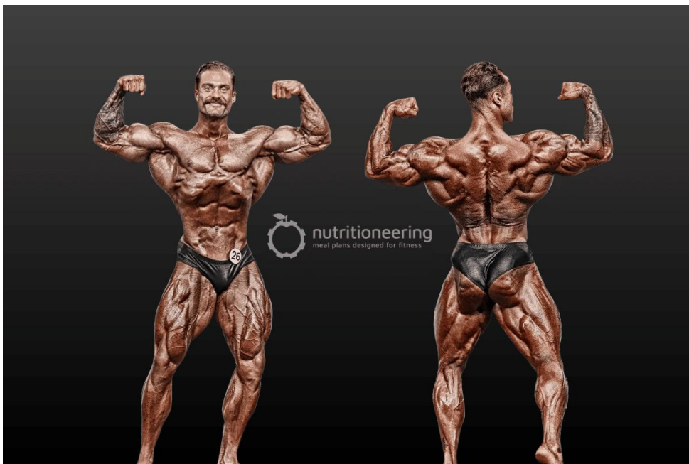
Slika 6 - Chris Bumstead