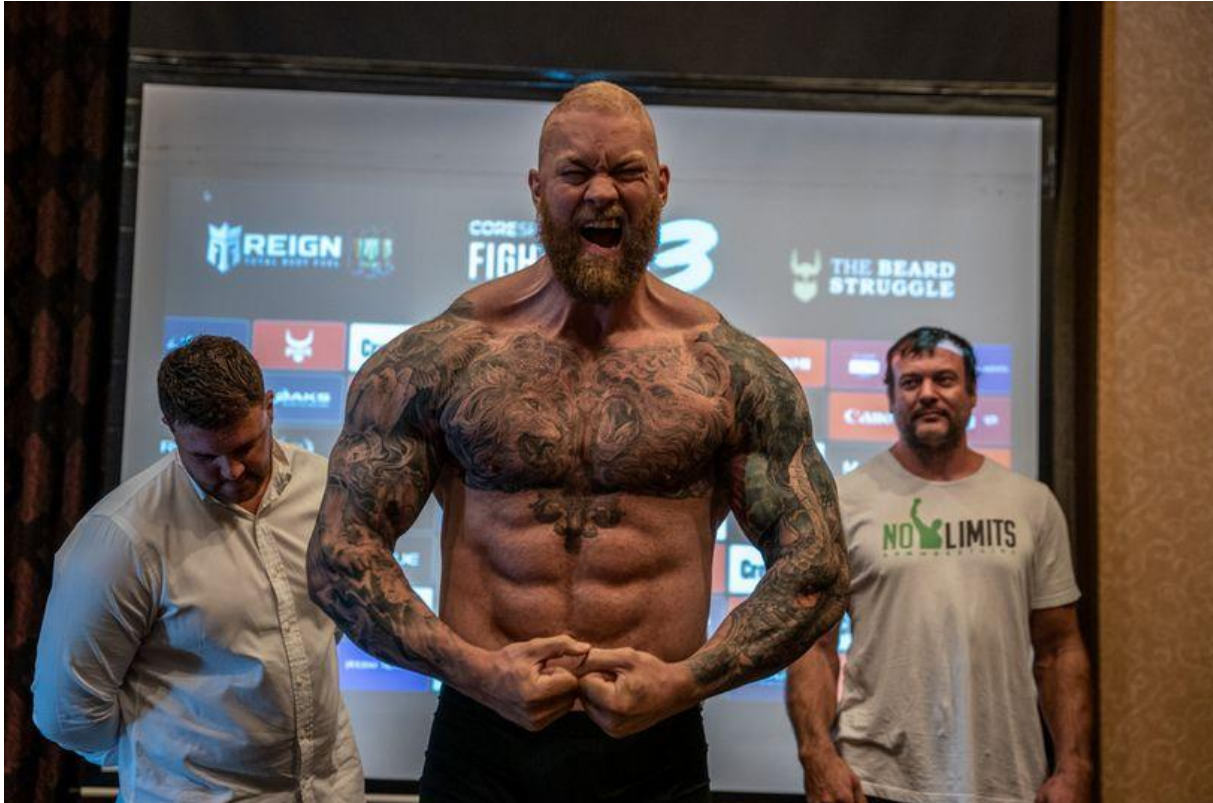
Slika 5 - Hafþór Júlíus Björnsson

Primjeri režima prehrane u različitim trenažnim fazama