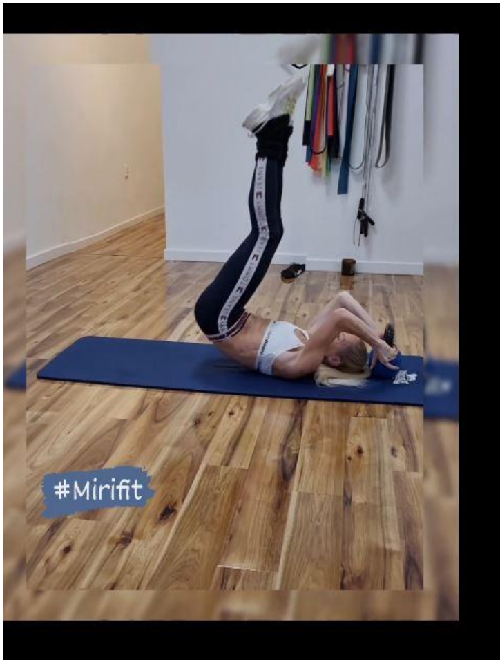
Slika 18 - Podizanje kukova u ležećem položaju

Sinergisti: Iliopsoas / Tensor fasciae latae / Sartorius / pectineus / Dugi aduktor / Adductor brevis / Rectus femoris / Obliques