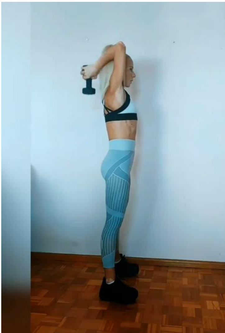
Slika 24 - Ekstenzija tricepsa bučicama, preuzeto s https://www.instagram.com/p/CTZB1mhAYSp/

Stabilizatori: Deltoid prednji / Pectoralis major / Clavicular / Fleksori zapešća