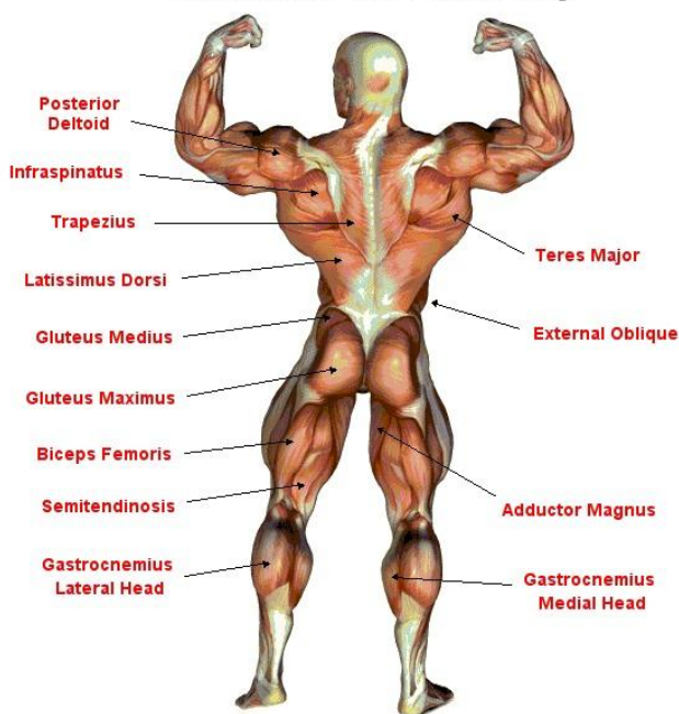
Slika 7 - Anatomija mišića