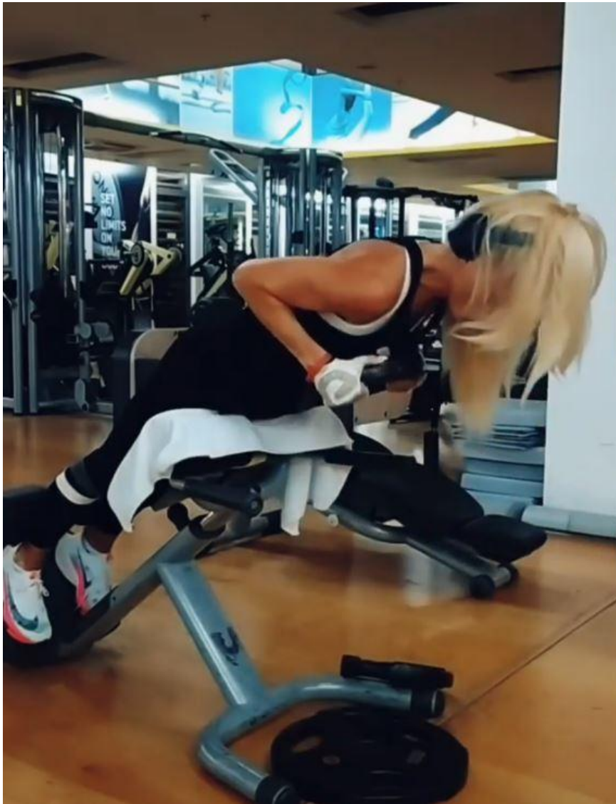
Slika 35 - Leđna ekstenzija s opterećenjem