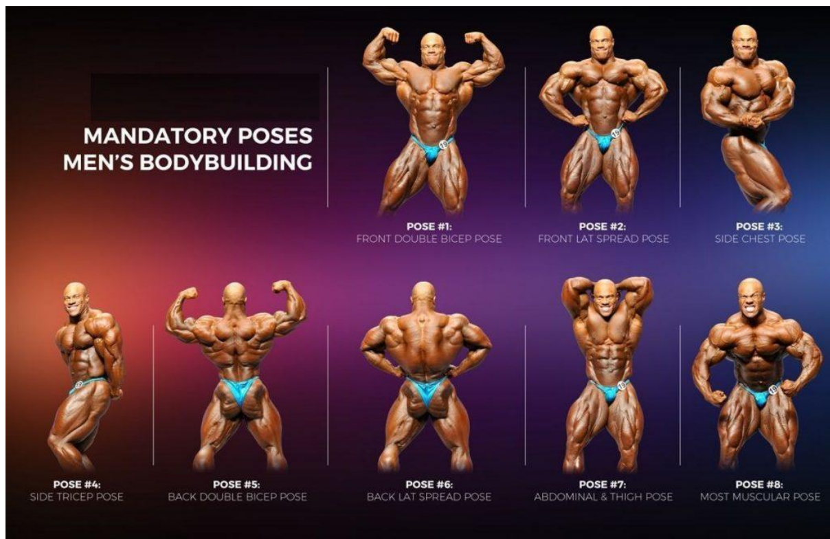
Slika 3 - Osnovne poze u bodybuildingu