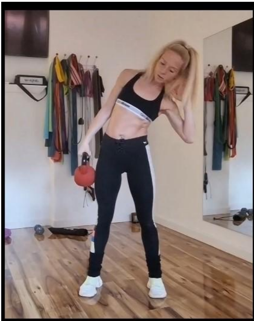
Slika 19 - Bočni pregib bučicom, preuzeto s https://www.instagram.com/p/CIOBLQ_gD0E/

Stabilizatori: Gluteus medius / Gluteus minimus