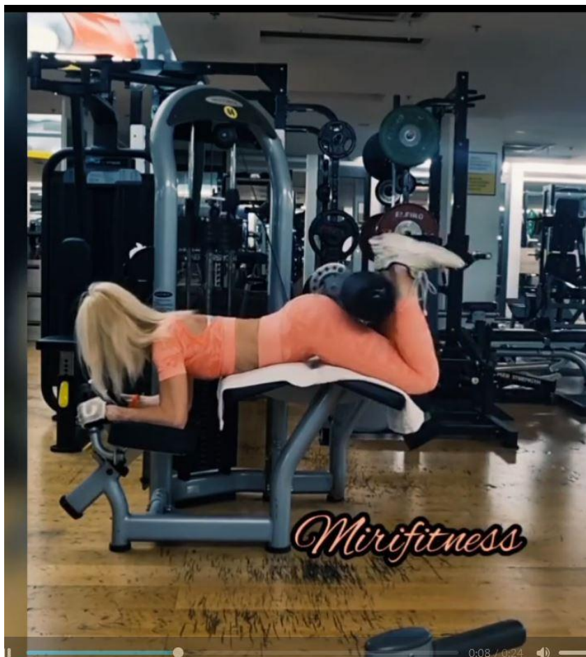
Slika 12 - Nožna fleksija

Antagonistički stabilizatori: Tibialis anterior / Rectus femoris