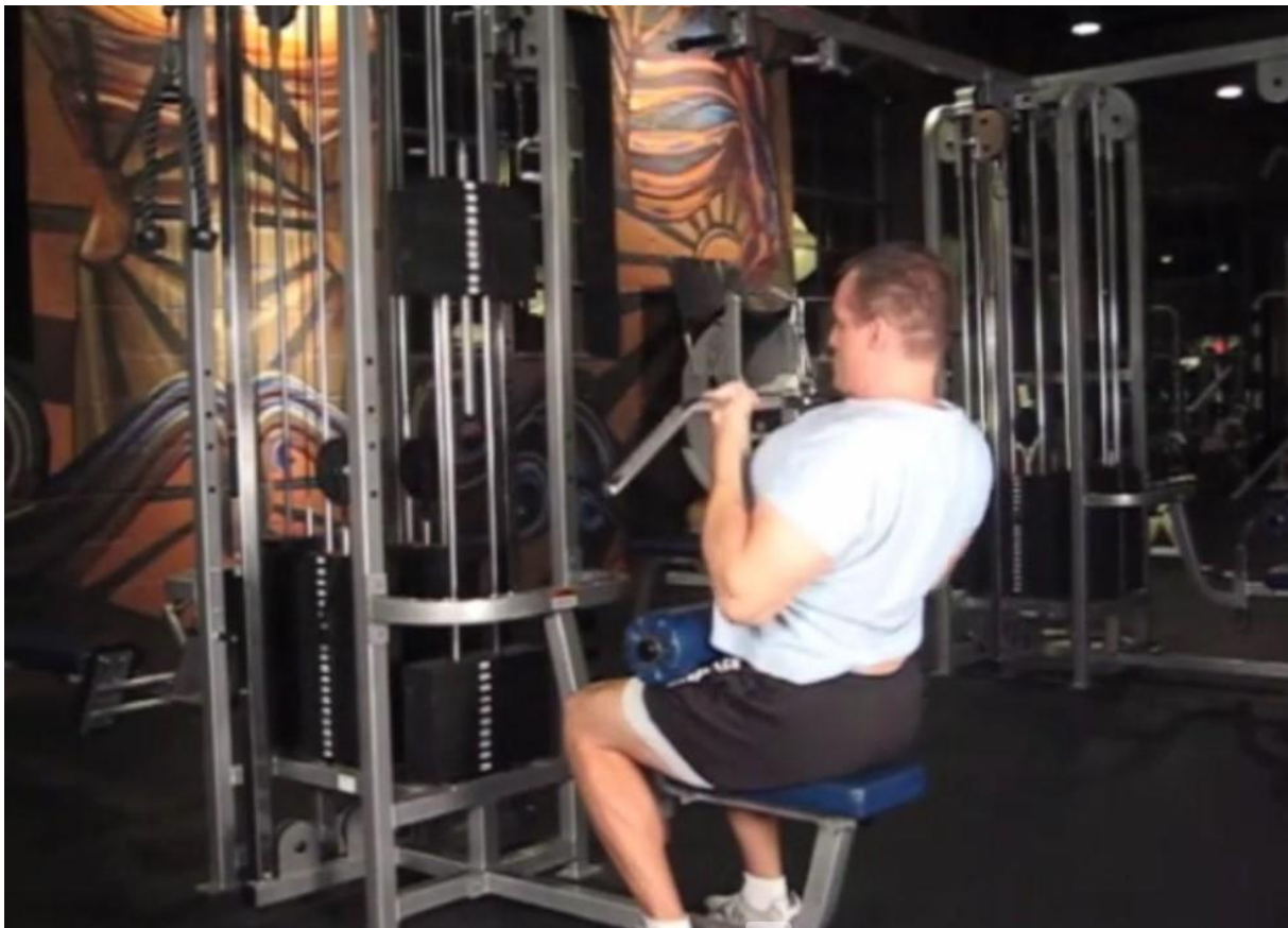
Slika 30 - Povlačenje na lat mašini širokim hvatom

Dinamički stabilizatori: Triceps duga glava