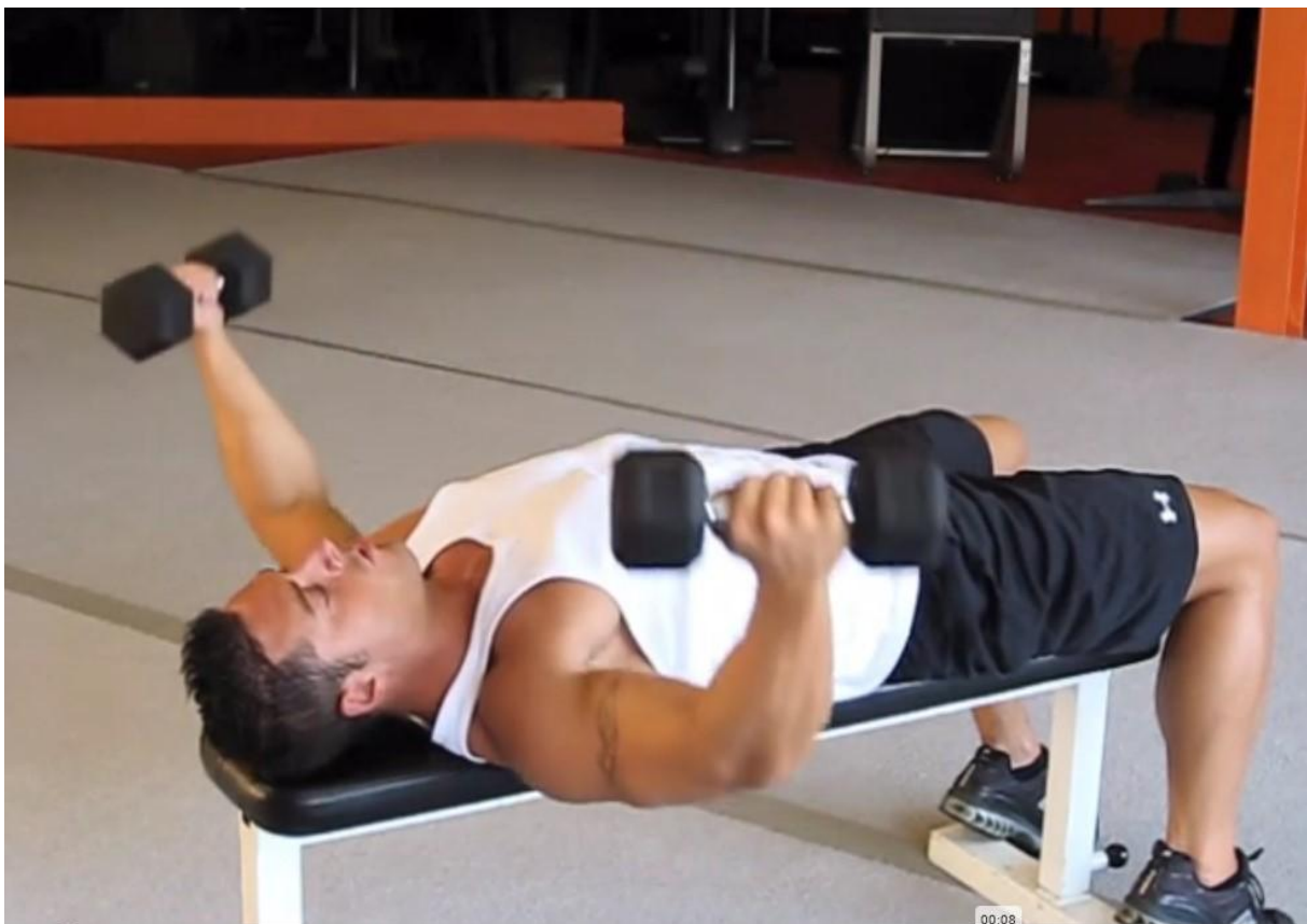
Slika 33 - Letenje bučicama

Stabilizatori: Biceps brahii / Brachialis / Triceps brachii / Fleksori zapešća