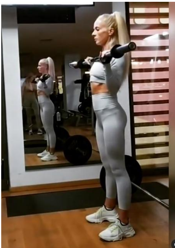
Slika 20 - Rameni potisak šipkom stojeći

Stabilizatori: Trapezius gornji / Levator scapulae