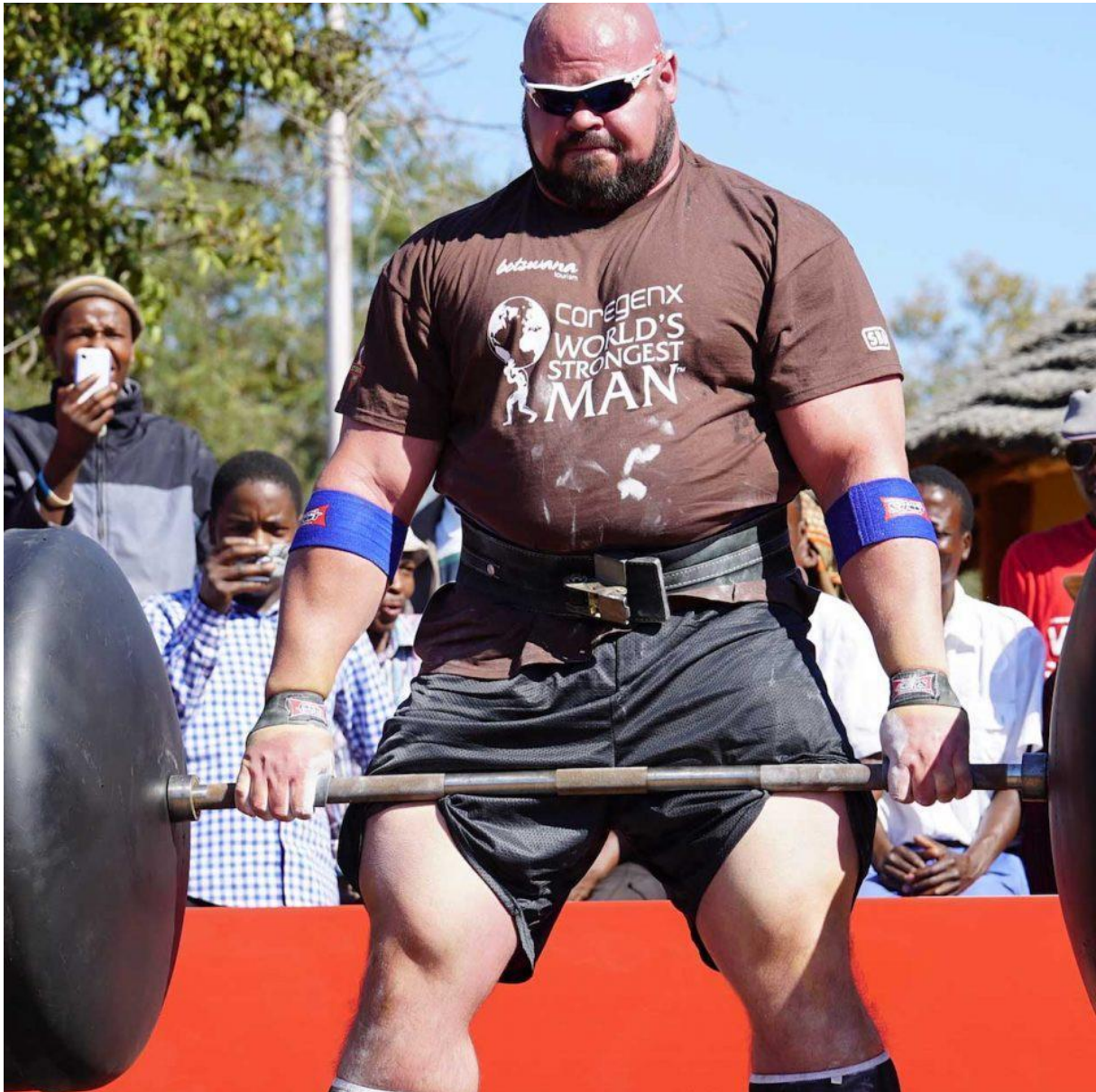
Slika 4 - Brian Shaw