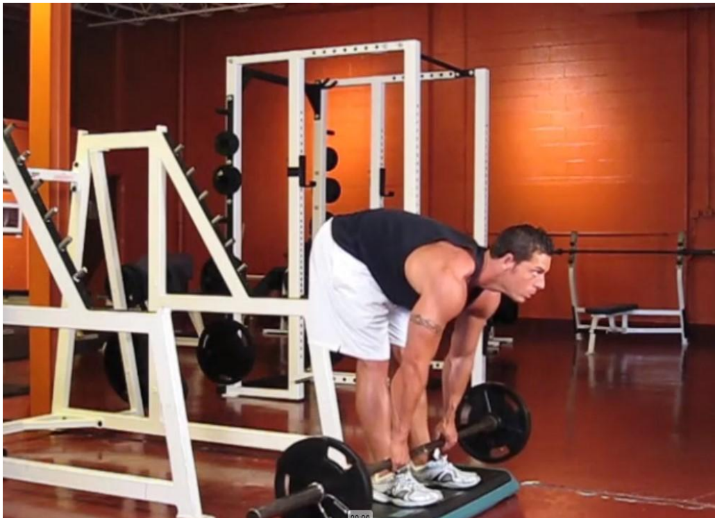
Slika 11 - Rumunjsko mrtvo dizanje, preuzeto s

Antagonistički stabilizatori: Rectus abdominis / Obliques