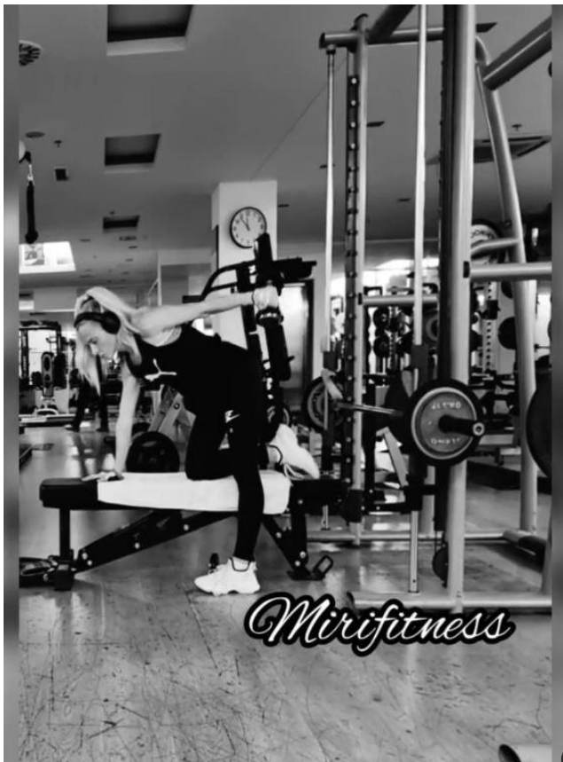
Slika 23 - Jednoručna ekstenzija bučicom, preuzeto s https://www.instagram.com/p/CeNrAUmMEJX/

Stabilizatori: Deltoid stražnji / Latissimus dorsi / Trapezius sredina / Trapezius donji / Romboidi / Ekstenzor carpi ulnaris / Fleksor carpi ulnaris