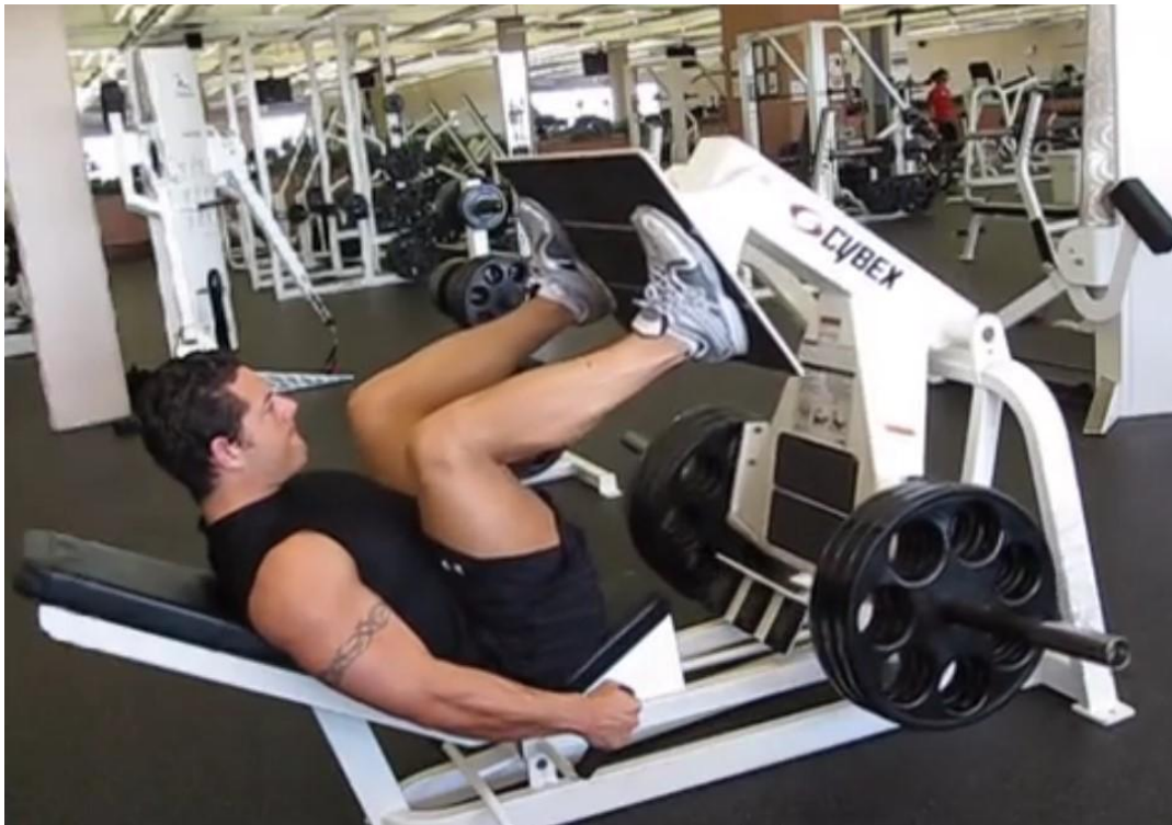
Slika 10 - lever 45° leg press, plate loaded, preuzeto s

Dinamični stabilizatori: tetive koljena / gastrocnemius