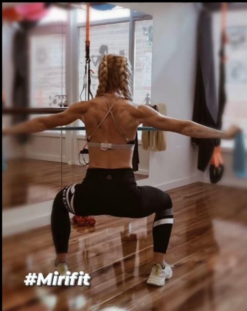
Slika 22 - Obrnuto letenje s elastičnom trakom