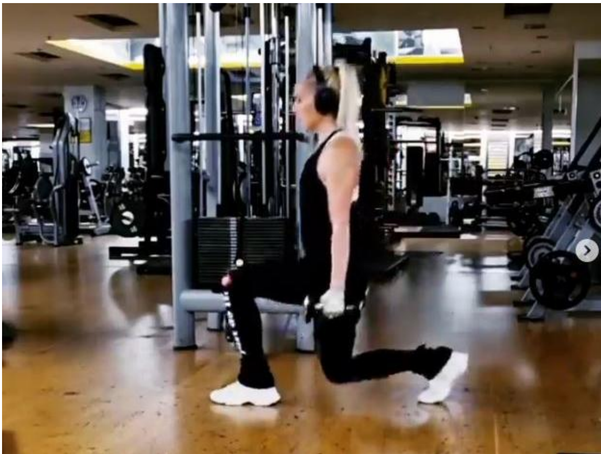
Slika 36 - Iskorak s bučicama

Stabilizatori: Erector spinae / Tibialis anterior / Gluteus medius / Gluteus minimus / Quadratus lumborum / Obliques