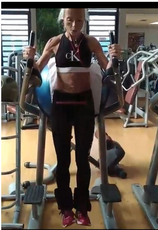
Slika 17 - Otežano okomito podizanje nogu i kukova