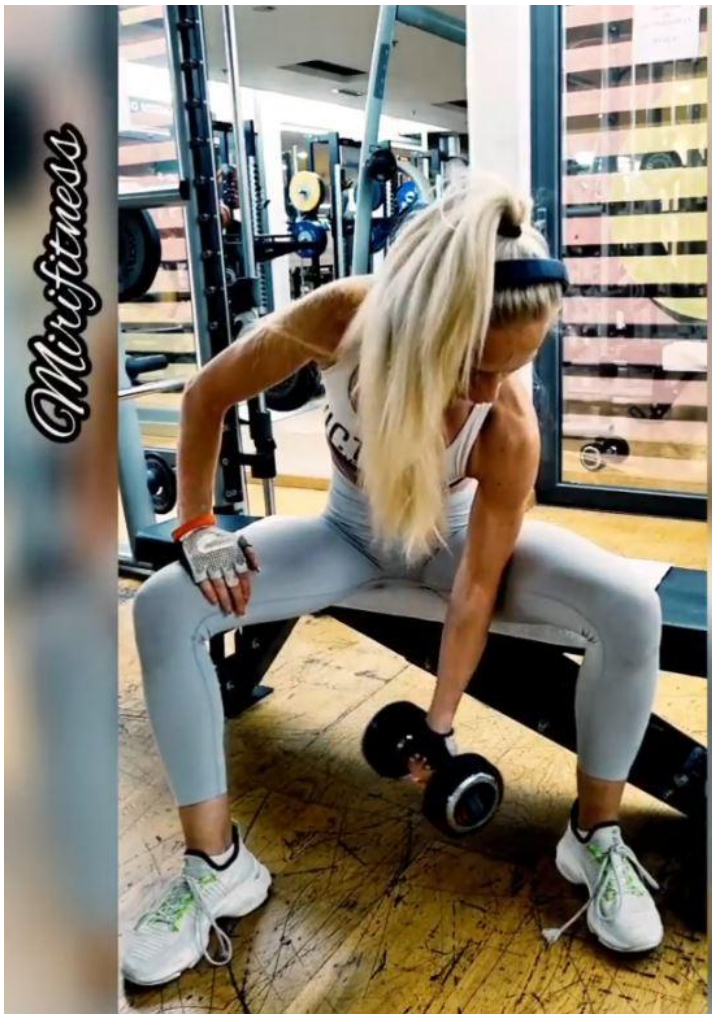
Slika 27 - Koncentracijski pregib bučicama

Stabilizatori: Trapezius gornji / Trapezius sredina / Levator scapulae / Obliques / Erector spinae / Fleksori zapešća