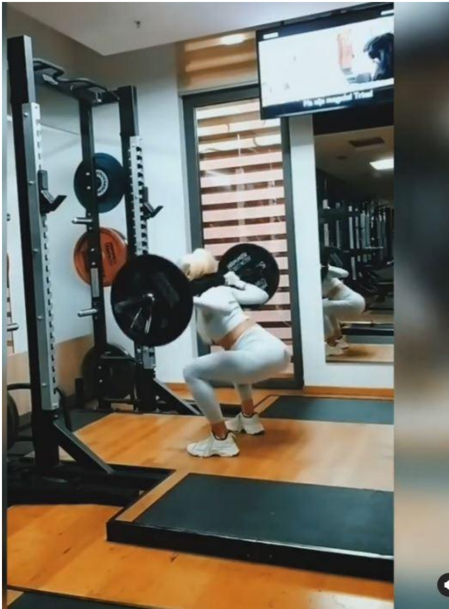
Slika 8 - Stražnji čučanj

Antagonistički stabilizatori: Rectus abdominis / Obliques