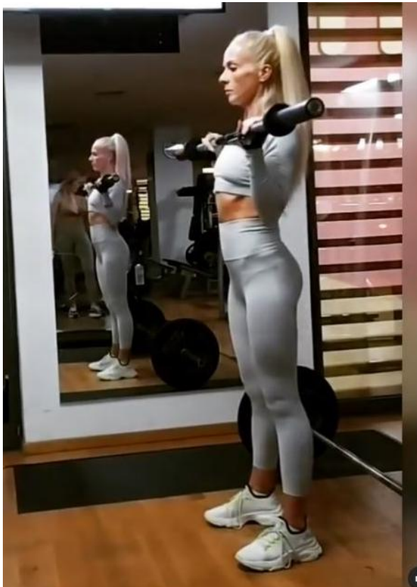
Slika 20 - Rameni potisak šipkom stojeći

Stabilizatori: Trapezius gornji / Levator scapulae