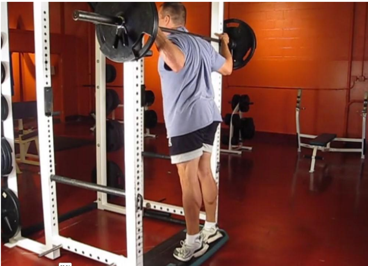
Slika 14 - Podizanje listova u stojećem položaju