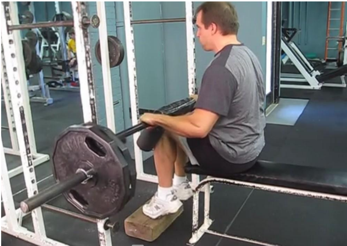
Slika 16 - Sjedeće podizanje listova