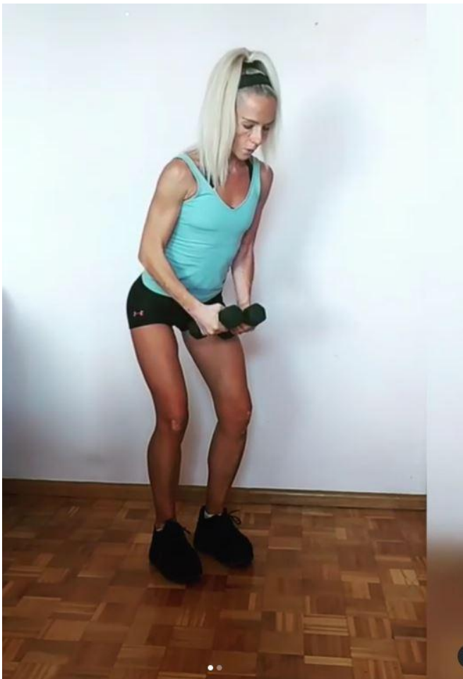
Slika 21 - Lateralno podizanje bučica, preuzeto s https://www.instagram.com/p/CSBiMm4s9Vc/

Stabilizatori: Trapezius gornji / Levator scapulae / Ekstenzori zapešća