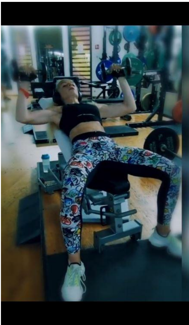
Slika 34 - Potisak bučicama na kosoj klupi

Dinamički stabilizatori: Biceps brahii kratka glava