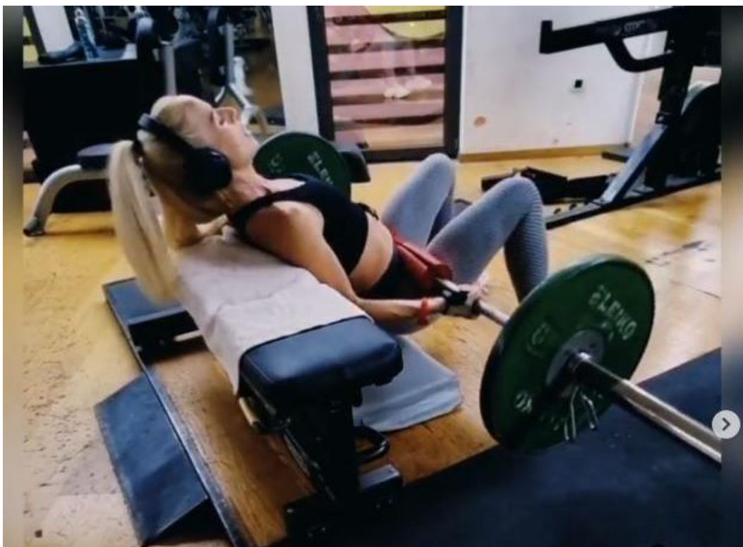
Slika 37 - Potisak šipke kukovima

Antagonistički stabilizatori: Rectus abdominis / obliques