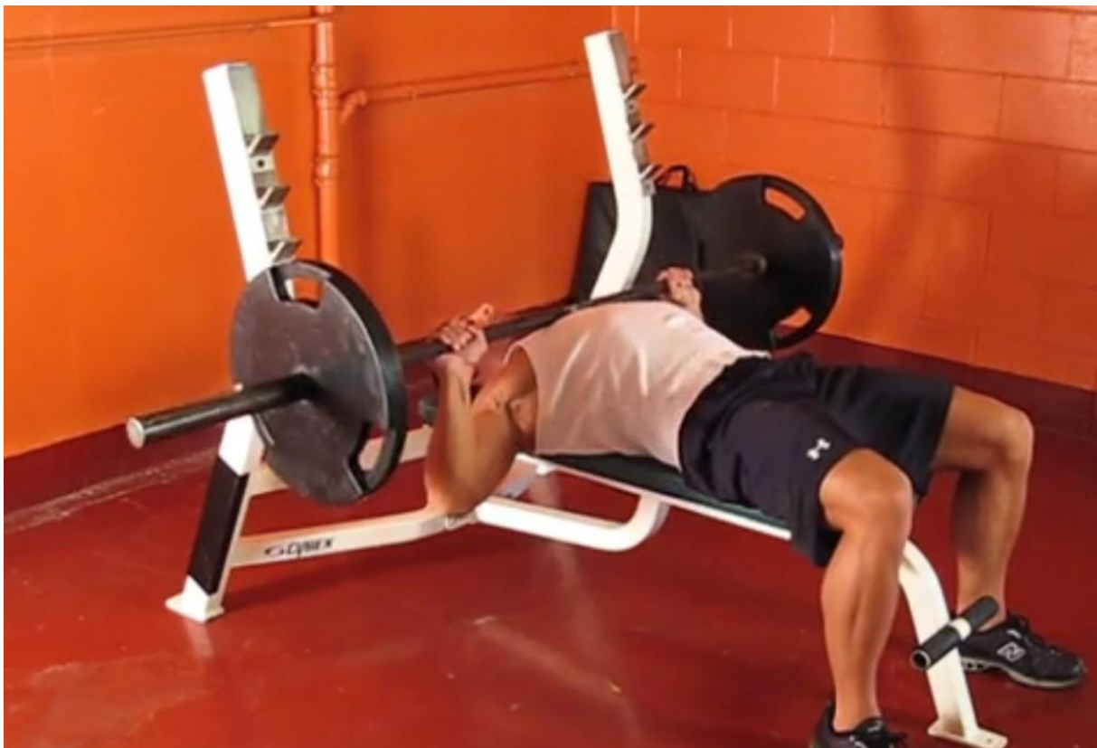
Slika 32 - Potisak šipke s klupe, preuzeto s

Stabilizatori: Erector spinae / Stražnji mišić maksimumus