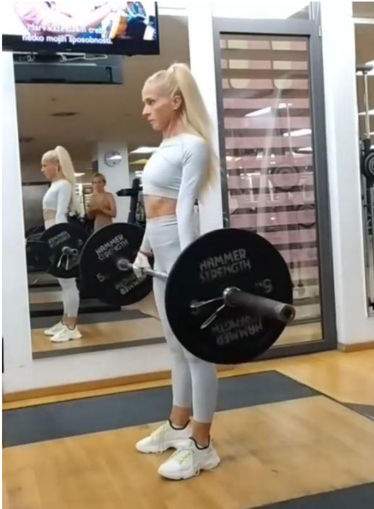
Slika 29 - Mrtvo dizanje utega