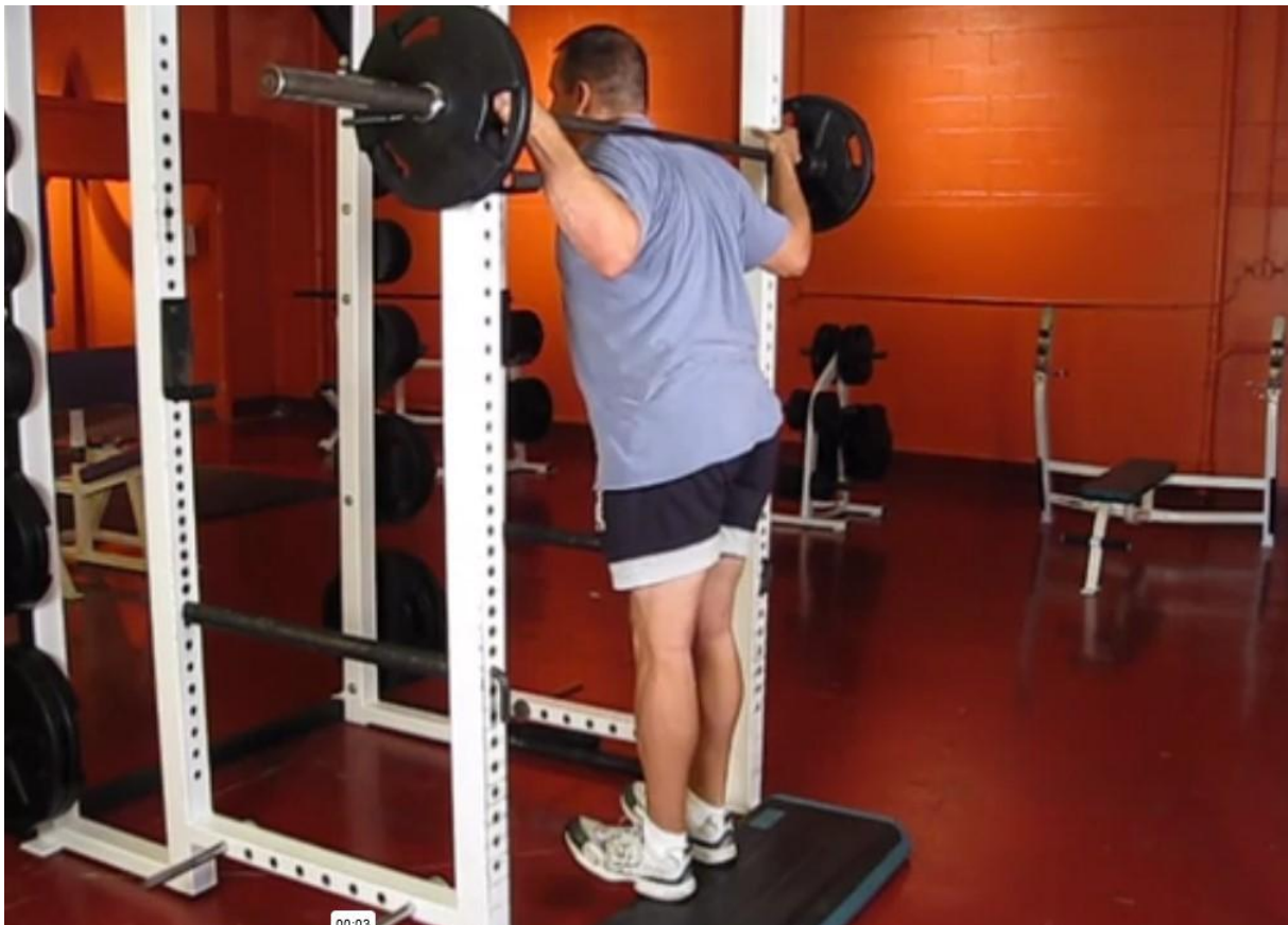
Slika 15 - Obrnuto podizanje listova