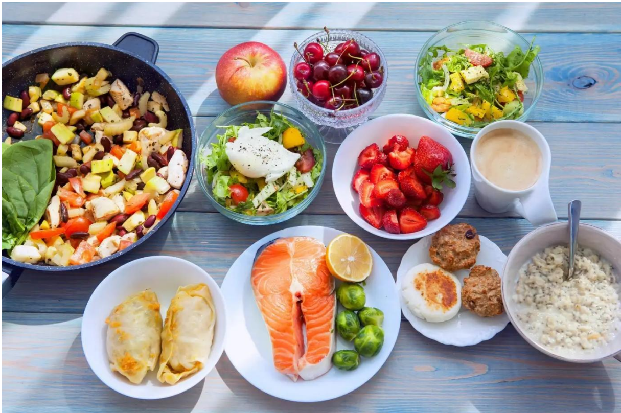
Slika 2 - Balansirana prehrana