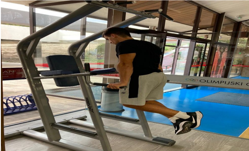
Slika 21. Izvođenje propadanja