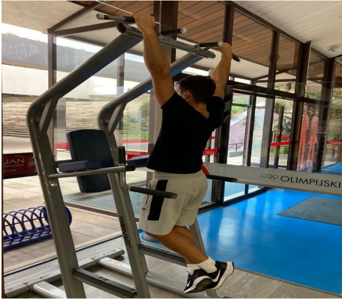
Slika 18. Izvođenje zgibova