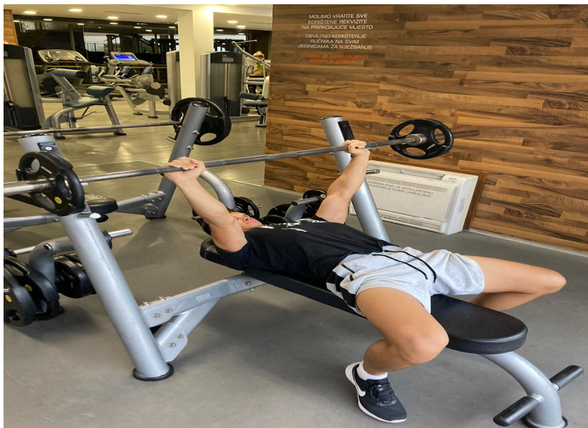
Slika 12. Izvođenje potiska na klupi