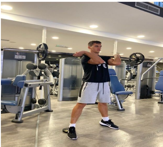
Slika 10. Izvođenje prednjeg čučnja