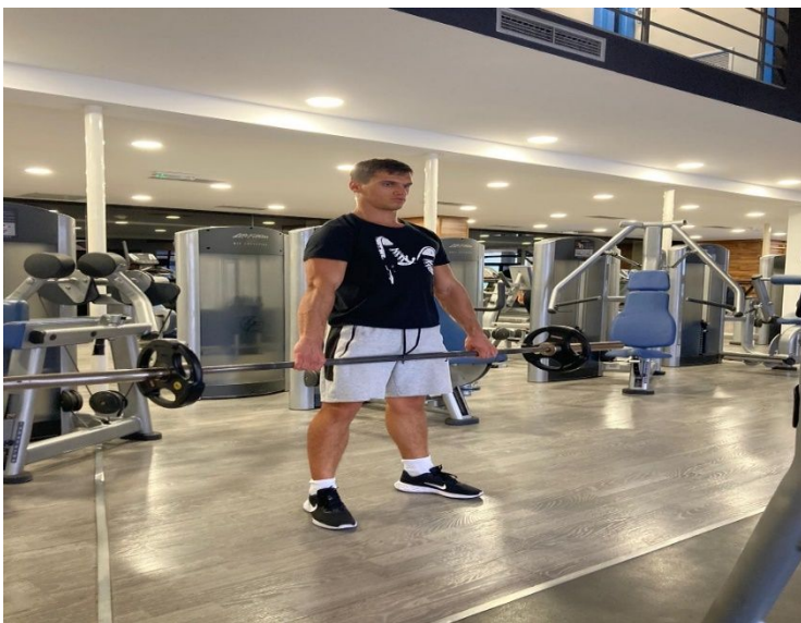
Slika 15. Izvođenje mrtvog dizanja

Jedna od najboljih vježbi s opterećenjem općenito, gotovo svi mišići su uključeni od gornjeg dijela leđa pa sve do listova. Poboljšava maksimalnu snagu i eksplozivnost te bitne mišićne skupine. Za dugoprugaše je najbolje raditi trap bar za mrtvo dizanje jer razvija specifične koje su bitne u plivanju. Kod izvođenja mrtvog dizanja je bitno izbaciti prsa van, kontrahirati lopatice te držati donja leđa u čvrstoj poziciji radi zaštite od ozljeda.