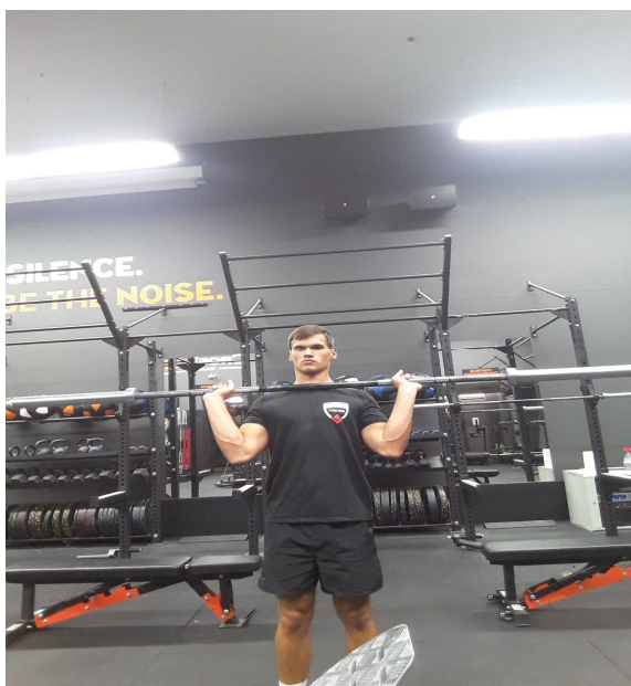
Slika 14. Izvođenje potiska iznad glave