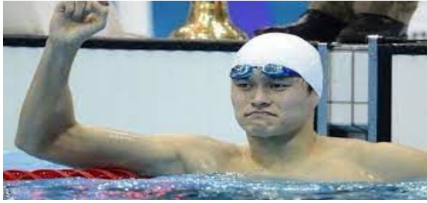
Slika 27. Sun Yang svjetski rekord na 1500 m