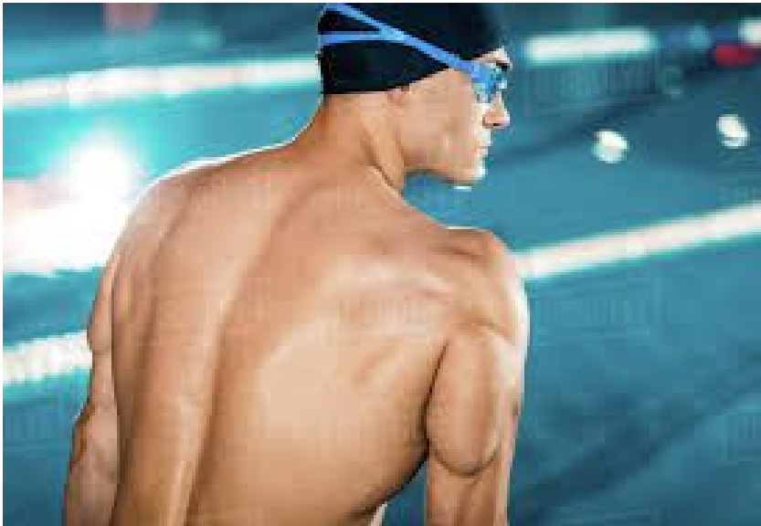
Slika 5. Mišići leđa

nisu jedini mišići važni za fazu povlačenja ali su od esencijalne važnosti i treba ih trenirati.