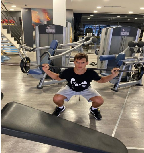
Slika 7. Izvođenje stražnjeg čučnja