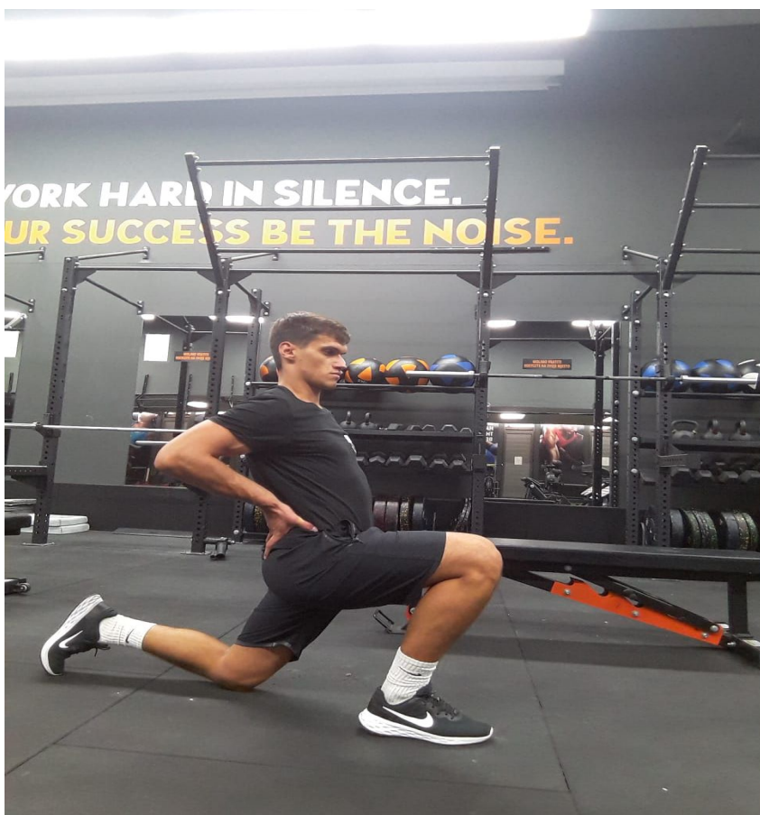
Slika 26. Istezanje kukova