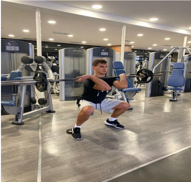
Slika 9. Izvođenje prednjeg čučnja