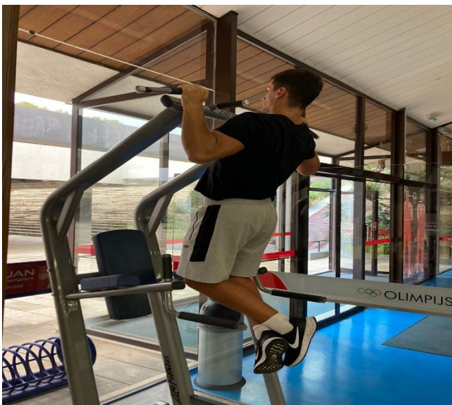
Slika 17. Izvođenje zgibova

Važna za razvijanje snage gornjeg dijela tijela. Leđa su velika skupina mišića koja ima ključnu ulogu u postizanju dobrog zaveslaja te na taj postizanja velike brzine. Može se raditi sa vlastitom težinom, pojasom ili način pomaže kod odjelom sa opterećenjem. Također jača gornji dio tijela (gornja leđa i ruke), što je jako dobra vježba za dugoprugaše.