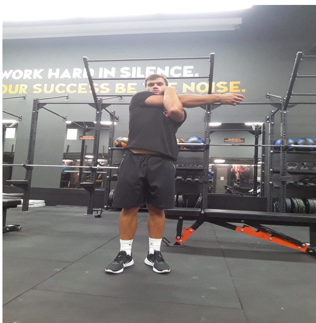
Slika 25. Istezanje ramena