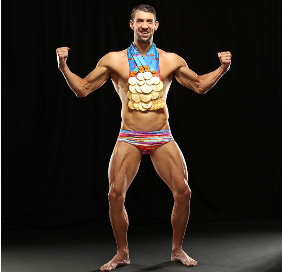
Slika 4. Michael Phelps, mišići nogu