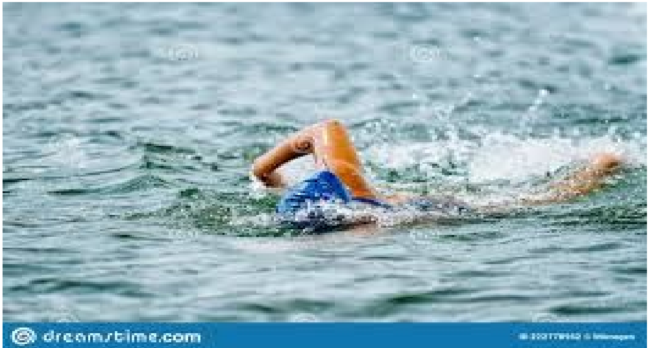
Slika 1. Tehnika dugoprugaša