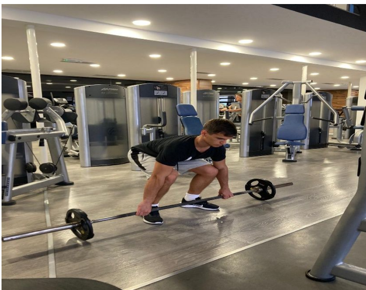
Slika 16. Izvođenje mrtvog dizanja