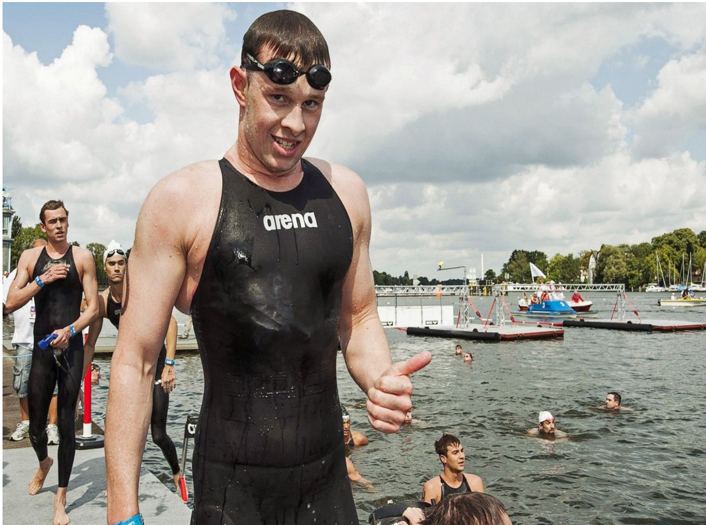
Slika 2. Morfološka građa dugoprugaša