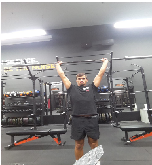
Slika 13. Izvođenje potiska iznad glave

važno istaknuti da se plivači dok plivaju nalaze u položaju ove vježbe tako da vježbanje u tom položaju je jako efikasno i prirodno za plivače.