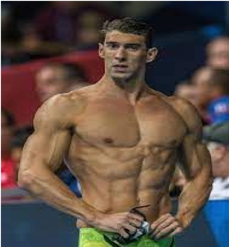
Slika 3. Michael Phelps, mišići trupa

vodi, rotaciju tijela i fleksiju. Povezuju gornji i donji dio tijela što omogućuje brže plivanje. Jako su važni za plivanje tako da im se treba posvetiti puno pažnje u treningu.