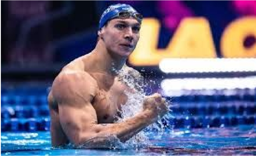
Slika 6. Caeleb Dressel, mišići ruku