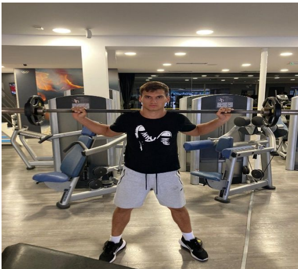
Slika 8. Izvođenje stražnjeg čučnja