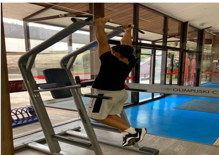
Slika 19. Izvođenje zgibova s uskim hvatom

Slični kao zgibovi samo što je kod njih veća koncentracija na bicepsu, ali su i dalje aktivirana gornja leđa. Pomaže kod razvijanja maksimalne snage i eksplozivnosti u gornjem dijelu tijela. Može se raditi s utezima i sa opterećenjem. Dobra je za dugoprugaše jer razvija snagu i fazu povlačenja vode.