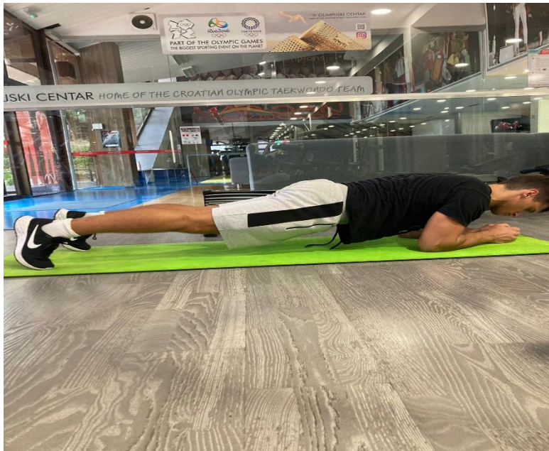
Slika 23. Izvođenje prednjeg izdržaja