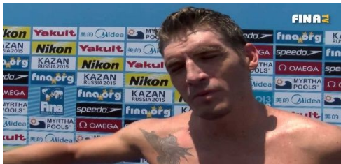
Slika 29. Spiros Gianniotis svjetski rekord na 10 km