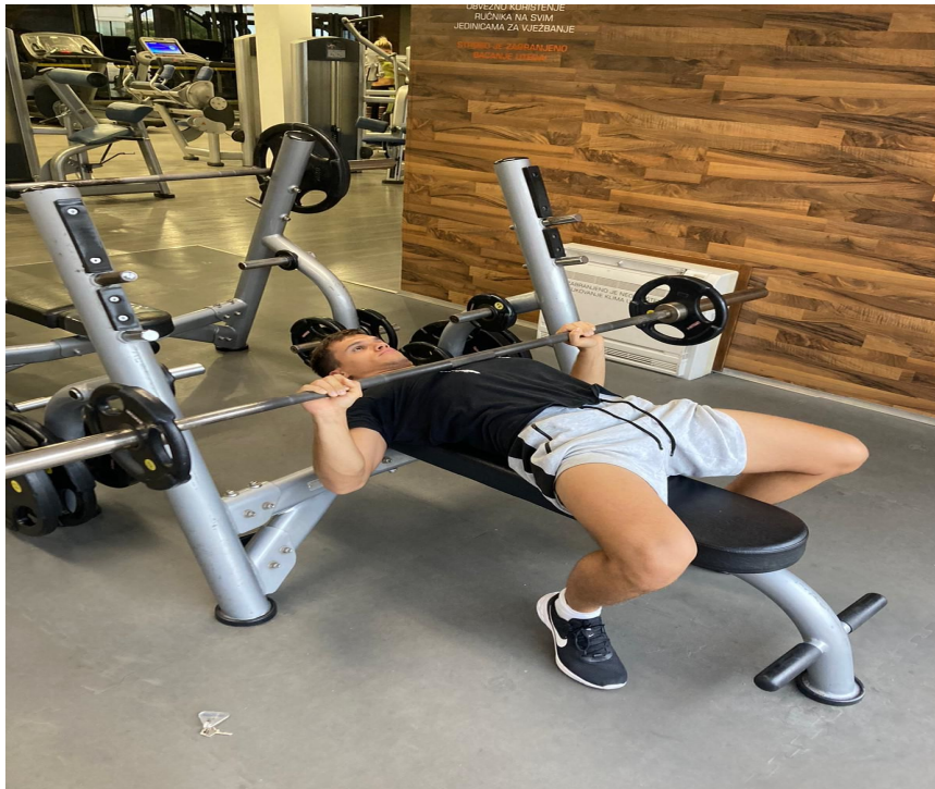
Slika 11. Izvođenje potiska na klupi