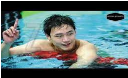
Slika 28. Zhang Lin svjetski rekord na 800 m