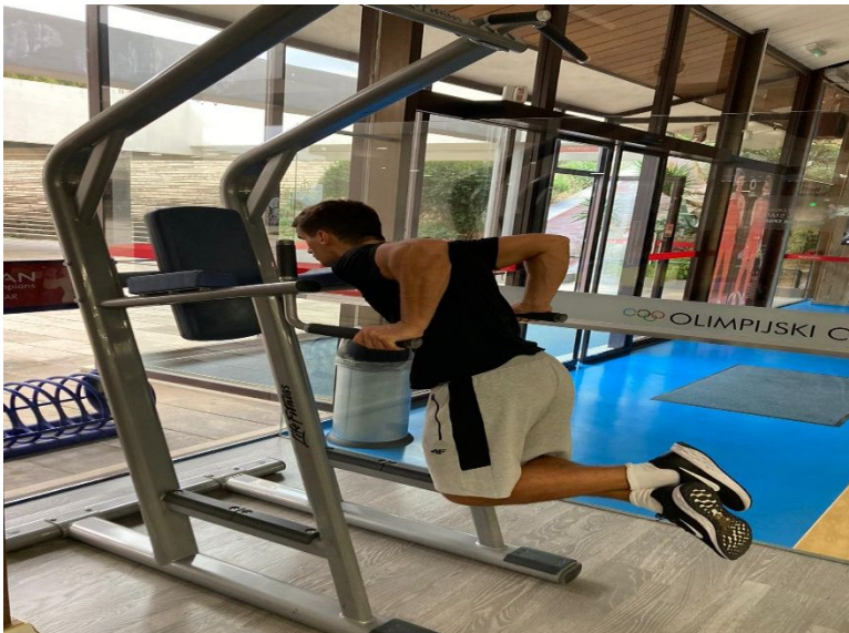
Slika 22. Izvođenje propadanja