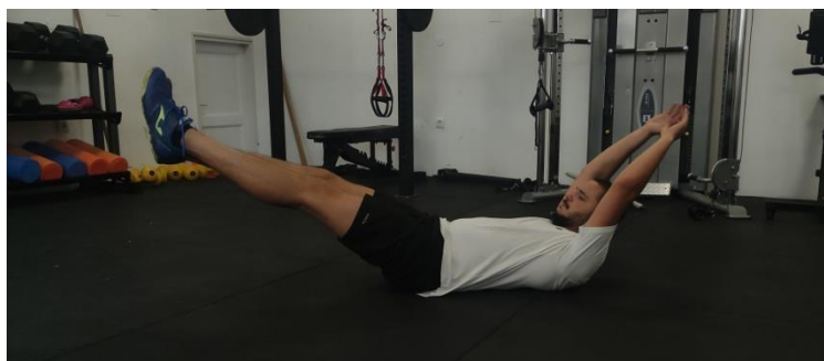
Slika 8. Hollow body hold