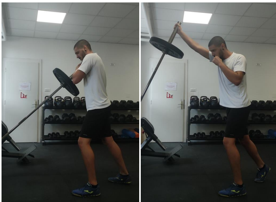
Slika 5. Jednoručni izbačaj s T – šipkom