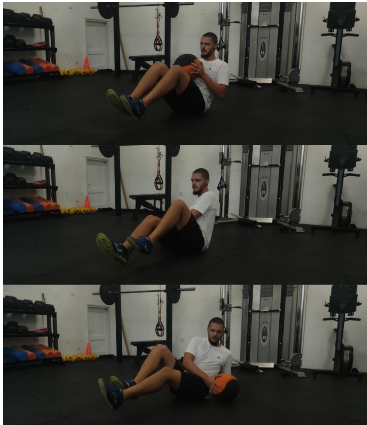
Slika 7. Russian twist