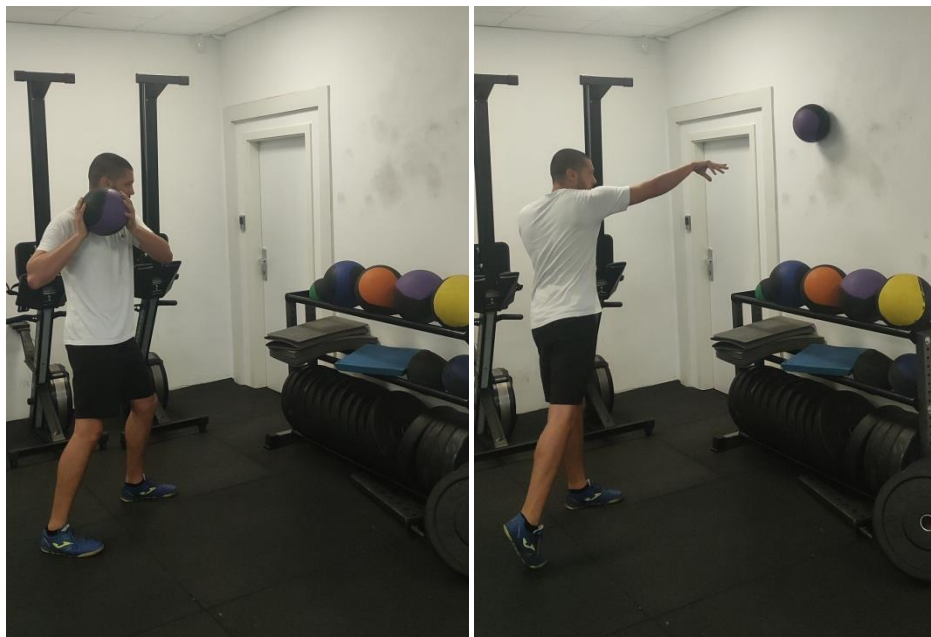
Slika 3. Jednoručno bacanje medicine u zid

Napomena: sve vježbe su unilateralne i izvode se naizmjenično jednom, pa drugom rukom (bez odmora između) te se broj ponavljanja odnosi na svaku ruku posebno.