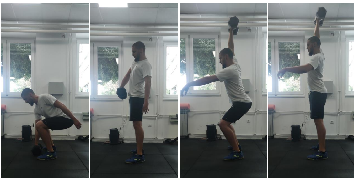
Slika 4. Jednoručni trzaj s bučicom