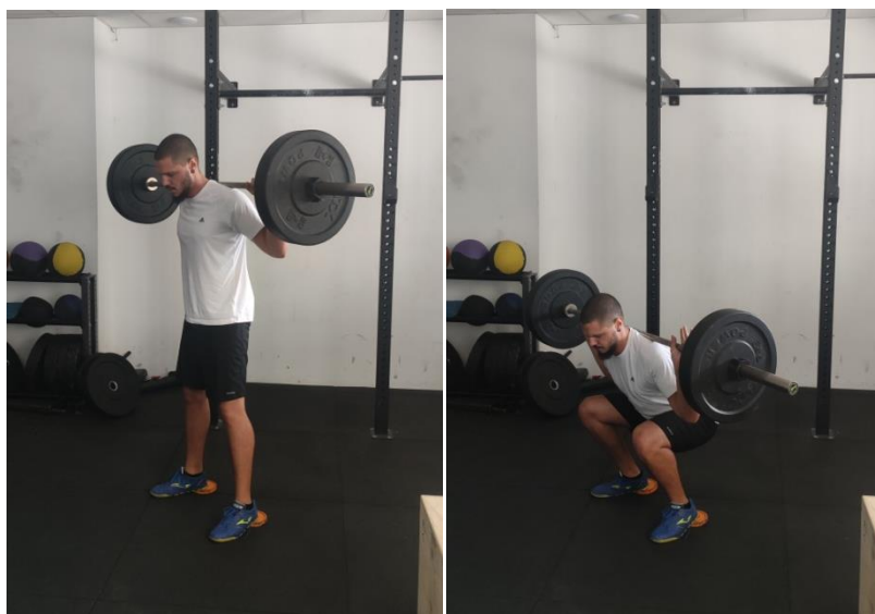
Slika 1. Čučanj