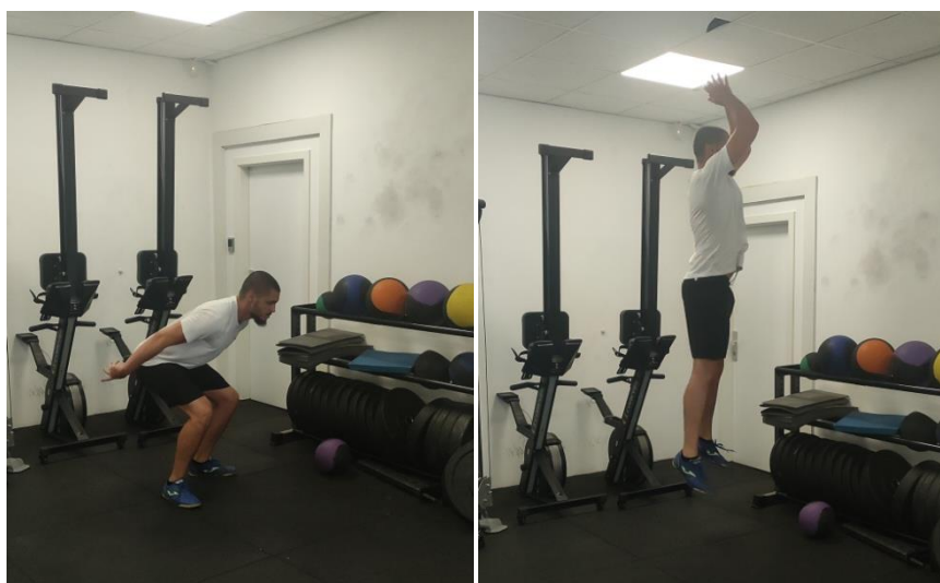
Slika 2. Vertikalni skok iz čučnja